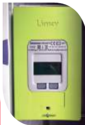
Compteur d'électricité Linky

https://www.quechoisir.org/action-ufc-que-choisir-compteur-linky-le-vrai-du-faux-n11627