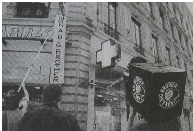
Photo in J. A., « Vidéosurveillance : la manif anti », Le Progrès , 14 juin 2001.