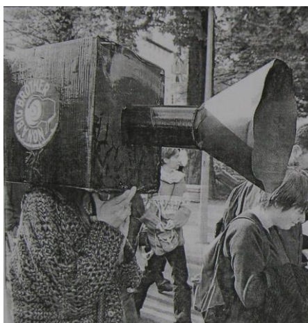
Photo de Pierre Augros, in Gaëlle Arrieus, « Deux cents personnes manifestent contre la vidéosurveillance », Le Progrès , 8 octobre 2000.