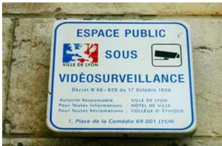
Photo publiée dans l'article suivant : Gilles Kuntz, « Droit à l'information respecté... à Lyon... pas à Grenoble », 12 novembre 2008 (page consultée le 3 juillet 2018) http://www.gilleskuntz.fr/?p=374