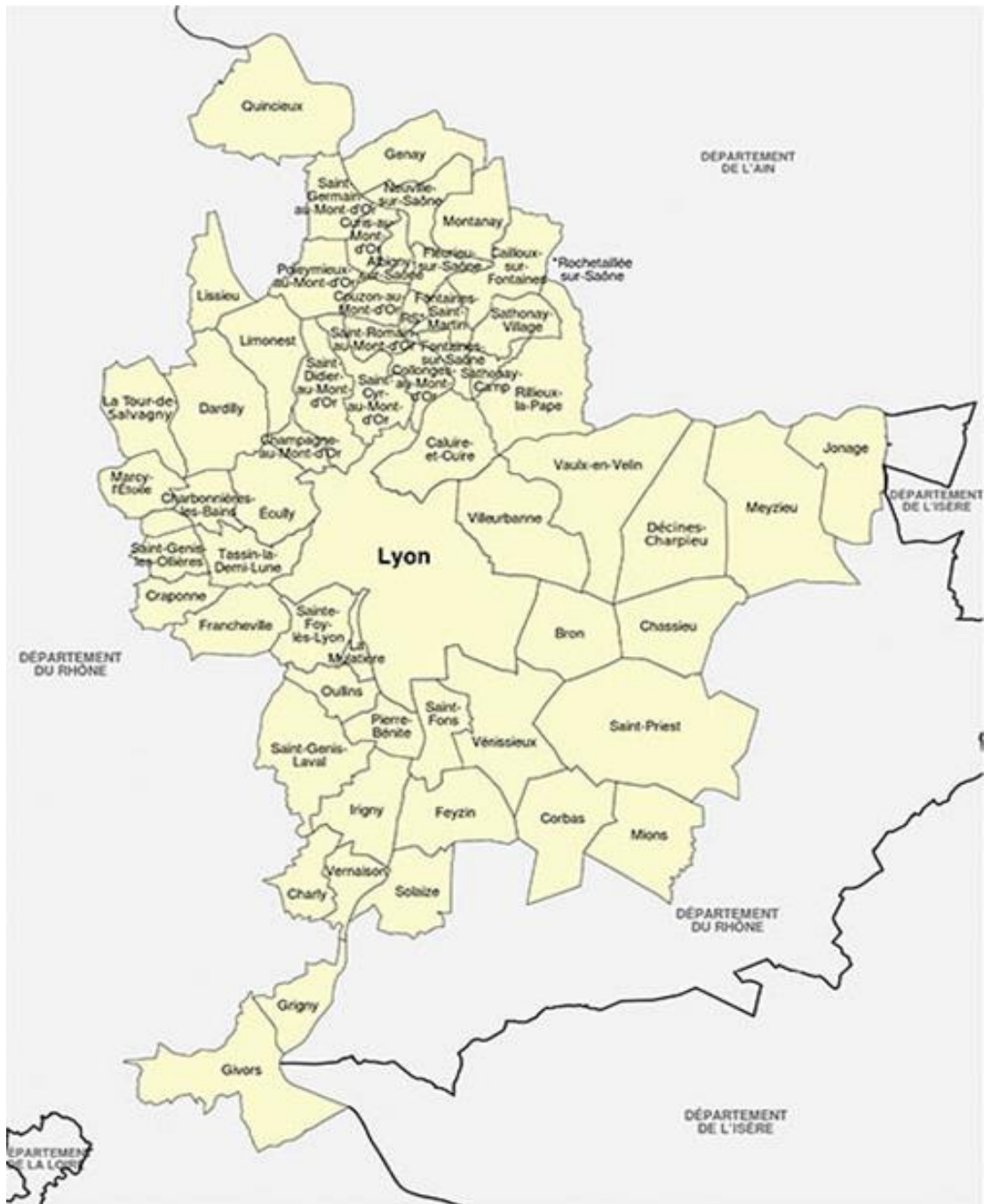
Carte de la Métropole de Lyon, Bulletin des bibliothèques de France (BBF) , publiée en 2017 (page consultée le 10 février 2022) http://bbf.enssib.fr/consulter/bbf-2017-12-p63.jpg . ISSN 1292-8399