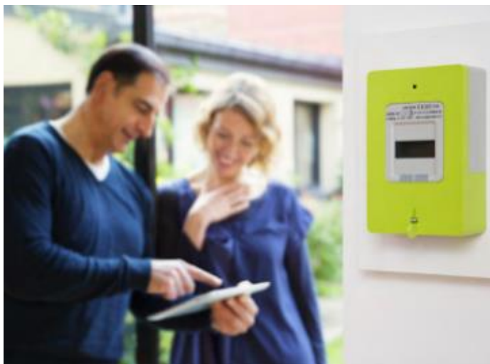
Photo figurant dans le fascicule « Le compteur Linky et moi », Enedis , mai 2016. Ce fascicule a été trouvé sur un présentoir situé à l'accueil de la Mairie de Saint-Genis-Laval, le 15 février 2018.