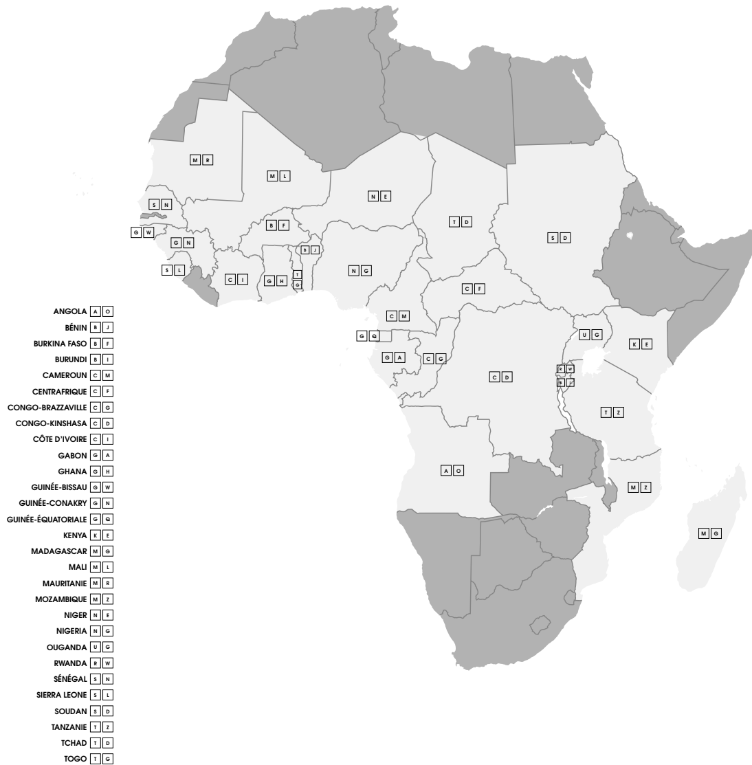
Carte identifiant les 29 États d'Afrique subsaharienne compris dans cette étude 1