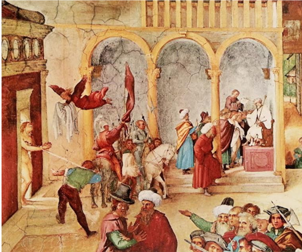
13. Idem, détail : l'ange apporte la veste à Barbe après l'amputation des seins.