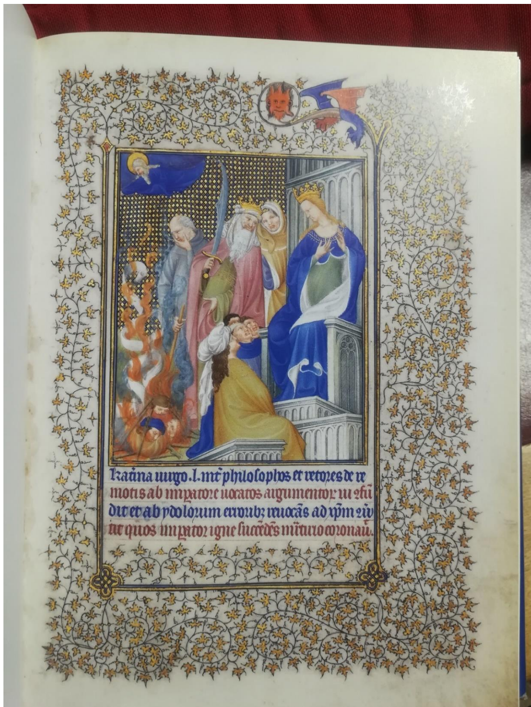
28. Sainte Catherine confondant les Docteurs, Les Belles Heures du duc de Berry , New York, Metropolitan Museum, Acc.no.54.1.1, folio 16 [source : Les Belles Heures du duc de Berry , sous la dir. de H. Grollemund-P. Torres, Editions Louvres, Paris, 2012].