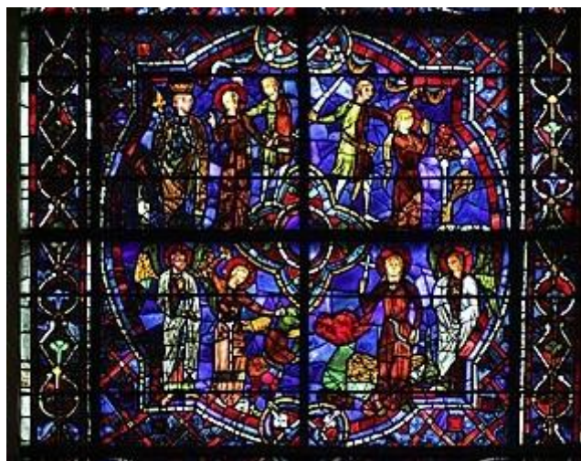
20. Vitrail de sainte Marguerite et de sainte Catherine, Cathédrale de Chartres, détail de la légende de sainte Marguerite, XIII e siècle.