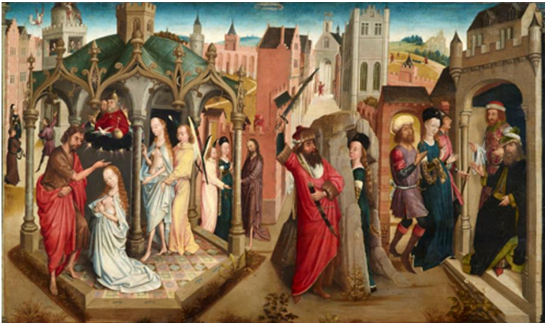
8. Le triptyque du maître de la Légende de Sainte Barbe , panneau central, Musées royaux des Beaux-Arts, Bruxelles.