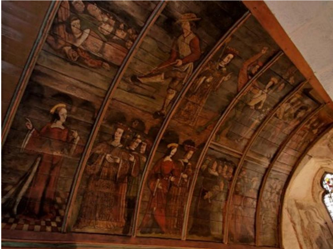
15. Cycle de sainte Barbe, Voûte lambrissée de la chapelle des forgerons, Église de Saint-Martin-de-Connée (Maine), fin XV e /début XVI e siècles.