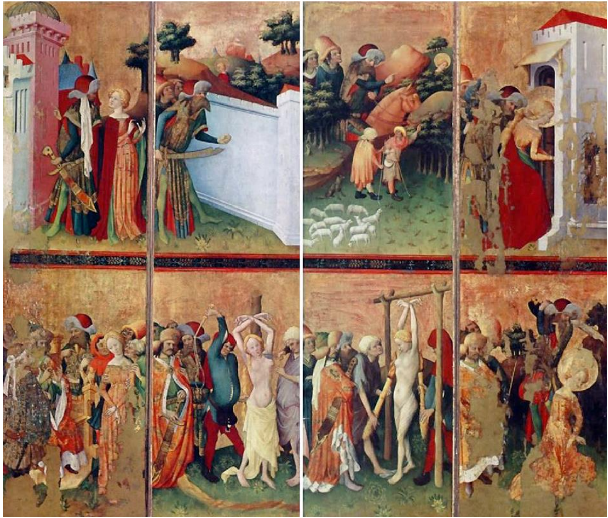
21. Meister Franck, Retable de sainte Barbe , Museum National de Finlande, Helsinki (première moitié du XV e siècle).