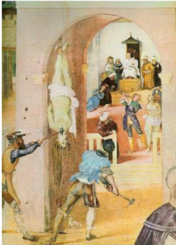
11. Idem, détail : supplice des marteaux.