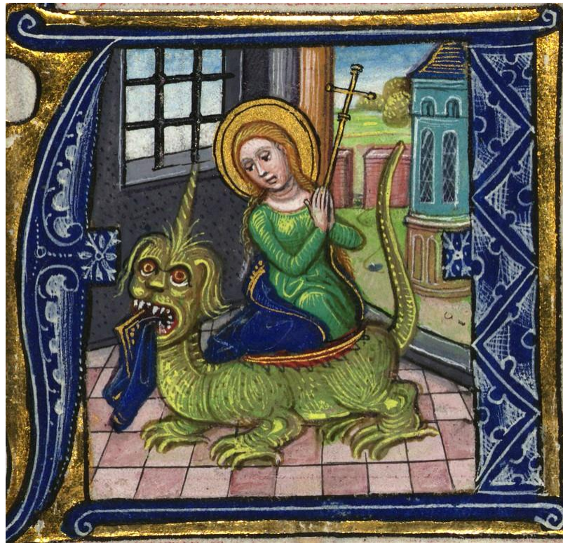
22. Livre d'Heures, Walters ms W267, fol. 222r, XV e siècle.