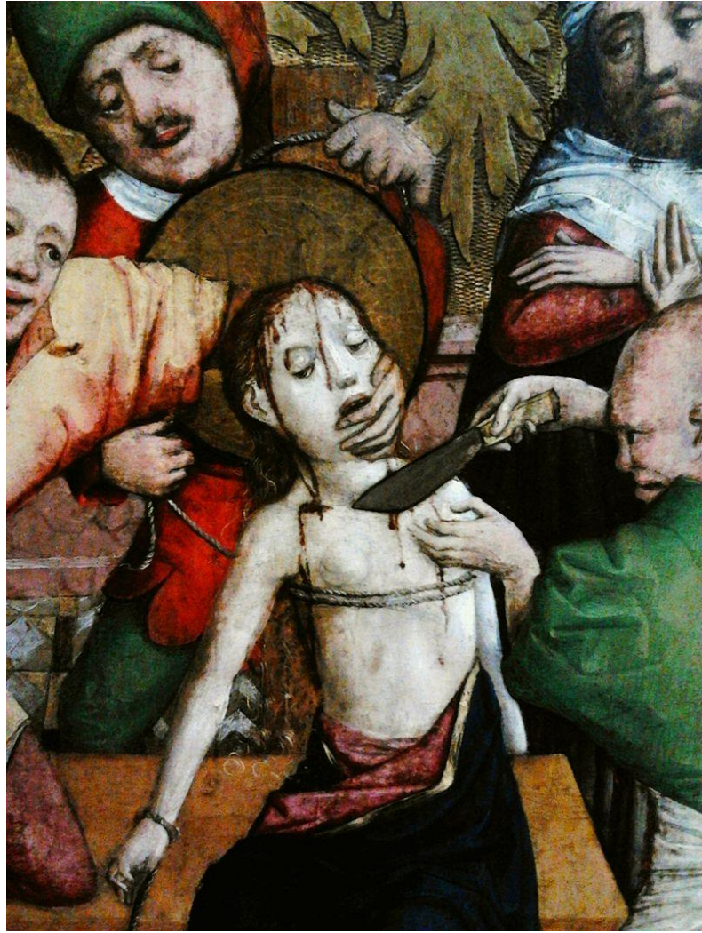
20. Wilhelm Kalteysen, Sainte Barbe , Wroslav National Museum, 1447, detail.