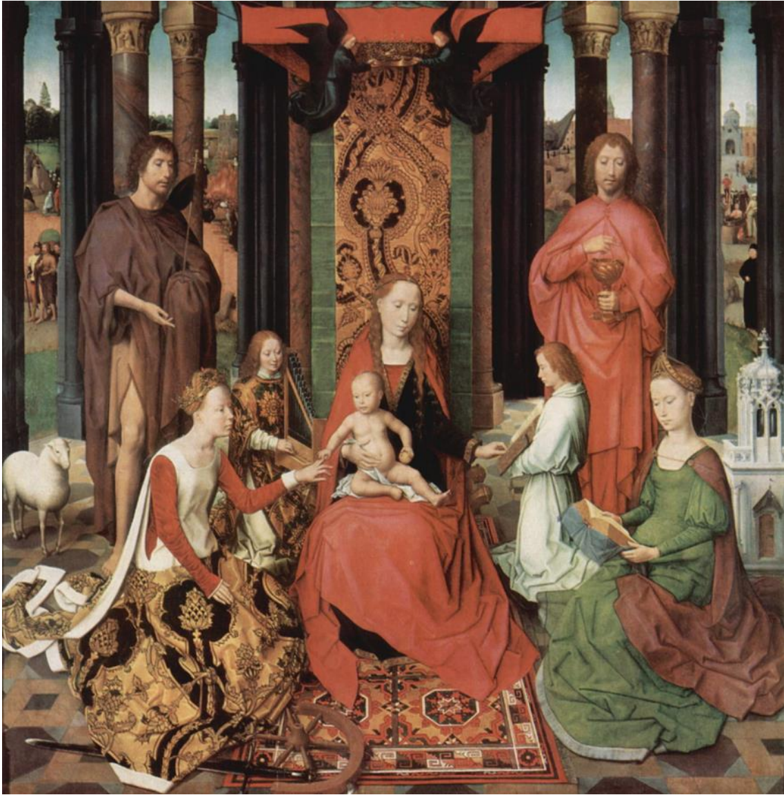
14. Hans Memling, Mariage mystique de sainte Catherine , Musée de l'Hôpital Saint-Jean de Bruges, 1479. Sainte Barbe avec un livre.