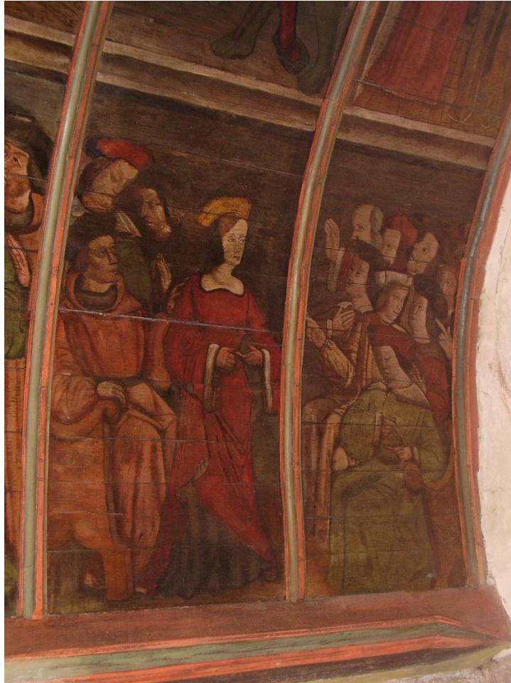
17. Panneaux E, F : Barbe explique aux chevaliers païens ses positions.