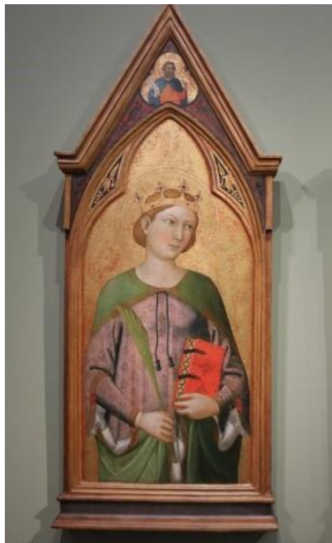
27. Jacopo del Casentino, Sainte Catherine d'Alexandrie , 1330-1335, Collection privée Alana (exposée au Musée Jacquemart-André en 2019/2020)