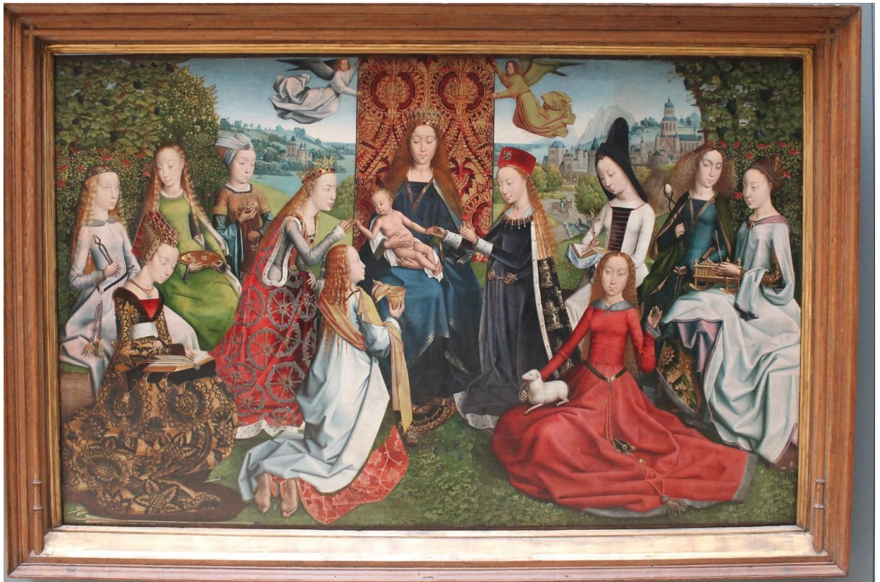
33. Maître de la légende de sainte Lucie, Virgo inter Virgines , Musées royaux des Beaux-Arts, Bruxelles, dernier quart du XV e siècle.