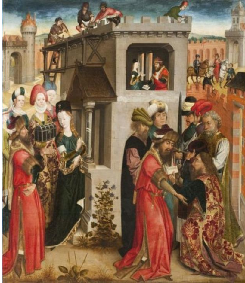
7. Le triptyque du maître de la Légende de Sainte Barbe , panneau de gauche, Musée du Saint-Sang, Bruges, dernier quart du XV e siècle.