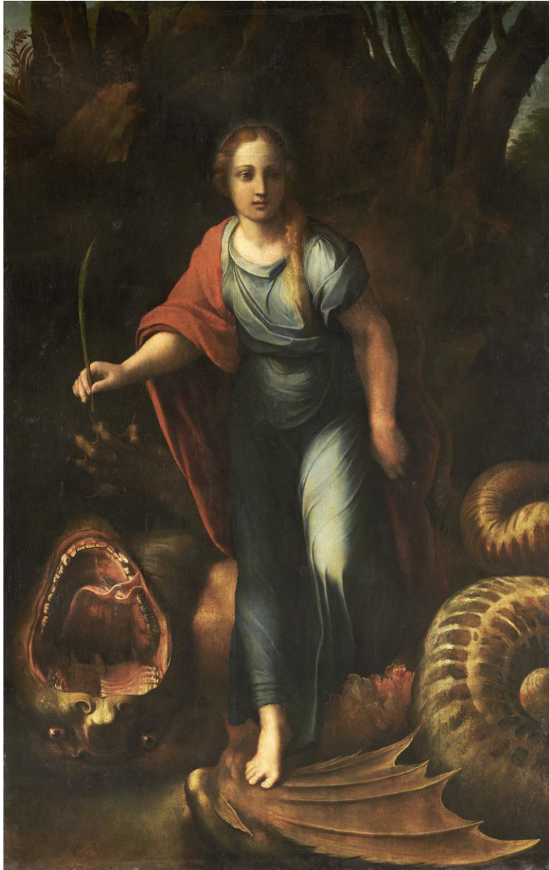
25. Raffaello, Giulio Romano, Santa Margherita , 1518, Musée du Louvre.