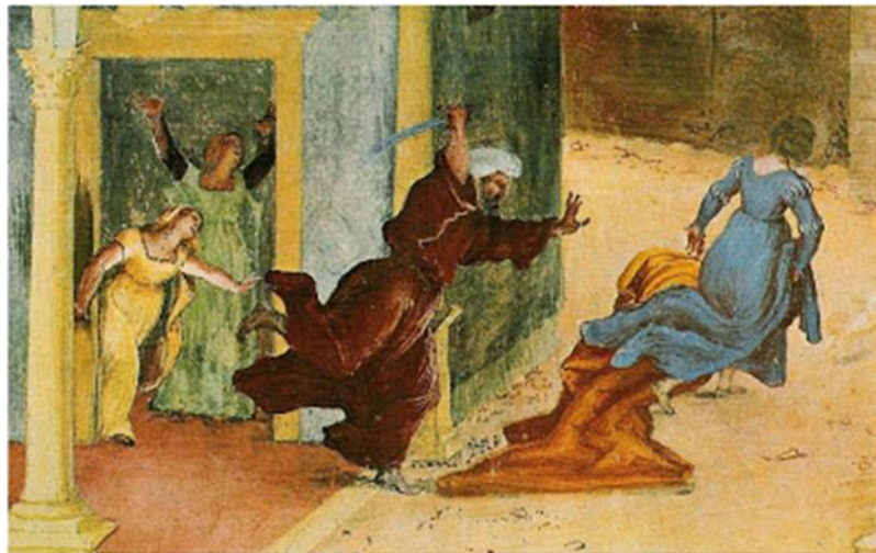
10. Idem, détail : fuite de Barbe