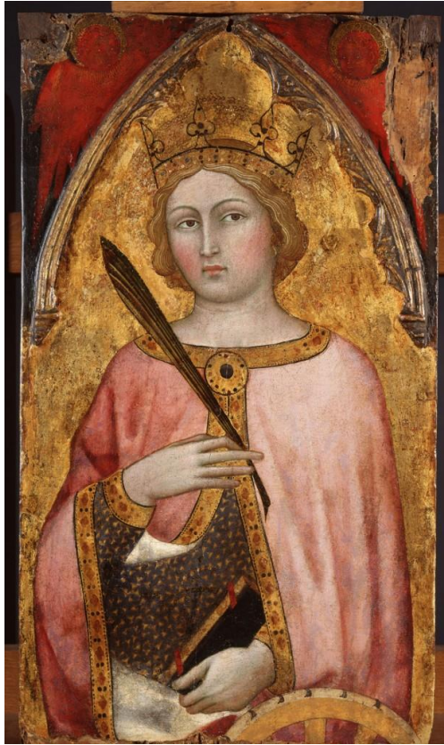
26. Taddeo di Bartolo, Santa Caterina d'Alessandria , XIV e siècle, Caen, Musée des Beaux-Arts.