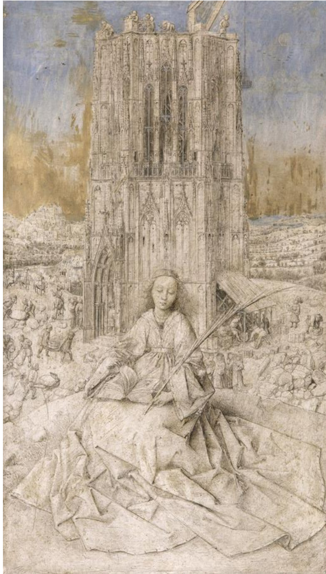
6. Jan van Eyck, Sainte Barbe , Musée Royal de Beaux-Arts d'Anvers, 1437, dessin sur panneau.