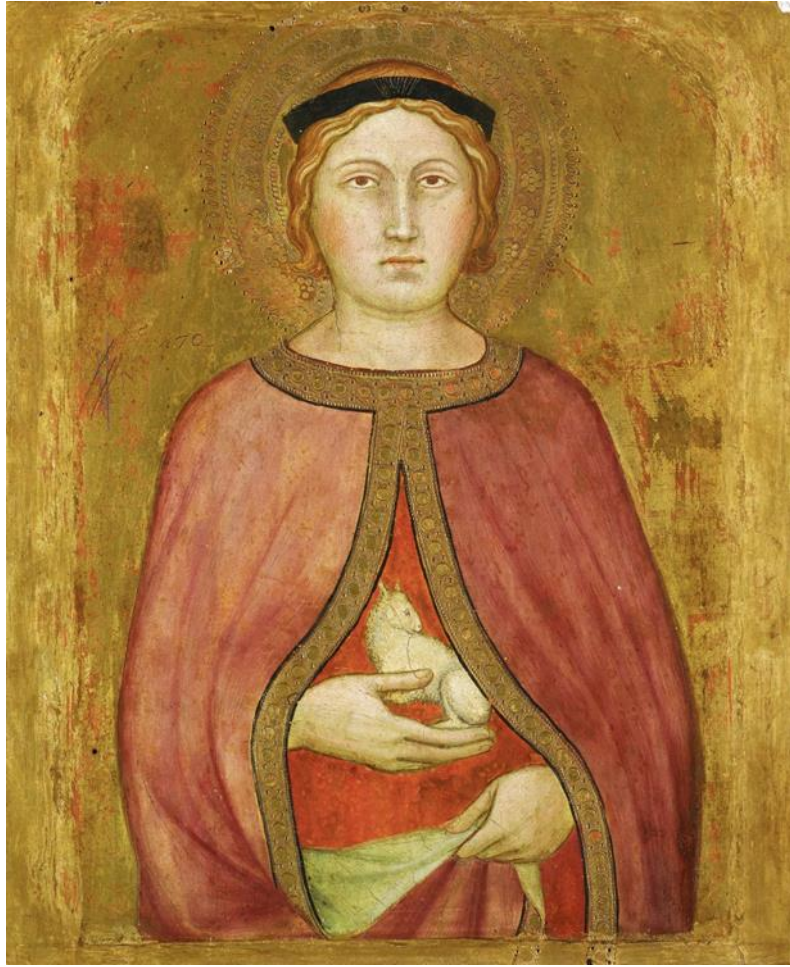
3. Taddeo di Bartolo, Sant'Agnese , scuola senese, Collection Liechtenstein, Vienne (XV e siècle).