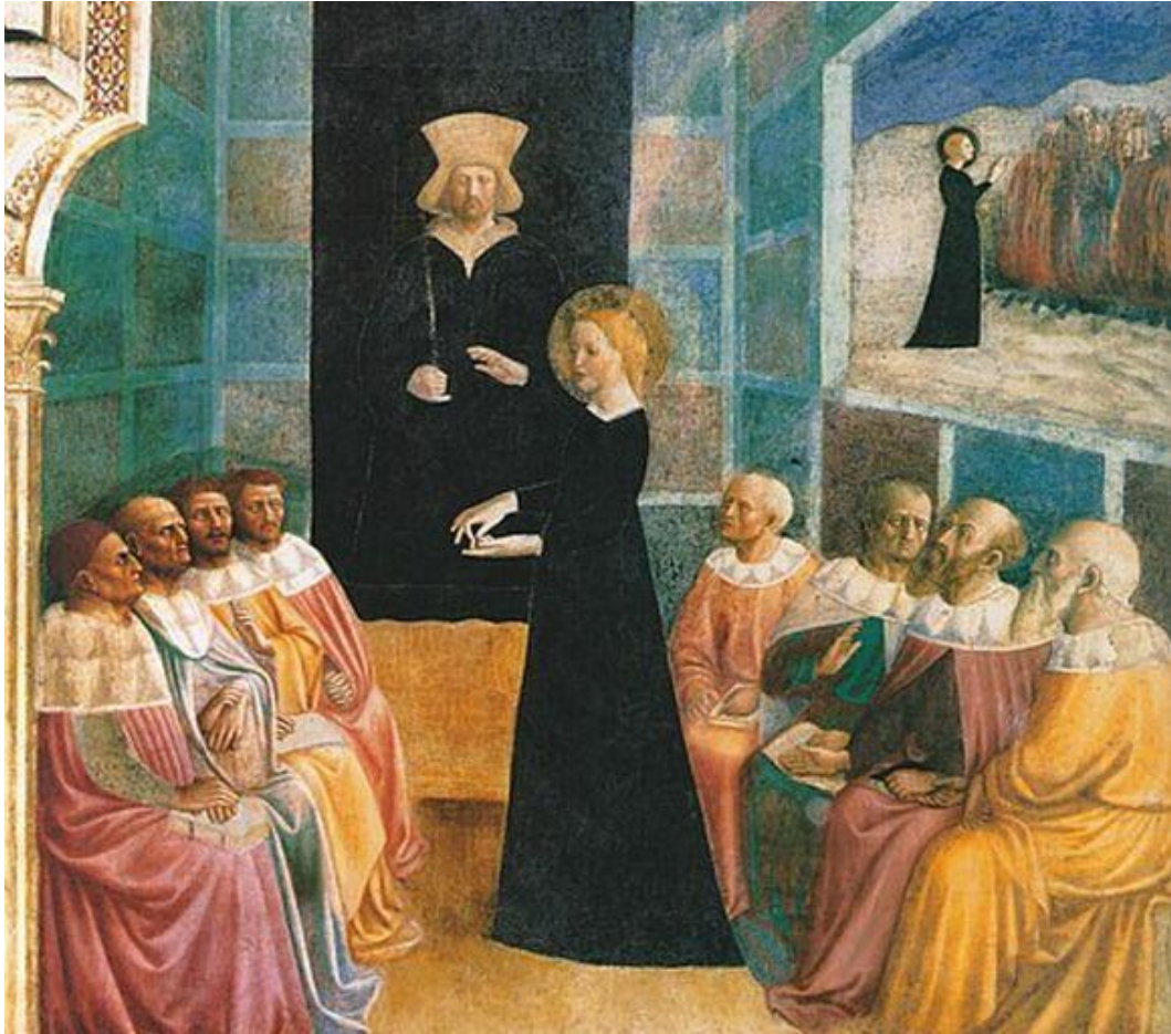
29. Masolino, Dispute de S. Catherine avec les philosophes , 1427-30. Chapelle de Sainte Catherine, Rome, San Clemente.