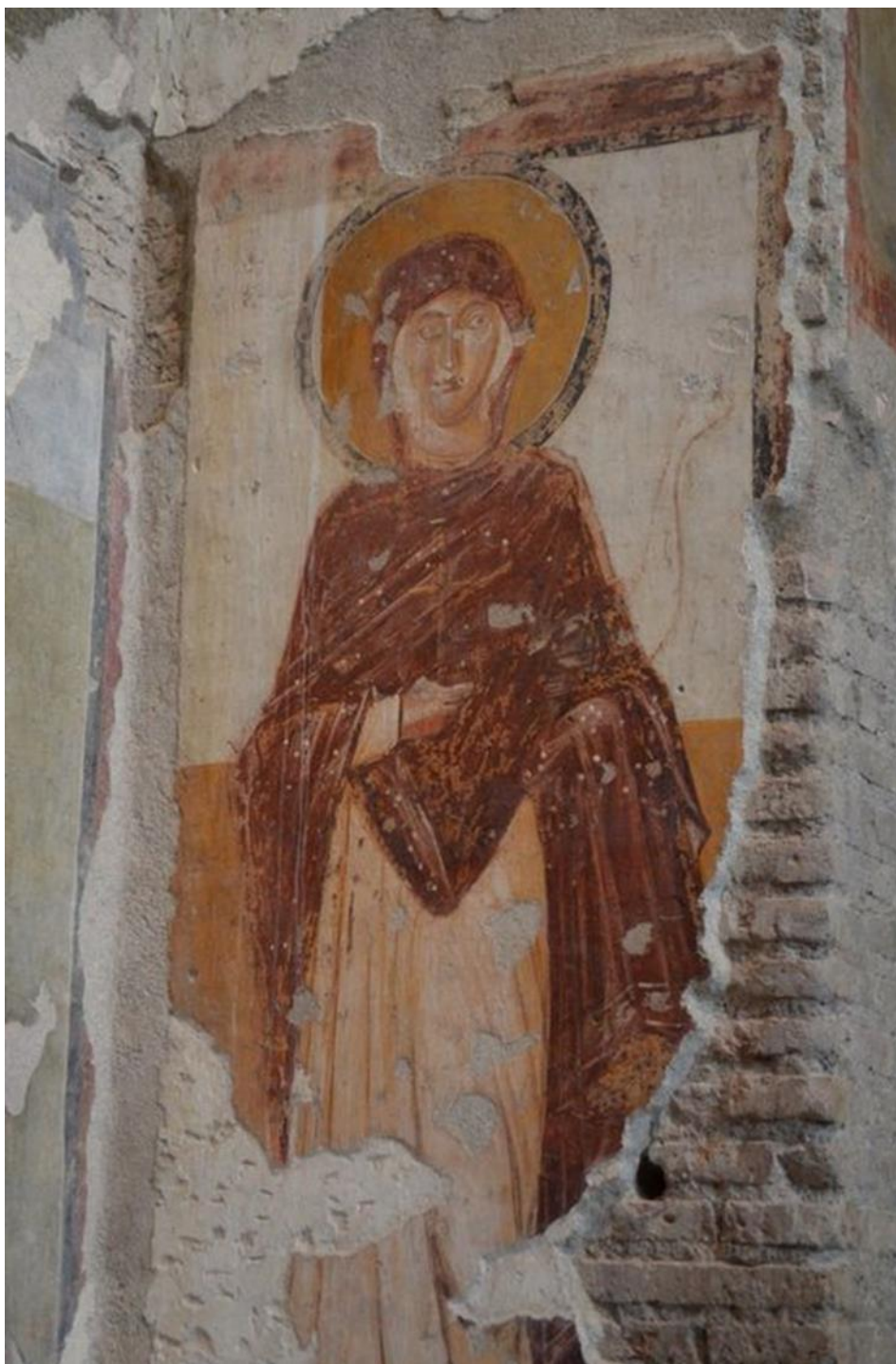
4. Sainte Barbe, Fresque de l'église Santa Maria Antiqua, Rome, VII e siècle.