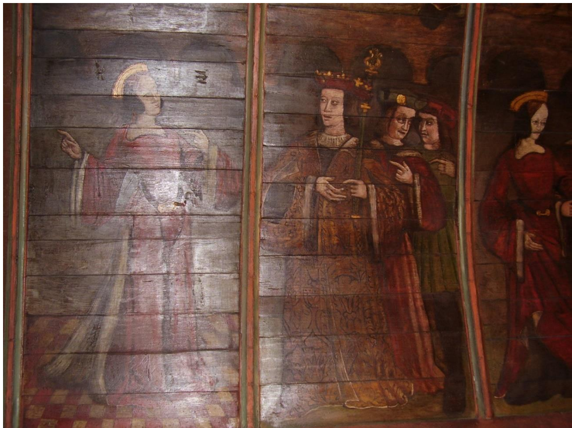
16. Panneaux A, B : Barbe discute avec le père, en présence des deux docteurs, Dioscorus conduit Barbe chez les prétendants.