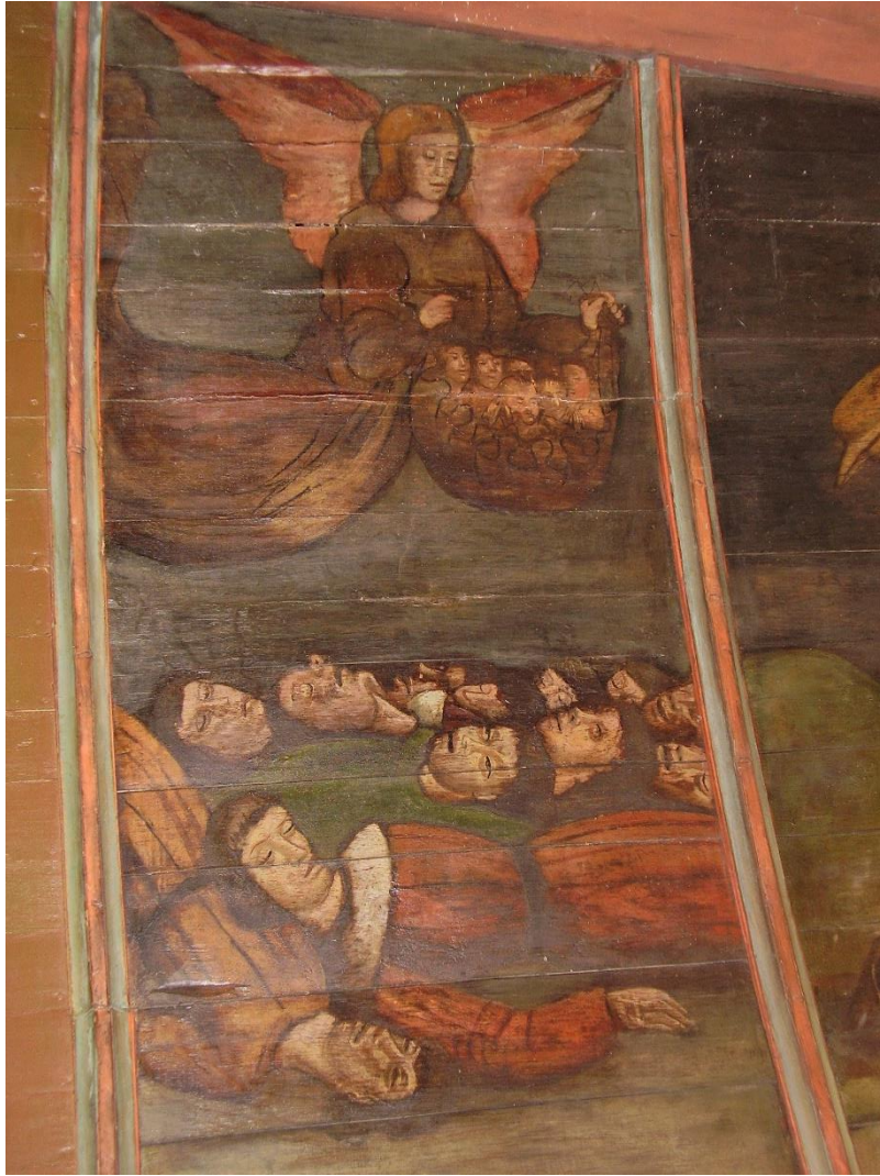
19. Panneau L : les soldats de l'armée chrétienne.