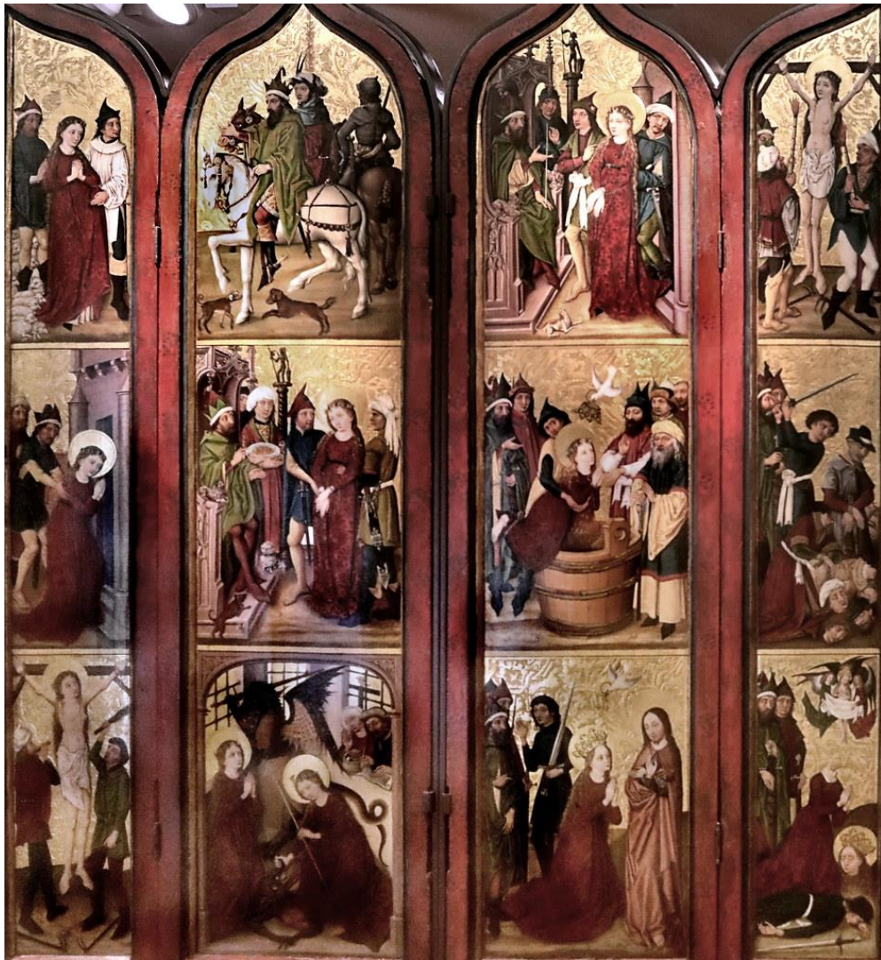
24. Maître des Ronds de Cobourg, Retable de sainte Marguerite , Musée Beaux-Arts Dijon, fin du XV e sec.