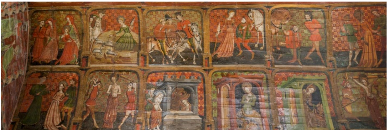
23. Châtelaudren, Peintures du lambris de la chapelle Notre-Dame du Tertre, Vie de sainte Marguerite , XV e siècle.