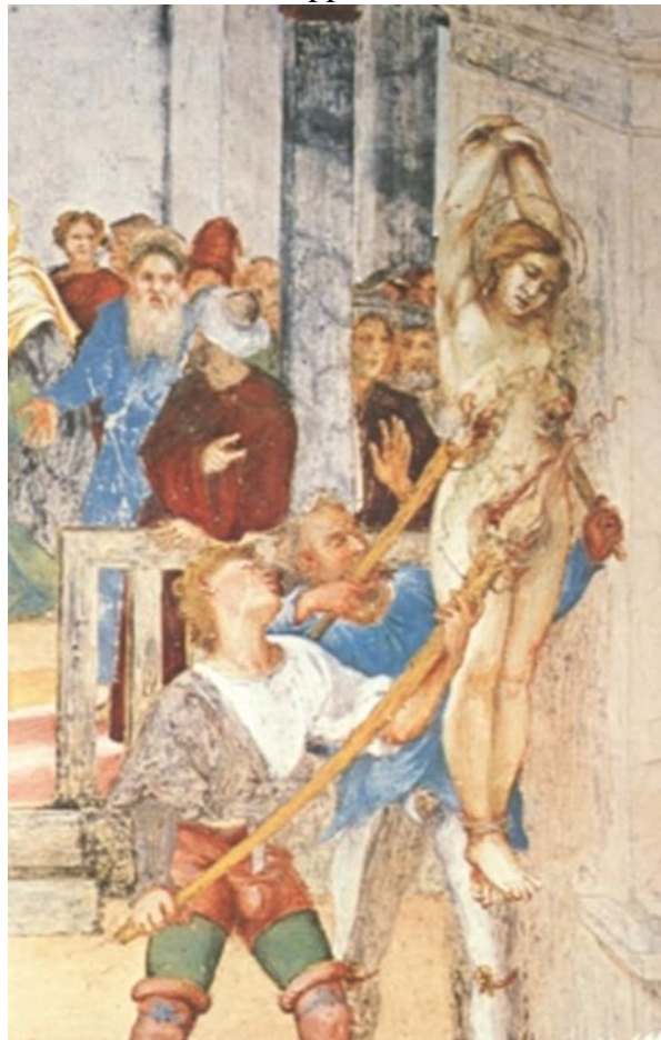
12. Idem, détail : supplice des torches.