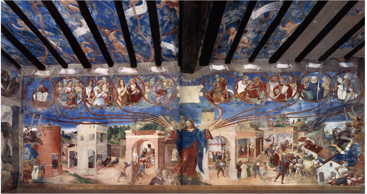
9. Lorenzo Lotto, Cristo-Vite e Storie di Santa Barbara , Cappella Suardi, Trescore Balneario, 1524.