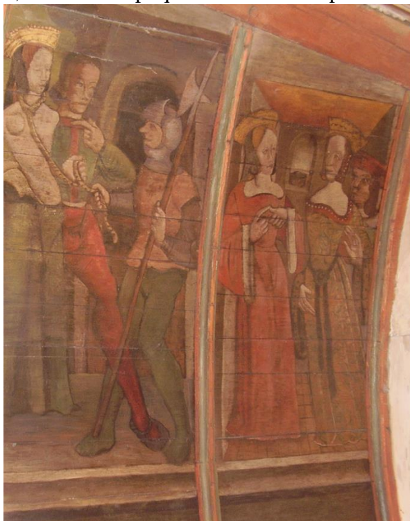
18. Panneau G (droite) : Barbe se dispute avec la mère.