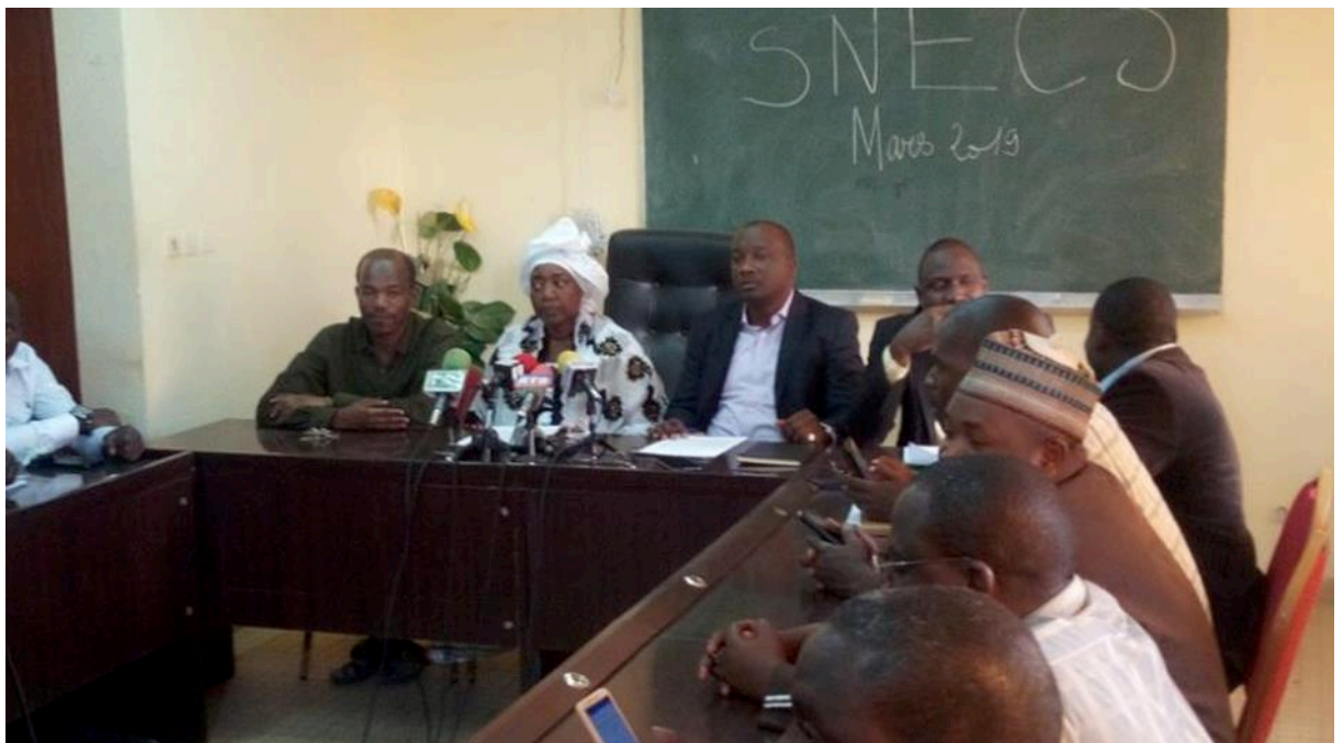
Déclaration du SNECS du 8 mars 2019.

Un univers masculin qui admet symboliquement les femmes