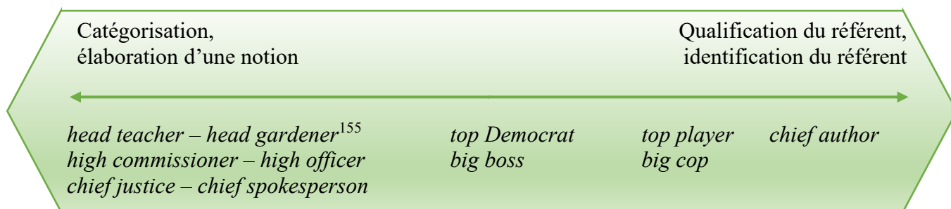
Figure 1. Continuum du rôle de catégorisation des dépendances

On pourrait représenter ainsi ce continuum :