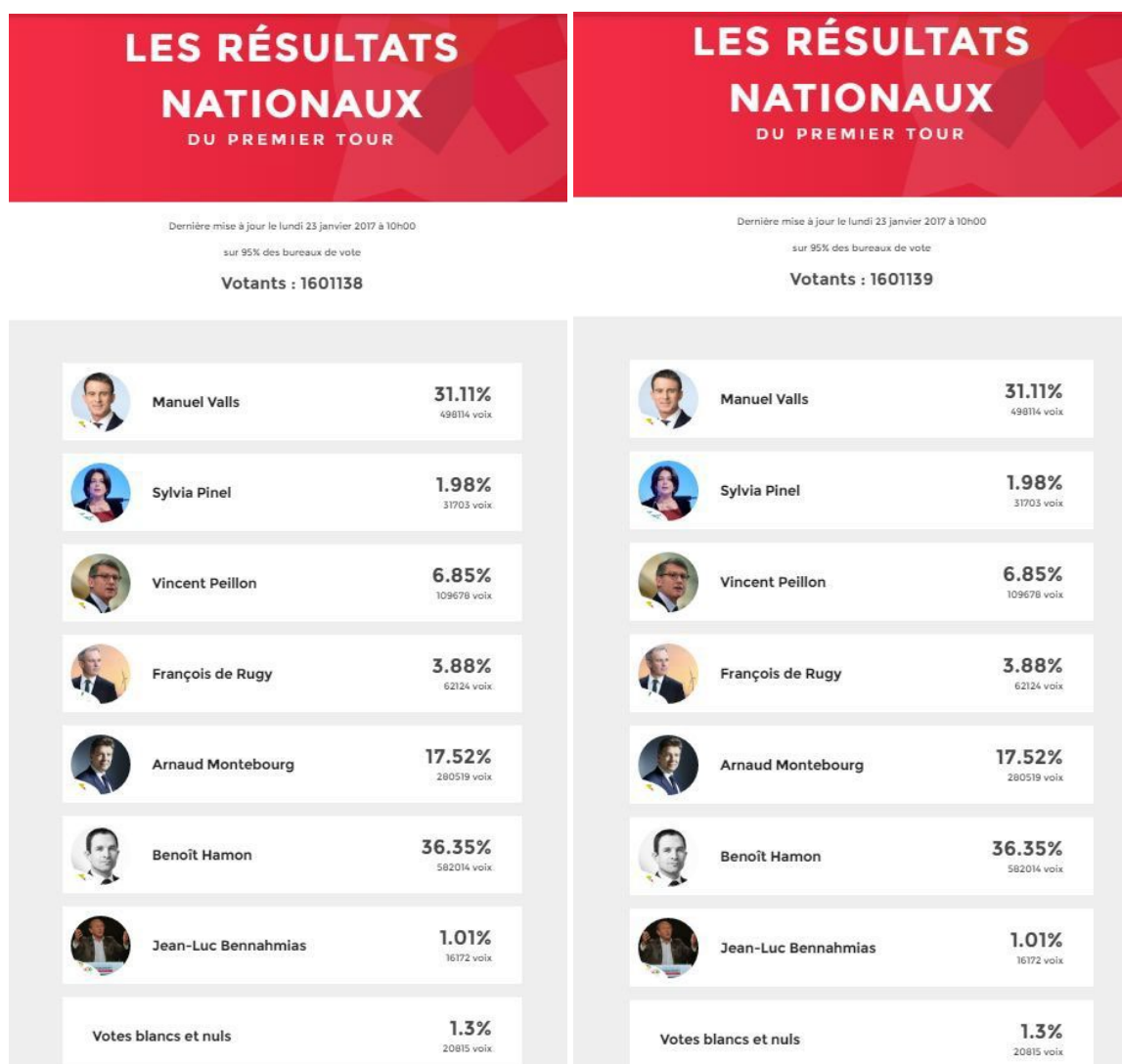
Image 2 : Projection en ligne des différentes projections des résultats du premier tour de la « primaire citoyenne » organisée par la Belle Alliance Populaire le lundi 23 janvier à 10h00