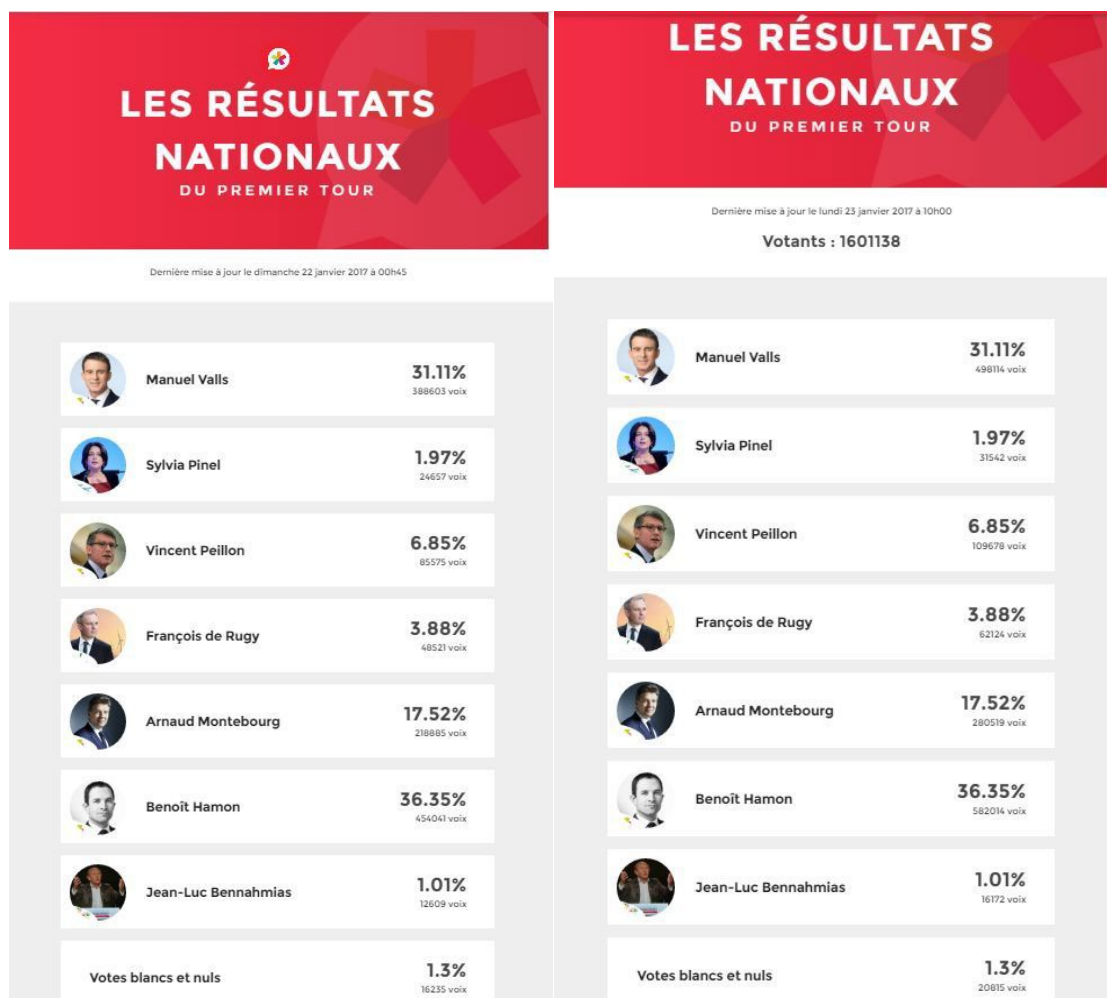
Image 1 : Projection en ligne des résultats du premier tour de la « primaire citoyenne » organisée par la Belle Alliance Populaire le dimanche 22 janvier 2017 à 0h45 et le lundi 23 janvier à 10h00

(Images diffusées sur le site internet libération.fr le 23 janvier 2017 993 )