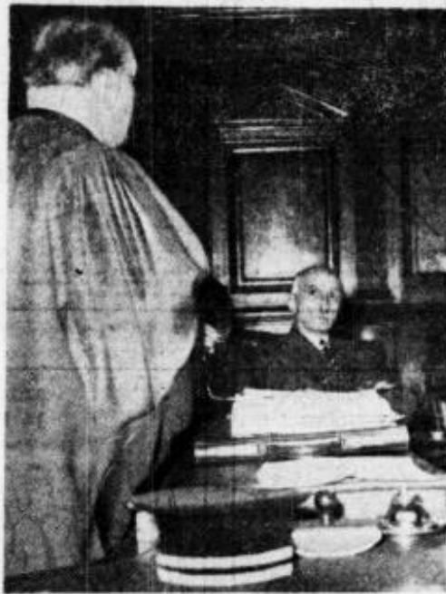
François Mauriac est un juré consciencieux et attentif.

Hérédité, interpréter les signes dans les entrailles des coctines — et cela en trois quarts d'heure et en gardant le contact avec les doses bourgeoises qu'ils ont dérangés tout exprès et qu'il faut bien distraire un peu. Et c'est pourquoi M. l'avocat général leur a lu, selon les règles, les lettres d'amour de l'accusée. « Mon adoré, je ne puis attendre quarante-huit heures... » J'ai fait un effort, j'ai regardé le juré dont les épaules tressaillent. « Il a efflué encore. Ceci m'a frappé d'abord à la cour d'assises.