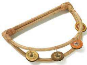
Tambourin à capsule