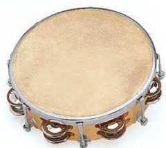
Tambour de basque