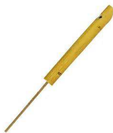
Siflet à coulisse