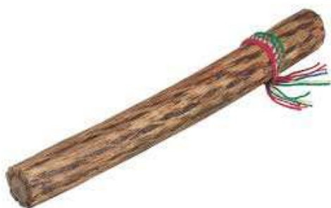
Bâton de pluie