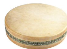
Tambour de l'océan