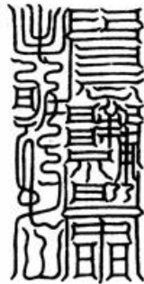
Fig. 1 : Le Caractère du Très Haut des trois cieux pour soumettre les dragons, les tigres et les léopards ainsi que les esprits de la montagne

De Yang Xi nous ne savons donc presque rien, si ce n'est qu'il avait un frère cadet 70 et qu'il était doué de qualités lettrées indéniables. Tao Hongjing nous apprend, de plus, que Yang avait déjà eu auparavant possession de matériaux taoïstes anciens, dont le Zhonghuang zhi hu pao fu 中黃制虎豹符 (L'Ensemble talismanique du centre et du jaune pour maîtriser les tigres et les léopards ; cf. fig. 1), en deux courts rouleaux, qui lui fut transmis en 349. L'année suivante, il reçut de la part du fils aîné de Wei Huacun, Liu Pu 劉璞 (IV e s.), le Lingbao wufu jing 靈寶五符經 (Le Livre des cinq talismans du Joyau magique). Tao fonde ces informations sur des mentions manuscrites de Yang lui-même 71 . Nous nous situons ici à une quinzaine d'années avant les premières révélations du Shangqing et Liu Pu n'était pas une figure déifiée mais bel et bien un homme ; la transmission du texte n'avait donc rien de théophanique. Sans doute s'agit-il d'un écho historique de la genèse du mouvement. À cela s'ajoute le fait que le Taishang lingbao wufu xu contient encore aujourd'hui un talisman intitulé Santian Taishang fu jiaolong hubao shanjing wen 三天太上伏蛟龍虎豹山精文 (Le Caractère du Très Haut des trois cieux pour soumettre les dragons, les tigres et les léopards ainsi que les esprits de la montagne) :