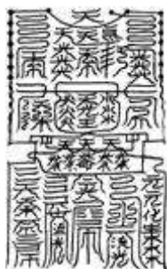
Fig. 3 : Le talisman Clochette de feu et d'or liquide

( Lijing buoling ; CT 1332, fasc. 1030 : 8a)