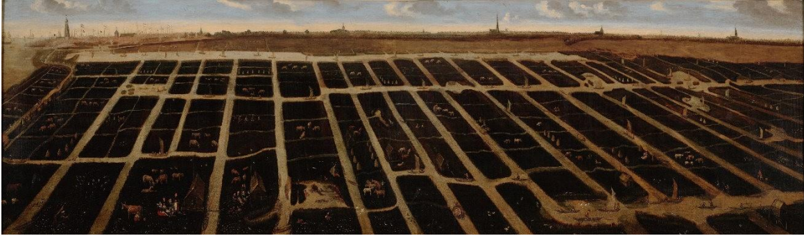
Figura 6 - Anonimo, Gezicht op de polder Het Grootslag en de stad Enkhuizen (1610), Rijksmuseum Zuiderzeemuseum Enkhuizen

una delle numerose vedute paesaggistiche, rese tanto celebri dall'arte olandese seicentesca (Fig. 6)? 81