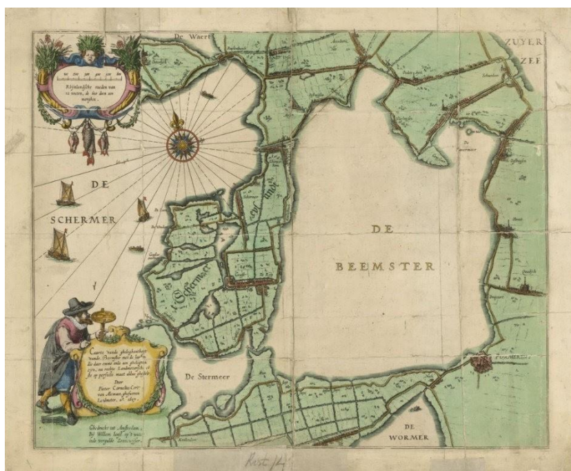
Figura 4 - Pieter Cornelisz Cort, Kaart van de Beemster , 1607.

Quando nel 1644, il poeta Joost van den Vondel celebrò, in un componimento poetico, il