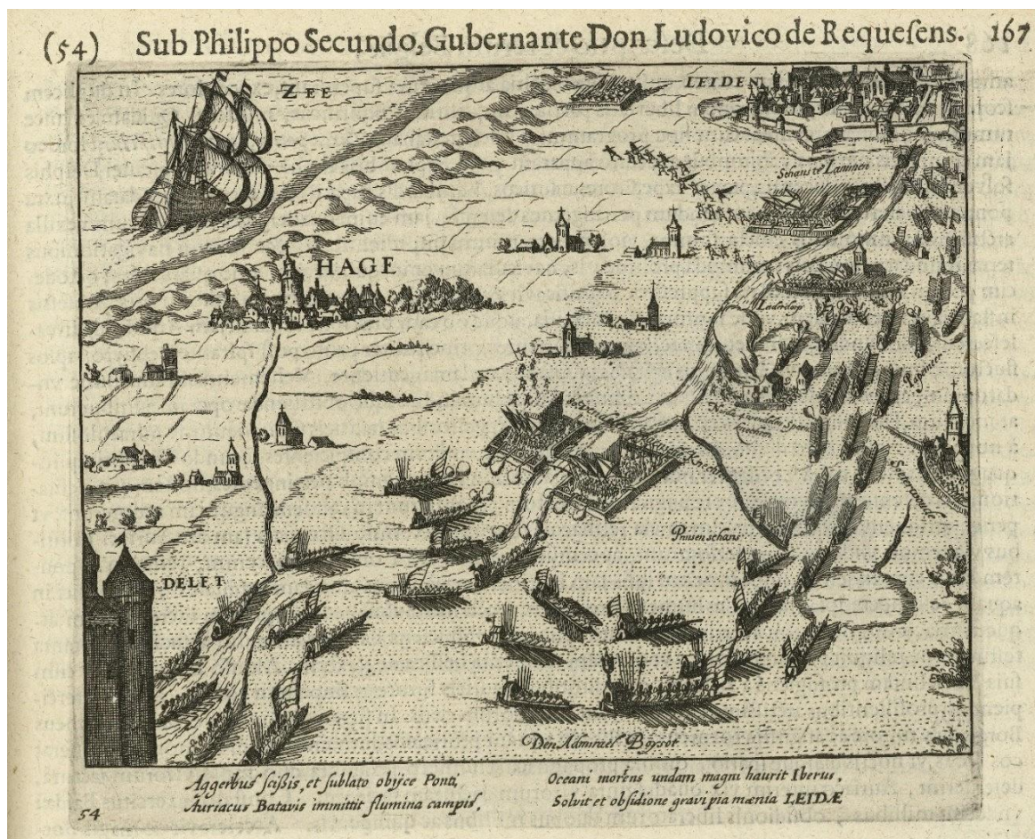
Figura 2 - Simon Frisius, Ontzet van Leiden (La liberazione di Leida), 1574, 1621 – 1622, Rijksmuseum.

settembre, ingrossò le acque dell'Harlemmermeer e permise all'ammiraglio Boisot di avanzare liberando la città e mettendo in fuga il nemico (Fig. 2). 60