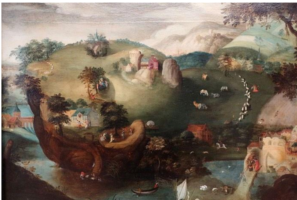
Figura 7 - Maître anonyme des Pays-Bas méridionaux, Paysage anthropomorphe. Portrait de femme , seconde moitié du XVIIe siècle, Musées royaux des Beaux-Arts de Belgique, Bruxelles

potestas ) esercita il proprio diritto in un aggregato collettivo di potenze individuali, le quali lo costituiscono mediante un movimento percorso dalla persistenza degli antagonismi ‘naturali’ e sempre aperto alla possibilità della trasformazione. 26 In conclusione, volendo dare ulteriore spessore al confronto proposto con l’arte rappresentativa nord-europea, il tentativo spinoziano di pervenire a un potere sovrano ( summa potestas ), capace di trarre la propria condizione di esistenza dalla molteplicità (anche conflittuale) di coloro che partecipano al processo aggregativo, può trovare un’analogia con la rappresentazione pittorica di un’opera anonima, della seconda metà del Cinquecento, intitolata Paysage anthropomorphe. Portrait de femme (Fig.7).