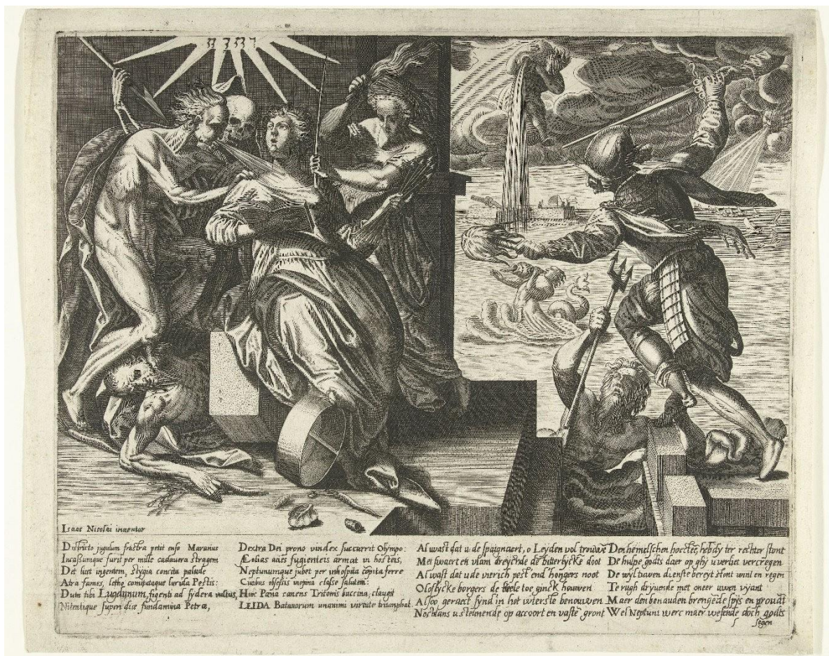
Figura 3 - Allegorie op de nood en het ontzet van Leiden , 1574. Rijksmuseum. Riproduzione autorizzata. http://hdl.handle.net/10934/RM0001.COLLECT.364058

anonima, ribattezzata Allegorie op de nood en het ontzet van Leiden [Allegoria sul pericolo e sulla liberazione di Leida], risalente probabilmente ai mesi seguenti la liberazione della città (Fig. 3). 63