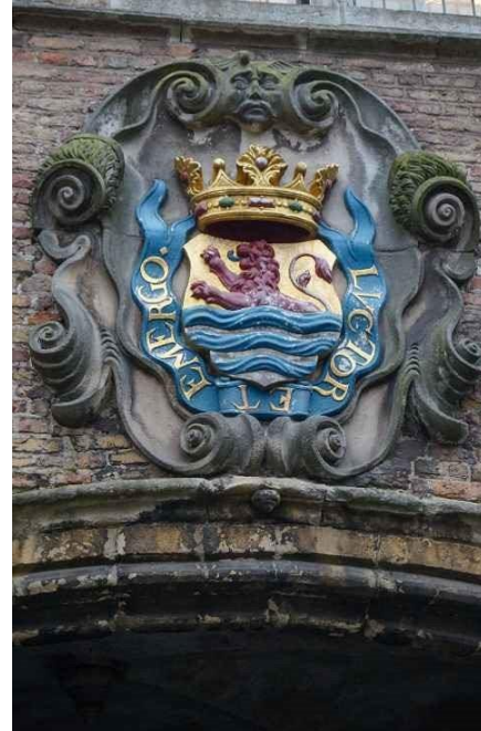
Figura 1- Stemma araldico della Zelanda presso la città di Middelburg

Il territorio della Repubblica delle Province Unite è, quindi, nel medesimo tempo, sia l'espressione (non pacificata) di una pluralità di terre, tra loro autonome, sia il tentativo di creare un ordinamento spaziale condiviso capace di risolvere la plurivocità delle forze in campo. Tale ordinamento è difficilmente inquadrabile nella grande metafora schmittiana, volta a mostrare come la riflessione sulla spazialità politica moderna si articoli essenzialmente sull'opposizione dell'«ordinamento spaziale della terraferma» all'«ordinamento spaziale del mare libero». 44 La terra della Repubblica delle Province Unite è sì quel luogo dove gli aratri posso scavare dei solchi e i solchi tradursi in confini, ma questi – come si è cercato di mostrare – non hanno carattere definitivo, non