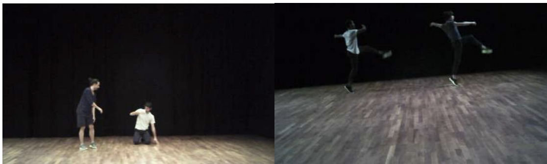
Figure 8 : Photogramme du spectacle Removing extraite de l'enregistrement vidéo effectué par Gaspard : les scènes mémorisées.

S'agissant du spectacle lui-même, Gaspard conserve le souvenir d'une ambiance sombre et silencieuse. La représentation lui a paru inquiétante. Il s'est passé quelque chose d'assez violent pour lui dans la salle : « Ça m'a fait bizarre de voir des corps assez... distants ». Il se souvient vaguement des danseurs qui formaient des couples, puis se séparaient : « Je ne sais pas s'ils se défiaient ou s'ils s'entraidaient ». Il a été surpris par une interaction brisée, les corps qui s'évitaient, des mouvements rompus et la froideur qui s'installait sur le plateau. Il ne sait pas pourquoi les danseurs effectuaient des mouvements entrecoupés, décousus, saccadés et « pas très naturels ». Il n'a pas identifié la raison qui les mettait en mouvement. Il a été surpris que l'histoire entre les danseurs ne se soit pas installée : il a essayé de suivre des yeux certains couples, mais les corps à peine réunis se séparaient aussitôt ; il a tâché de voir les groupes qui se défiaient, mais ceux-ci se dispersaient également. Rien ne lui permettait de projeter une histoire plausible ; les fulgurances dramatiques étaient trop courtes et insignifiantes pour qu'une véritable histoire s'installe : « Je n'avais pas l'impression qu'il y avait une histoire qui se créait. Pour me motiver à regarder la danse, je pensais qu'il allait y avoir une sorte d'histoire qui allait se créer, mais je n'en ai pas trouvé ».