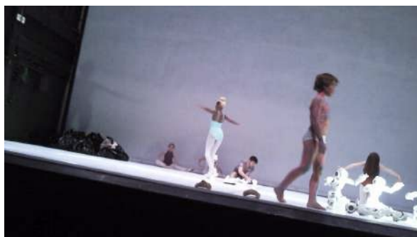
Figure 38 : Photogramme du spectacle School of Moon extraite de l'enregistrement vidéo effectué par Judith : la « toupie », la danseuse qui tourne pendant longtemps.

Judith reconnaît que le spectacle recelait quelques bonnes idées – « une carte avec génie toupie, une carte avec génie sexe, une carte avec génie » – mais elle est très critique et revient régulièrement sur l'impression de discontinuité, même dans les styles de chorégraphie, qu'elle a ressentie : « Hop, on descend, on finit par je ne sais pas quoi, histoire de finir parce qu'il nous manque 5 minutes ». Elle avoue préférer le théâtre, où elle peut retrouver une histoire, un déroulé qui la rassure et auquel elle peut se raccrocher.