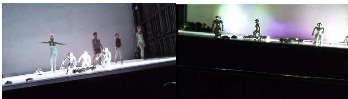
Figure 18 : Photogramme du spectacle School of Moon extraite de l'enregistrement vidéo effectué par Gaspard : à propos des séquences qui lui sont restées en mémoire.

Gaspard ne se souvient pas de la globalité du spectacle, mais seulement de certaines parties. Il se rappelle de la transition entre l'avant-dernière et la dernière partie, des interactions entre les enfants et les robots, de la « dame qui tourne » et des robots. « Et puis la fin était très bizarre... » : « On ne savait pas si c'était la fin ou si c'était encore le spectacle, les enfants sur le plateau faisaient des mouvements de façon chaotique, les spectateurs descendaient et prenaient des photos des robots. » ; « Peut-être une troisième génération qui arrive et qui regarde les robots comme une sorte de spectacle oui, un peu comme dans un zoo. »