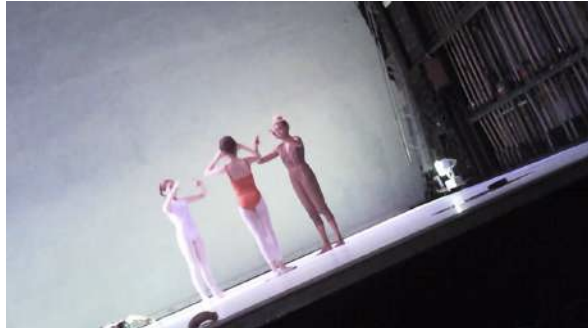
Figure 32 : Photogramme du spectacle School of Moon extraite de l'enregistrement vidéo effectué par Marie : concernant la démarche classique des danseuses.

normalement. » Elle admet cependant n'avoir pas prêté une attention particulière aux costumes.