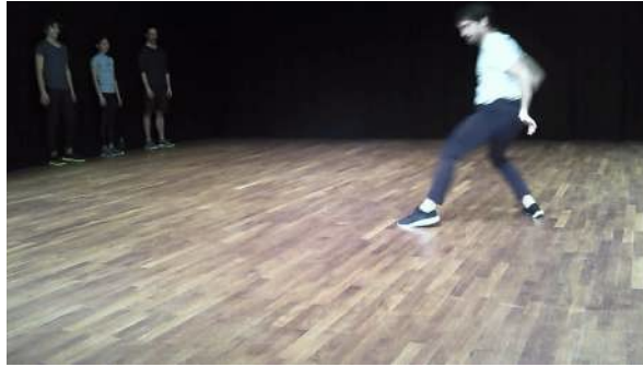
Figure 49 : Photogramme du spectacle Removing extraite de l'enregistrement vidéo effectué par Sophie : à propos des baskets des danseurs.