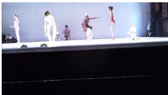
Figure 17 : Photogramme du spectacle School of Moon extraite de l'enregistrement vidéo effectué par Gaspard : au sujet du « transhumanisme ».

Gaspard ne se souvient pas de la globalité du spectacle, mais seulement de certaines parties. Il se rappelle de la transition entre l'avant-dernière et la dernière partie, des interactions entre les enfants et les robots, de la « dame qui tourne » et des robots. « Et puis la fin était très bizarre... » : « On ne savait pas si c'était la fin ou si c'était encore le spectacle, les enfants sur le plateau faisaient des mouvements de façon chaotique, les spectateurs descendaient et prenaient des photos des robots. » ; « Peut-être une troisième génération qui arrive et qui regarde les robots comme une sorte de spectacle oui, un peu comme dans un zoo. »