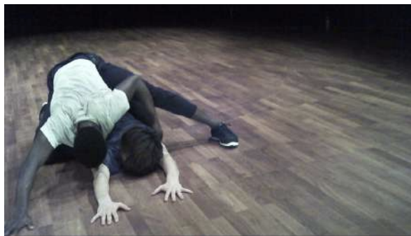
Figure 34 : Photogramme du spectacle Removing extraite de l'enregistrement vidéo effectué par Judith : la signification de la séquence avec le « couple ».

La spectatrice a trouvé que la représentation était du « déjà-vu », avec des « couples qui se battent, puis qui se cherchent, puis qui reviennent » : selon Judith, c'est le sujet principal de toutes les danses de salon. De plus, elle n'a pas perçu de lien entre ces scènes et le reste du spectacle.