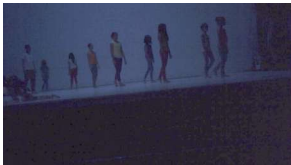
Figure 20 : Photogramme du spectacle School of Moon extraite de l'enregistrement vidéo effectué par Gaspard : les enfants – la « tribu primitive » – plongés dans l'obscurité.

Gaspard se souvient des groupes du début, de la « tribu primitive ». Le début était selon lui assez beau, avec des mouvements non coordonnés et une utilisation impressionnante de l'espace. Le début lui a fait penser à 2001, l'Odyssée de l'espace et il a pu entrevoir quelques références à ce film.