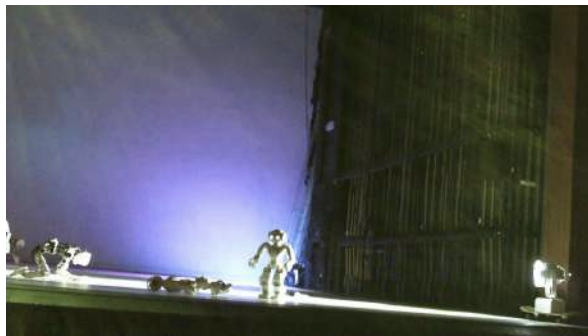
Figure 39 : Photogramme du spectacle School of Moon extraite de l'enregistrement vidéo effectué par Judith : au sujet de la fin du spectacle.

fonctionner, ils se sont mis à tomber à la fin du spectacle : « Est-ce que c'est parce que c'est la fin du spectacle et que les robots ils n'ont plus assez de batterie ? » Elle a inféré que ce fonctionnement résultait d'une volonté de mise en scène du chorégraphe et non de difficultés technologiques : selon elle, l'équipe artistique a probablement récupéré des modèles anciens, ou des prototypes comportant des défauts moteurs.