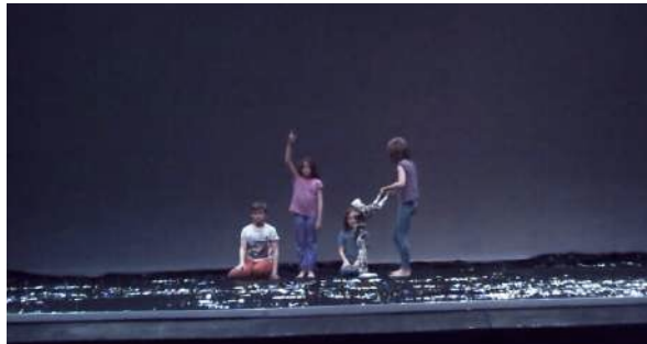
Figure 5 : Photogramme du spectacle School of Moon extraite de l'enregistrement vidéo effectué par Marie : les « tableaux vivants ».

nous cessons les interrogations ouvertes 1 pour procéder à la description de ce que nous voyons. Par exemple, lors de l'entretien avec Marie, à propos du spectacle School of Moon , nous prononçons la phrase suivante : « [Les danseurs] sont immobiles, mais on dirait qu'ils bougent en même temps », ce à quoi Marie répond : « Oui, on dirait des tableaux vivants » 2 , puis elle continue à étayer son point de vue, nous permettant ainsi de poursuivre notre investigation.