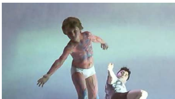
Figure 33 : Photogramme du spectacle School of Moon extraite de l'enregistrement vidéo effectué par Marie : hypothèses sur la signification de la peinture sur le torse du danseur.

Marie avoue également ne pas avoir compris pourquoi un jeune danseur était peint, mais elle formule tout de même une hypothèse : « plus je regardais, je me disais que ça ressemblait à un système veineux, à des muscles. En plus, il y avait les squelettes qui étaient au fond sur la bâche. Je me suis dit que ça représentait peut-être une espèce de chair, quelque chose comme ça. »