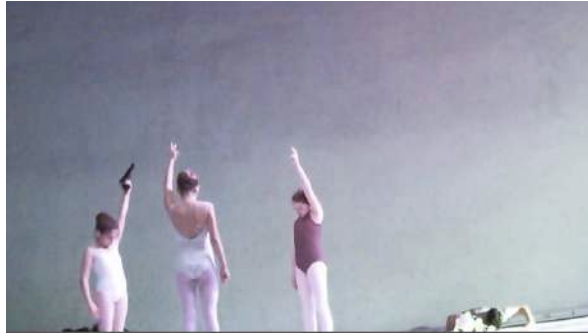
Figure 53 : Photogramme du spectacle School of Moon extraite de l'enregistrement vidéo effectué par Sophie : au sujet de l'arme.

Par ailleurs, Sophie souligne à quel point la démarche de l'artiste, qui peut « paraître brouillon, pas conventionnelle », est au contraire « très constante, très inscrite ». Son travail avec les enfants est très particulier et s'inscrit dans le temps : « Il mobilise beaucoup de moyens, beaucoup de temps avec les enfants. C'est une logistique de dingue pour trouver des enfants comme matière mais c'est du délire. [...] Il y a des mois de travail avec les gamins pour qu'ils s'habituent à ce que Éric travaille, pour que quand ils sont sur scène, parce que ça tient tellement à peu de choses sur la présence des enfants, sur des regards, sur des attitudes, sur la lenteur, ce qui est à l'opposé de ce qu'ils font normalement en dansant, c'est une matière qui est dure. » Cet engagement de l'artiste, « hyper exigeant » avec les enfants, est tout de même ambiguë pour Sophie : elle regrette qu'« il ne les traite pas comme des enfants » – « C'est une matière pour lui et il ne les voit pas » –, mais elle reconnaît que la production qui en résulte « est à part de ce qu'on peut voir » : « Il s'intéresse plus à donner une espèce de grouillement d'enfants, une tribu, une atmosphère, à créer un truc, plutôt que s'attacher à l'enfance même. »