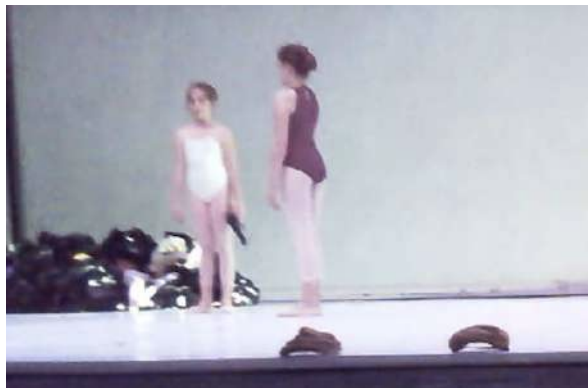
Figure 21 : Photogramme du spectacle School of Moon extraite de l'enregistrement vidéo effectué par Gaspard : au sujet de la présence du pistolet.

Gaspard estime que le chorégraphe expose sur le plateau un aspect un peu tragique : le son, les lumières, la fin : « tout le monde arrive vers la scène à regarder les robots comme des bêtes de foire. » Gaspard évoque également les armes tenues par les enfants : « C'était peut-être par la violence que cela apporte. » Selon lui, ces armes n'agissaient pas, elles jouaient un rôle symbolique plutôt que visuel. « Le chorégraphe pose plus de questions qu'il n'affirme quelque chose. »