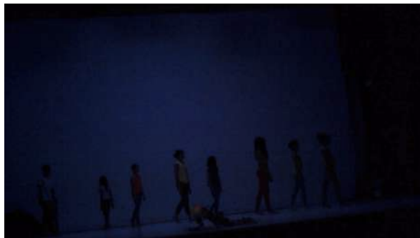
Figure 54 : Photogramme du spectacle School of Moon extraite de l'enregistrement vidéo effectué par Sophie : « la masse ».

Sophie n'a pas spécialement porté attention à la représentation de la diversité chez les danseurs : « J'ai vu ça comme une masse, je n'ai pas cherché à me dire c'est l'humanité qui est représentée dans la peur. » Elle sait que l'artiste « ne cherche pas forcément des corps conventionnels, formatés » : « cette mixité, cette ouverture au monde, il la représente naturellement, mais je ne pense pas que ce soit de la revendication. »