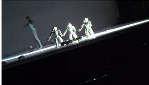
Figure 25 : Photogramme du spectacle School of Moon extraite de l'enregistrement vidéo effectué par Gaspard : à propos de la fin du spectacle.

inclus dans le spectacle : « comme si on faisait partie du spectacle ». Cette fin confuse dissolvait, selon lui, la frontière entre la vie quotidienne et le spectacle.