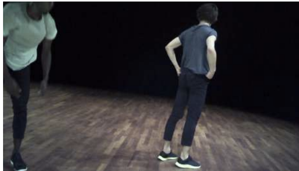
Figure 35 : Photogramme du spectacle Removing extraite de l'enregistrement vidéo effectué par Judith : au sujet des costumes du spectacle.

dérangeant le fait que les danseurs ne soient pas habillés de façon identique : « La fille, là, avec son jogging tout coloré... Oui, on aurait plutôt dit une tenue d'entraînement. » Si elle avait dû décider des costumes pour ce spectacle, elle aurait choisi des chaussures sans logo apparent et plus confortables, pour qu'elles ne fassent pas d'ampoules.