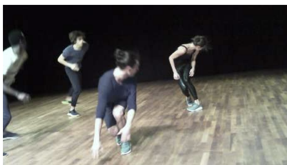
Figure 9 : Photogramme du spectacle Removing extraite de l'enregistrement vidéo effectué par Gaspard : à propos de la posture « démonstrative » des artistes.

Quand j'ai lancé la vidéo, Gaspard est aussitôt revenu sur l'idée qu'aucune histoire dramatique ne s'installait dans l'œuvre. Pour lui, les danseurs représentaient, en quelque sorte, des personnages et « symbolisaient quelque chose », tandis qu'il n'y avait pas d'histoire : « Ils n'avaient pas l'air de montrer un personnage, mais... ah, j'ai du mal à formuler... Ils avaient l'air, tous, d'avoir un peu leur rôle et, d'un autre côté, ils étaient un peu là pour nous montrer les mouvements et pas forcément pour nous montrer une personnalité ou autre chose ».