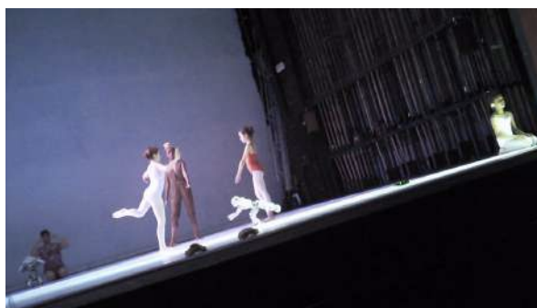
Figure 52 : Photogramme du spectacle School of Moon extraite de l'enregistrement vidéo effectué par Sophie : la lumière diffuse...

En avril 2016, Sophie a assisté à une représentation au Théâtre des Mazades mais elle a l'impression de ne pas en avoir gardé beaucoup de souvenirs : « j'ai des visions des tableaux, des moments, des lumières, des impressions, des grands formats, mais je n'ai aucun souvenir, je ne peux pas te dire de quoi ça parlait précisément, qu'est-ce que j'en ai retenu en fait si ce n'est un truc un peu bizarre sur l'enfance, le robot, la gestuelle. » Elle se souvient avoir été marquée par la musique, mais serait incapable de la décrire : « c'est un spectacle diffus, c'est une atmosphère. [...] pour moi ce n'est pas un spectacle c'est plus une installation. [...] je pense qu'on pourrait le faire ailleurs. Ça pourrait être dans un centre d'art, un espace, ce serait beau, ça irait mieux dans un espace, un truc désaffecté, une ambiance très jolie. »