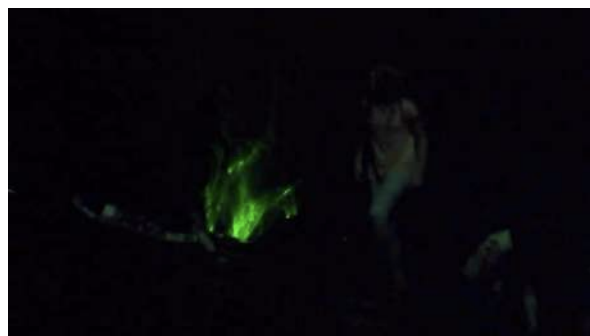
Figure 31 : Photogramme du spectacle School of Moon extraite de l'enregistrement vidéo effectué par Marie : à propos de la lumière verte.

Au visionnage de la vidéo, Marie relève les lumières et « la musique extrêmement forte » qui lui ont procuré un sentiment d'oppression, de « film d'horreur » qu'elle n'a pas apprécié. La lumière verte lui a fait penser à Matrix , « la matrice, cette espèce de monde virtuel ».