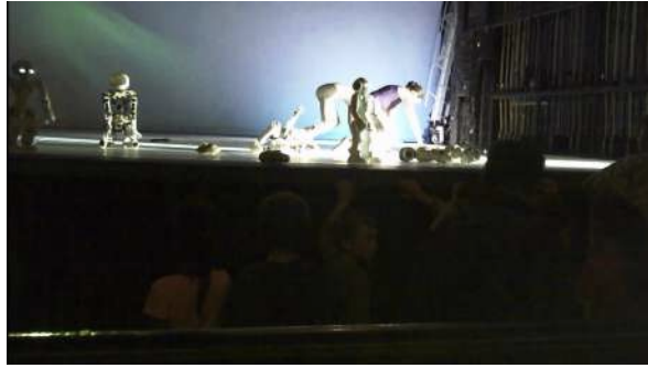
Figure 43 : Photogramme du spectacle School of Moon extraite de l'enregistrement vidéo effectué par Henri : à propos de la présence des robots.

Henri estime de plus qu'il ne s'agit pas d'un spectacle de danse – le seul moment de danse étant la toupie – et que cela aurait pu être une représentation théâtrale puisque cela montrait « juste des gens qui bougent sur scène » : « Le spectacle aurait pu être fait sans le côté de la danse et ça aurait été la même chose. ». Il évoque d'autres moments dépourvus d'intérêt : le monsieur qui « faisait des choses », les enfants qui marchaient avec des attitudes « très danse classique ».