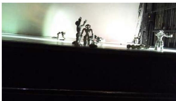
Figure 47 : Photogramme du spectacle School of Moon extraite de l'enregistrement vidéo effectué par Henri : la fin est « au niveau du lambeau ».

Enfin, Henri s'attarde sur la fin du spectacle, qui devrait être selon lui « On allume la lumière, on arrête la musique... On ferme les rideaux, on dit “Merci d’être venu”, tu vois ? » Dans School of Moon , la représentation « finit en eau de boudin », « au niveau du lambeau » : la fin, telle qu'elle est présentée, est « la fin de l'humanité ». Henri estime que le chorégraphe incitait les spectateurs aux applaudissements alors que ma perception serait plutôt que les parents, connaissant le spectacle, ont initié les applaudissements – non pas par fascination pour les nouvelles technologies, mais en signe de reconnaissance pour le travail fourni par le chorégraphe.