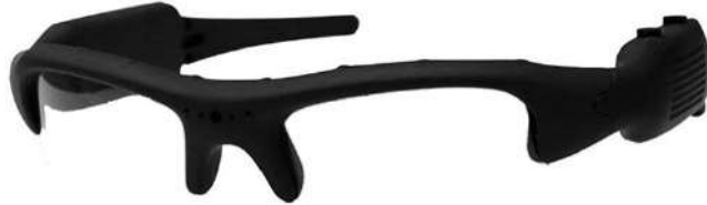
Figure 3 : Présentation des lunettes-caméra.

la fin des spectacles, lorsque nous leur demandons de les ôter. Ces appareils ne comportent pas de verres et sont constitués d'une armature légère. L'objectif vidéo dont ils disposent est fixé au niveau de la racine du nez et ne gêne pas la vue.