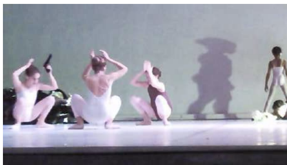
Figure 46 : Photogramme du spectacle School of Moon extraite de l'enregistrement vidéo effectué par Henri : la jeune femme et le pistolet.

Enfin, Henri s'attarde sur la fin du spectacle, qui devrait être selon lui « On allume la lumière, on arrête la musique... On ferme les rideaux, on dit “Merci d’être venu”, tu vois ? » Dans School of Moon , la représentation « finit en eau de boudin », « au niveau du lambeau » : la fin, telle qu'elle est présentée, est « la fin de l'humanité ». Henri estime que le chorégraphe incitait les spectateurs aux applaudissements alors que ma perception serait plutôt que les parents, connaissant le spectacle, ont initié les applaudissements – non pas par fascination pour les nouvelles technologies, mais en signe de reconnaissance pour le travail fourni par le chorégraphe.