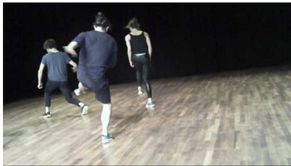
Figure 12 : Photogramme du spectacle Removing extraite de l'enregistrement vidéo effectué par Gaspard : au sujet de l'appropriation des mouvements par les danseurs.

l'impression que c'est... c'est millimétré. À travers... les... ça a l'air assez maîtrisé [...]. Ils font plein de gestes différents, mais super maîtrisés ». À travers cette organisation rigoureuse des mouvements, transparaissent des gestes que Gaspard a qualifiés de « parasites » : si la trame chorégraphique représente une organisation stricte de consignes corporelles, son interprétation personnelle revient à chaque danseur. S'il convient, selon la partition dansée, de lancer un bras en avant, chaque interprète est libre d'effectuer le mouvement à sa manière. Selon Gaspard, « ça rajoute un peu quelque chose de moins linéaire ». La « linéarité » de la danse, d'après lui, concerne l'artificialité des mouvements chorégraphiques mis en scène.