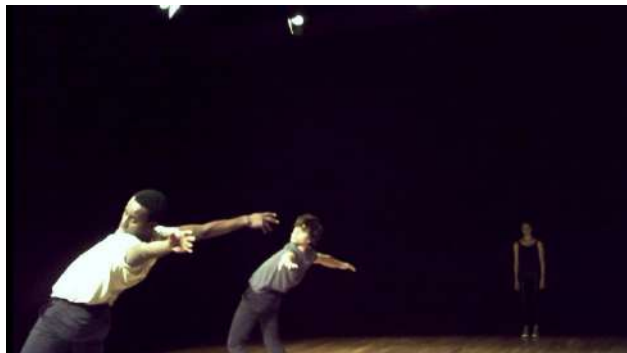
Figure 41 : Photogramme du spectacle Removing extraite de l'enregistrement vidéo effectué par Henri : « Là, il était complètement en équilibre... »

Ensuite, Henri poursuit ses réflexions sur les mouvements des danseurs : « On ne peut pas apprécier leurs mouvements musculaires, parce qu'à la fois, ça va trop vite pour... [...] Là, il était complètement en équilibre, je suppose qu'il y a une tension dans tout le corps qui serait palpable au niveau des jambes ou tout ça, mais en fait, la seule chose qu'on voit d'eux, c'est leurs bras, mais qui ne sont finalement pas les muscles les plus sollicités. Enfin, dans tout ce qu'ils font. »