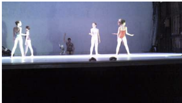
Figure 45 : Photogramme du spectacle School of Moon extraite de l'enregistrement vidéo effectué par Henri : répartition des rôles entre les filles et les garçons.

Henri a entrevu une posture maternelle dans les actes des danseuses avec les robots et un rôle de « sauveur » pour les garçons : « Pourquoi le garçon peut être torse nu, mais pas la fille ? S'il pouvait mettre les garçons torse nu et les filles en tutu, il l'aurait fait. Il a sauvegardé beaucoup de clichés sur l'être humain... sur notre société à nous. » Selon Henri, le garçon peintre avait ainsi un rôle plus actif dans la narration alors que la fille est dans le « rangement du matériel ».