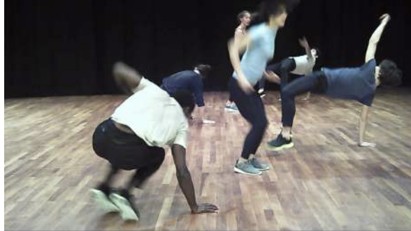
Figure 6 : Photogramme du spectacle Removing extraite de l'enregistrement vidéo effectué par Gaspard : souvenirs imprécis du spectacle.

chorégraphiques mis en scène : « [À ce moment du spectacle] j'ai dû me dire : "C'est bizarre qu'il y ait des gens qui fassent ça quand même..." » 1 .