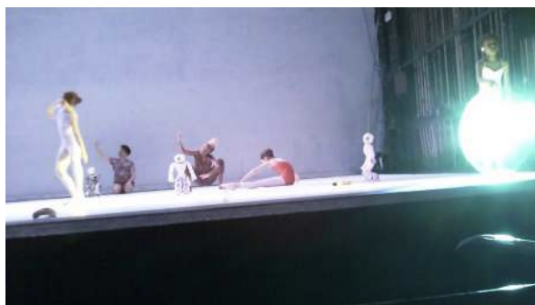
Figure 19 : Photogramme du spectacle School of Moon extraite de l'enregistrement vidéo effectué par Gaspard : concernant les effets lumineux mis en scène.

Le jeune homme s'est également souvenu qu'Henri n'avait pas apprécié le fait que des enfants soient sur le plateau. Pour sa part, Gaspard n'a pas trouvé cette présence gênante, mais plutôt touchante car les enfants dégagent de la naïveté : « Si c'étaient des adultes, ça n'aurait pas été aussi critiqué, ça n'aurait pas eu le même impact. » Il a également trouvé, comme la plupart des spectateurs du panel, que les enfants avaient très bien géré leur rôle. Gaspard se pense incapable d'apprendre les mouvements, alors que les enfants du spectacle étaient très « sobres et savaient ce qu'ils avaient à faire ». Ils paraissaient bien dirigés et organisés. « Par contre, j'ai l'impression que certains enfants avaient des oreillettes, quelqu'un leur soufflait ce qu'il y avait à faire. »