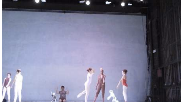
Figure 29 : Photogramme du spectacle School of Moon extraite de l’enregistrement vidéo effectué par Marie : remarque concernant l’ambiance générale du spectacle.

“mapping”, mais ça montre vraiment la place de la technologie maintenant, dans ce que l’on fait maintenant comparé à avant. »