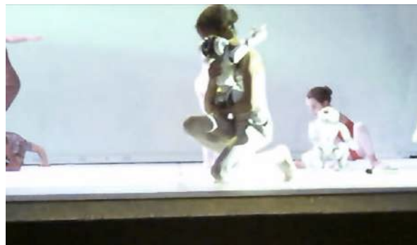
Figure 24 : Photogramme du spectacle School of Moon extraite de l'enregistrement vidéo effectué par Gaspard : remarque concernant la prise en main des robots.

À propos du geste maternel des filles qui portaient le robot comme un bébé, Gaspard n'a pas eu l'impression que c'était le cas pendant tout le reste du spectacle ; « Il se peut que le chorégraphe se pose des questions sur l'image collective du genre. »