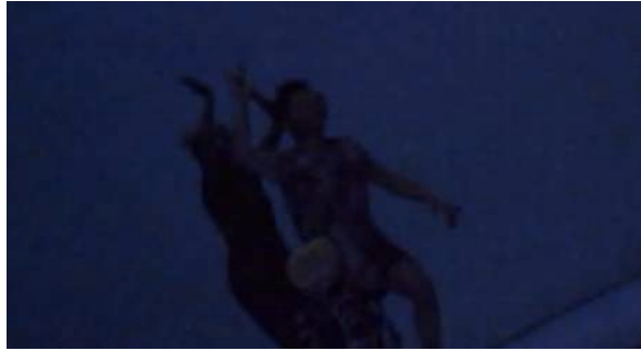
Figure 30 : Photogramme du spectacle School of Moon extraite de l'enregistrement vidéo effectué par Marie : au sujet des masques de cheveux sur les visages des danseurs.

Sur la question de la « présence robotique dans la vie des enfants », elle relève que « les enfants évoluent dans une société qui est déjà hyper avancée technologiquement » et elle se questionne sur leur rapport à la technologie : « Ça s'accélère et maintenant ils préfèrent jouer connecter qu'être dehors. Il n'y a plus de wifi c'est la fin du monde. »