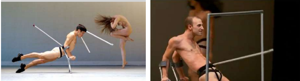
Figure 2 : Photogrammes du spectacle bODY_rEMIX/les_vARIATIONS_gOLDBERG de Marie Chouinard.

« Lorsque je pense à la ‘danse contemporaine’ j’ai tout de suite en tête l’image d’un mec qui a une béquille à la place du sexe et qui frappe contre une barre en métal » 1 .