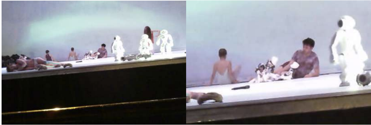
Figure 23 : Photogramme du spectacle School of Moon extraite de l'enregistrement vidéo effectué par Gaspard : à propos de la coprésence des humains et des robots, la scène de copulation entre les robots.

Gaspard a également noté, en les voyant tomber, que les robots étaient faillibles. Ils « ne sont pas à sent ou sent fiables ». Avant le spectacle, le chorégraphe avait prévenu que les robots étaient sensibles – voire plus sensibles que les êtres humains.