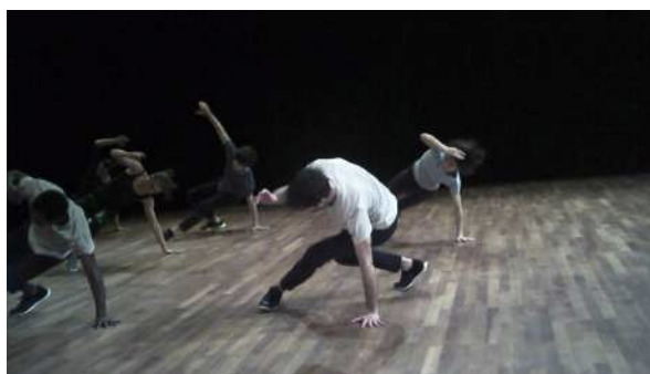
Figure 10 : Photogramme du spectacle Removing extraite de l'enregistrement vidéo effectué par Gaspard : « entre... complicité et défi ».

Les danseurs réalisaient des gestes mais pas tout à fait de manière identique ni de façon synchrone. Parfois, ils étaient ensemble, mais Gaspard ne savait pas s'ils s'imitaient ou s'il y avait une sorte de défi en jeu : « J'avais l'impression que c'était entre... complicité et défi. On ne sait pas s'ils font exprès d'être ensemble ou s'ils se défient en montrant qu'eux aussi peuvent faire la même chose ».