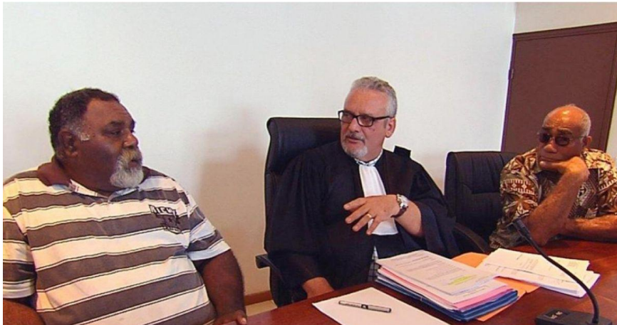
Image 3 : Magistrat entouré de deux assesseurs coutumiers lors d'une audience coutumière à la section détachée de Koné, 2013

coutumier et les litiges fonciers coutumiers où le tribunal est assisté d'assesseurs coutumiers) et en matière de police; en formation collégiale avec l'assistance d'assesseurs non professionnels 1 en matière correctionnelle pour les infractions les plus graves 2 .