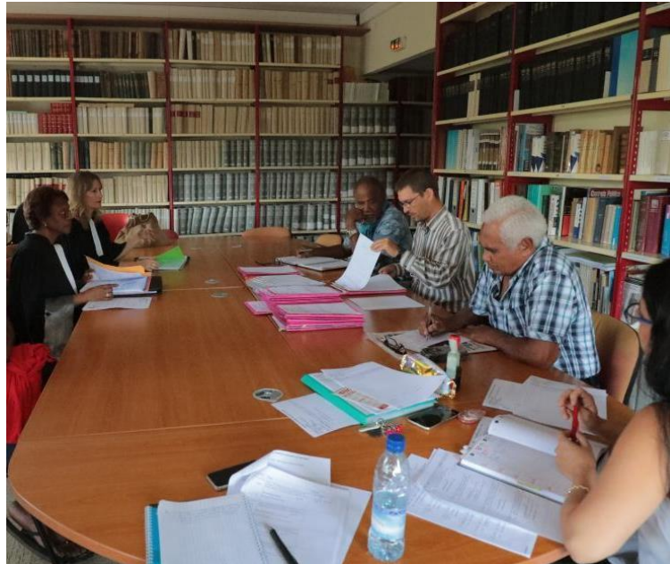
Image 2 : Magistrat, entouré d'assesseurs coutumiers et de la greffière G1, lors d'une audience coutumière au TPI de Nouméa, 2018

juridiction à juge unique qui en matière civile avait une compétence limitée aux petits litiges. La juridiction de proximité a formellement été supprimée en juillet 2017 1 . Néanmoins la loi de programmation 2018/2022 et de réforme pour la justice, instaure un tribunal de proximité, qui est l'émanation du tribunal judiciaire le plus proche. Ce sont des tribunaux qui statuent sur les petites affaires (notamment celles pour lesquelles la demande porte sur des sommes inférieures à 10 000 euros). Ils peuvent à l'occasion se voir attribuer des compétences supplémentaires en fonction des besoins locaux, surtout en ce qui concerne les affaires familiales par exemple.