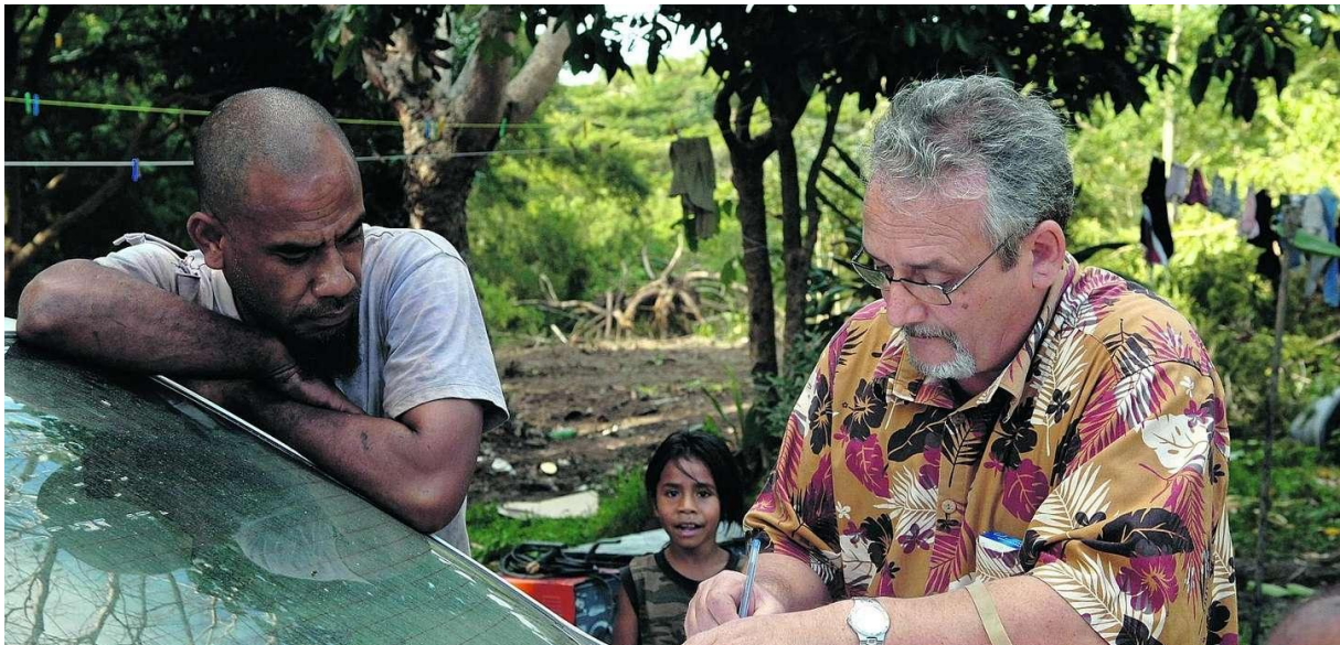
Image 4 : Magistrat lors d'une audience foraine en Province Nord, 2009

De surcroît, d'après les informations que j'ai pu récolter sur le terrain et confirmer par des sources secondaires, seulement deux magistrats siègent à la section détachée de Koné, et un seul pour la section détachée de Lifou 1 . D'après les recherches que j'ai pu mener sur le sujet, les enjeux des audiences foraines n'ont cessé de préoccuper les sections détachées. Il semblerait que le rythme de tenue des audiences foraines ait fait un véritable bond si l'on en croit les données d'entretiens et la presse calédonienne. Si elles avaient lieu en moyenne tous les deux à trois mois pour chaque antenne au début des années 2000 2 , actuellement, la section de Koné projette d'en tenir une par mois, aux différentes antennes de la province Nord 3 .