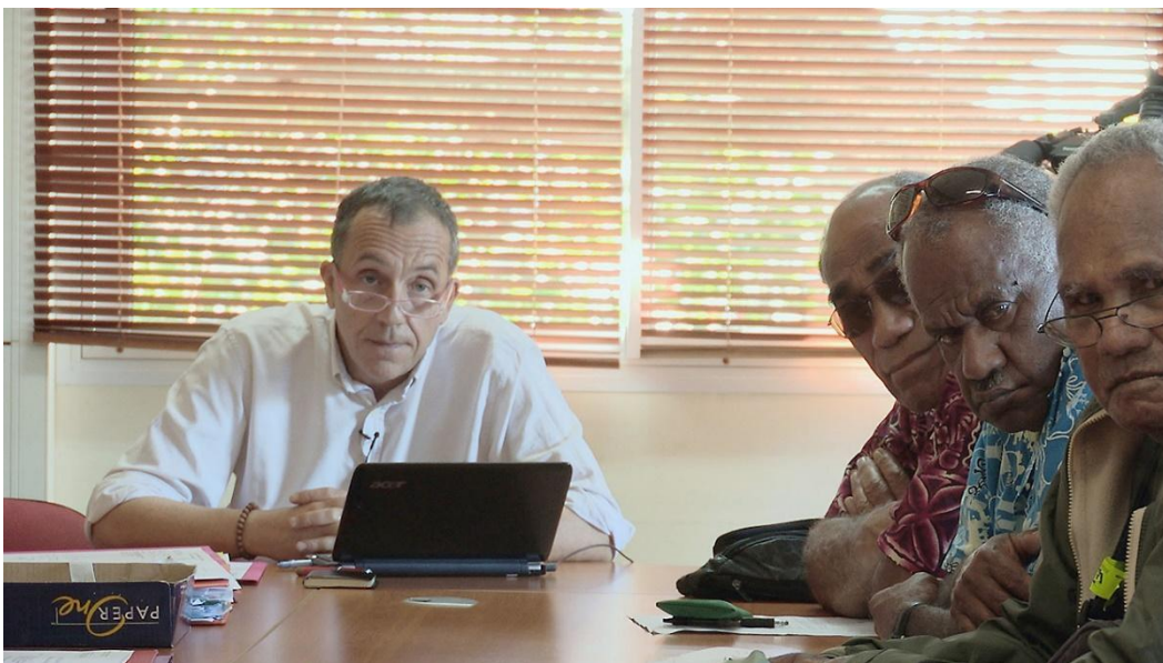
Image 1 : Magistrat entouré d'assesseurs coutumiers au TPI de Nouméa, 2012 (c) Éric Beauducel, Une justice entre deux mondes (2013)

Le caractère multisite de l'enquête s'est manifesté dans la poursuite d'entretiens avec des acteurs des quatre coins du territoire, mais il permet également d'insister sur les lieux où exerce la juridiction coutumière, puisqu'il ne s'agit pas d'un tribunal classique la plupart du temps. Au tribunal de première instance de Nouméa par exemple, qui traite le plus grand nombre d'affaires coutumières, les audiences coutumières se tiennent dans la salle de bibliothèque du TPI. La juridiction coutumière n'a donc pas de salle réservée et elle n'opère pas dans les salles d'audience habituelles, ce qui peut laisser penser qu'elle jouit d'une faible considération, ou pour le moins, que sa place est en marge des espaces habituels des tribunaux.