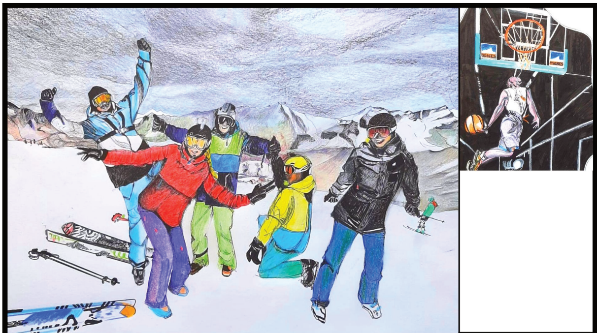
Dessins librement inspirés d'une capture d'écran du site Internet de Tignes juxtaposant la photographie principale de ce groupe de skieurs/skieuses et la photographie, de taille plus réduite et sur la bande latérale, de ce basketteur. Dessins : C. Sallénave.

Comme l'écrit É. Macé, malgré ici une valorisation des corps noirs, il s'agit en réalité d'une forme d'essentialisme, « un essentialisme à l'envers » (2013, p. 194). De même P. Ndiaye explique que le sport « exalte des qualités qui sont historiquement attribuées aux groupes racialisés » (2008, p. 271). Les prises de vue des basketteurs noirs aux muscles étirés, bien dessinés, valorisés par leur saut, se retrouvent sur plusieurs images de sites Internet des stations.