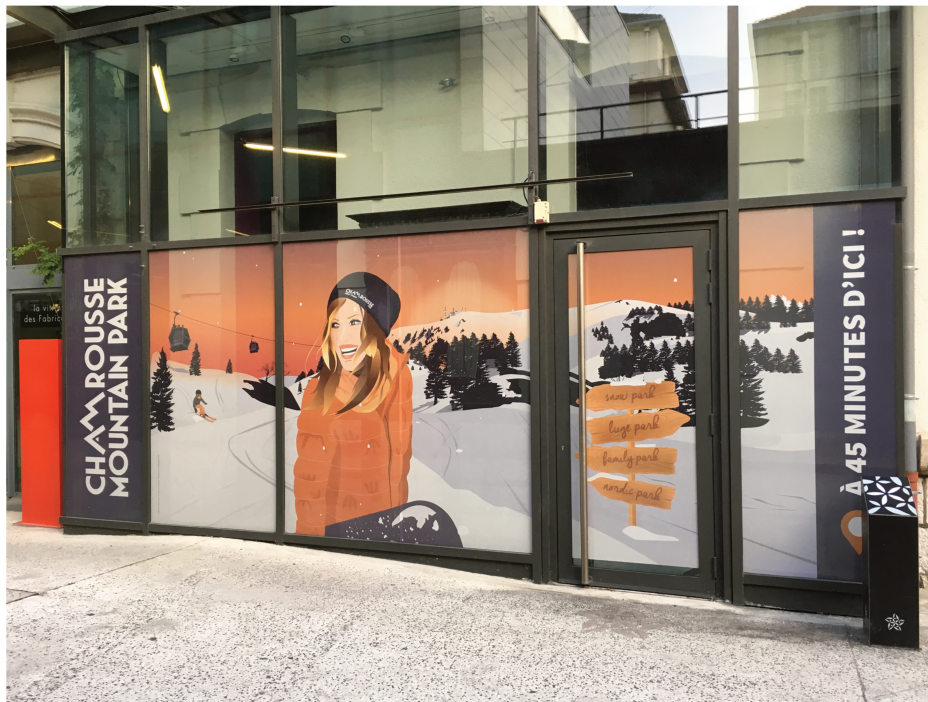
Photographie que j'ai prise à la Caserne de Bonne, espace commercial du centre-ville de Grenoble (Juin 2020, @L. Sallenave)

J'ai construit ce chapitre à partir des propos des enquêté·e·s, sur leurs perceptions de la montagne (leurs places, les distances à cet espace ressenties et éprouvées), mis en regard des récits médiatiques dominants véhiculés sur la montagne récréative.