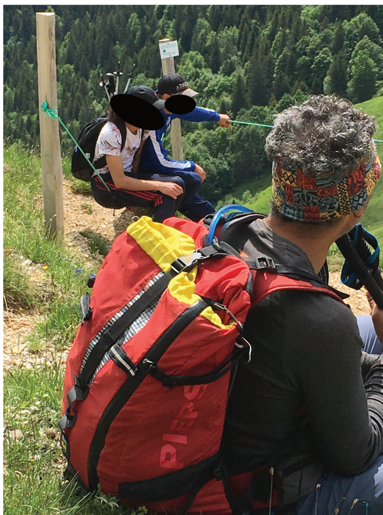
Photo que j'ai prise lors de notre randonnée dans le massif de la Chartreuse.

conduire à conclure à l'échec de ce pan là du programme. Or, les attitudes qui détournent la norme, ou qui sont transgressives, accompagnent quasi systématiquement les pratiques récréatives. Par exemple, pour se faire une place en station, les surfeurs détournent ou contournent les règles, instituées par les skieurs, pour créer leurs propres marquages, modeler leur territoire singulier, personnaliser leur espace de pratique (Reynier, Chantelat, 2005, p. 59). Dans l'étude de V. Reynier et P. Chantelat, les surfeurs analysés forment un groupe de pratiquants réguliers, ce que ne sont pas les jeunes dans les espaces de montagne hors-station. Néanmoins, on peut trouver des similitudes dans cette manière de vivre le paysage lors des sorties. Les jeunes, bien que peu habitués aux activités proposées, modèlent aussi l'espace, à leur manière et avec leurs codes, le temps de ces quelques heures passées en montagne. Ils peuvent marquer leur positionnement, leur place, par des gestes non ou peu orthodoxes. Certains gestes ou comportements des jeunes ne s'inscrivent pas complètement dans le cadre, ni dans la visée, que les acteurs/actrices du programme fixent notamment en matière écologique ou de connexion avec la nature.