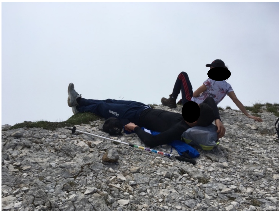
Photo que j'ai prise au sommet de la Dent de Crolles.

Pour se sentir bien dans le paysage, certains des jeunes maintiennent leurs habitudes en fumant ou en roulant des joints, ce qui, là encore, ne les concernent pas eux seuls. Ainsi, une adhérente de la FSGT me racontait l'ambiance de ses sorties en montagne autour de moments contemplatifs et de « jeux de cartes », d'une « flasque de whisky », de récits de « conneries ». La convivialité préside dans leurs sorties entre ami·e·s, loin de la posture archétypale de la stricte contemplation. Le plaisir passe aussi par d'autres canaux.