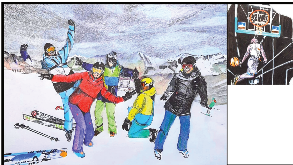
Dessins librement inspirés d'une capture d'écran du site Internet de Tignes juxtaposant la photographie principale de ce groupe de skieurs/skieuses et la photographie, de taille plus réduite et sur la bande latérale, de ce basketteur. Dessins : C. Sallenave.

Comme l'écrit É. Macé, malgré ici une valorisation des corps noirs, il s'agit en réalité d'une forme d'essentialisme, « un essentialisme à l'envers » (2013, p. 194). De même P. Ndiaye explique que le sport « exalte des qualités qui sont historiquement attribuées aux groupes racialisés » (2008, p. 271). Les prises de vue des basketteurs noirs aux muscles étirés, bien dessinés, valorisés par leur saut, se retrouvent sur plusieurs images de sites Internet des stations.