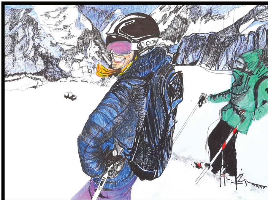
Dessin librement inspiré d'une capture d'écran du site Internet de Saint-Martin de Belleville (Domaine des Trois Vallées), Rubrique « Neige et glisse », Sous-rubrique : « Forfaits de ski », 14 janvier 2021.