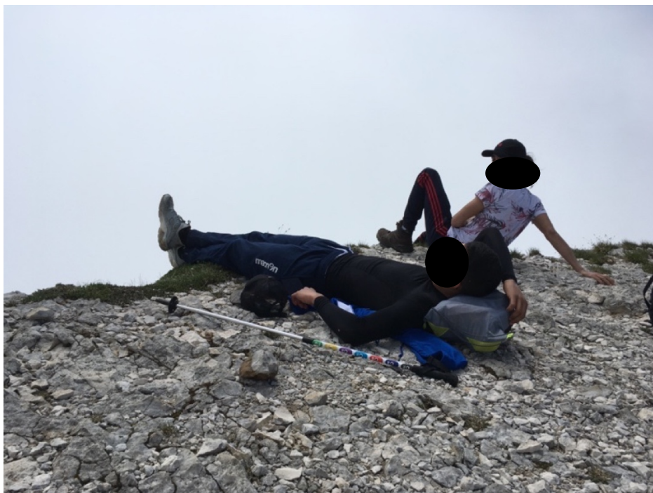
Photo que j'ai prise au sommet de la Dent de Crolles.

Pour se sentir bien dans le paysage, certains des jeunes maintiennent leurs habitudes en fumant ou en roulant des joints, ce qui, là encore, ne les concernent pas eux seuls. Ainsi, une adhérente de la FSGT me racontait l'ambiance de ses sorties en montagne autour de moments contemplatifs et de « jeux de cartes », d'une « flasque de whisky », de récits de « conneries ». La convivialité préside dans leurs sorties entre ami·e·s, loin de la posture archétypale de la stricte contemplation. Le plaisir passe aussi par d'autres canaux.