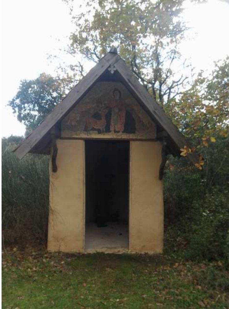
Fig. 3 - L'une des chapelles qu'on rencontre près du sentier.