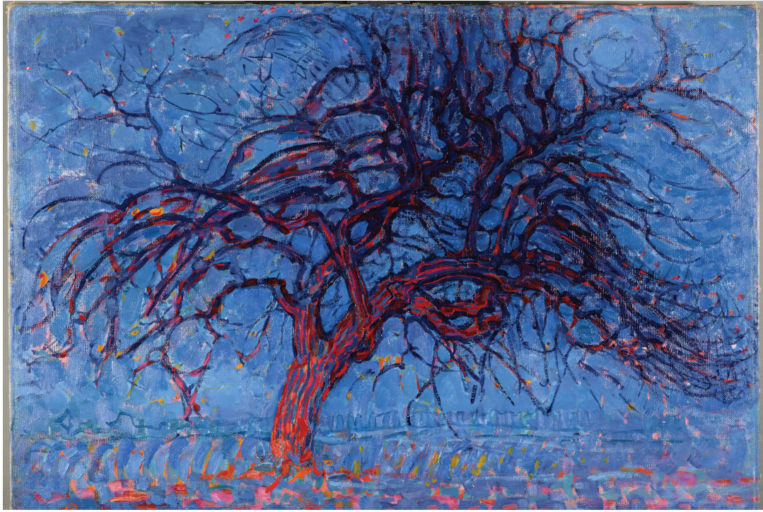
Fig. 9 - The Red Tree - Piet Mondrian - 1910