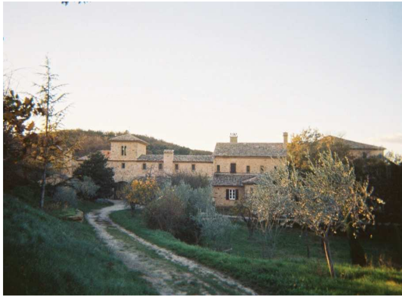
Fig. 1 - Monastère de Solan. Vue depuis le sentier interne au monastère.