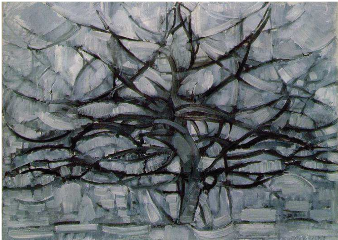
Fig. 10 - The Gray Tree - Piet Mondrian - 1911