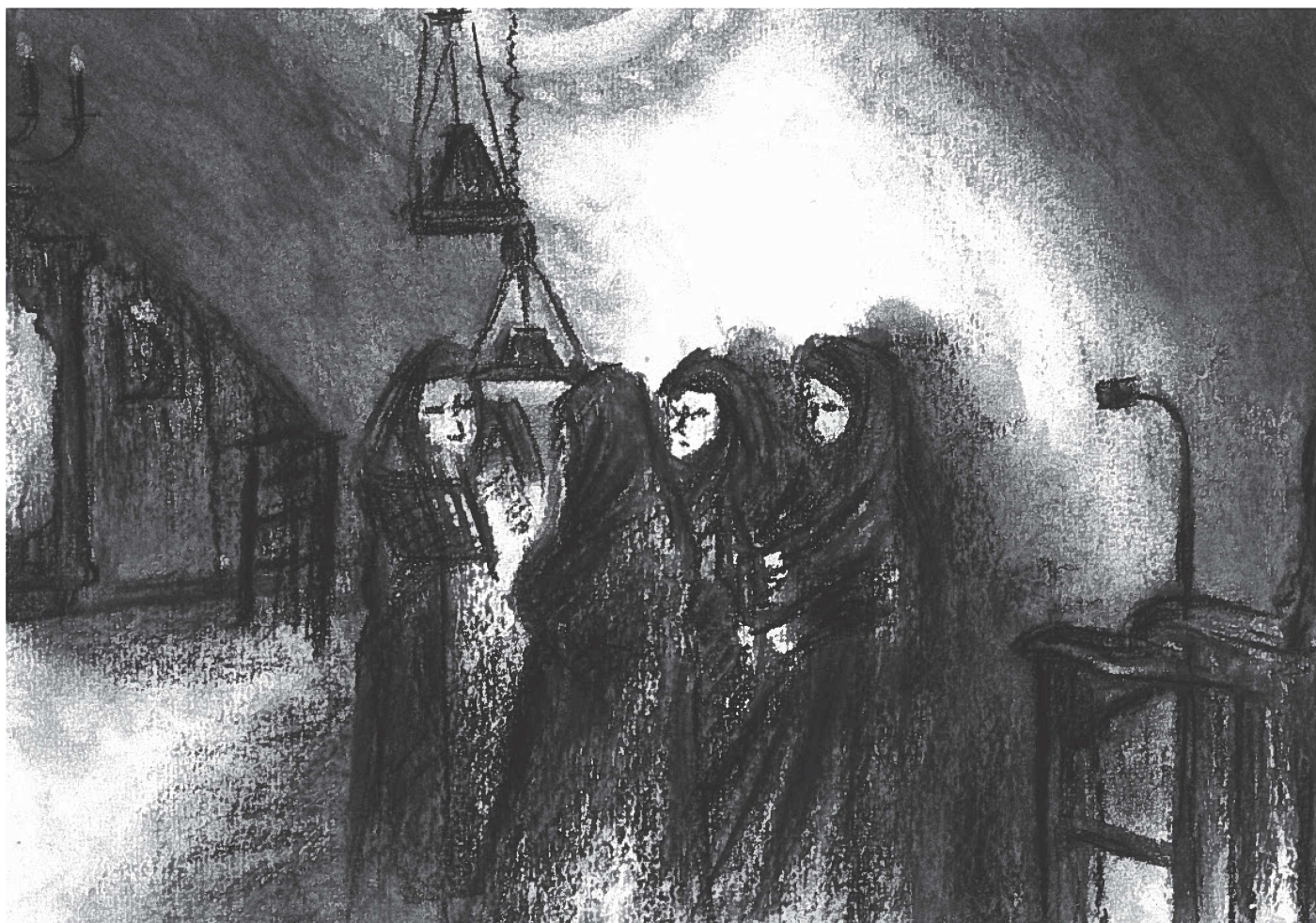
Fig. 5 - Les quatre religieuses qui composent habituellement le chœur, disposées en semi-cercle autour du pupitre sur lequel est posé le livre liturgique. © Lynda Melayah, 2021, dessin au fusain réalisé à partir d'une photo prise en 2012 par Irene Sgambaro.