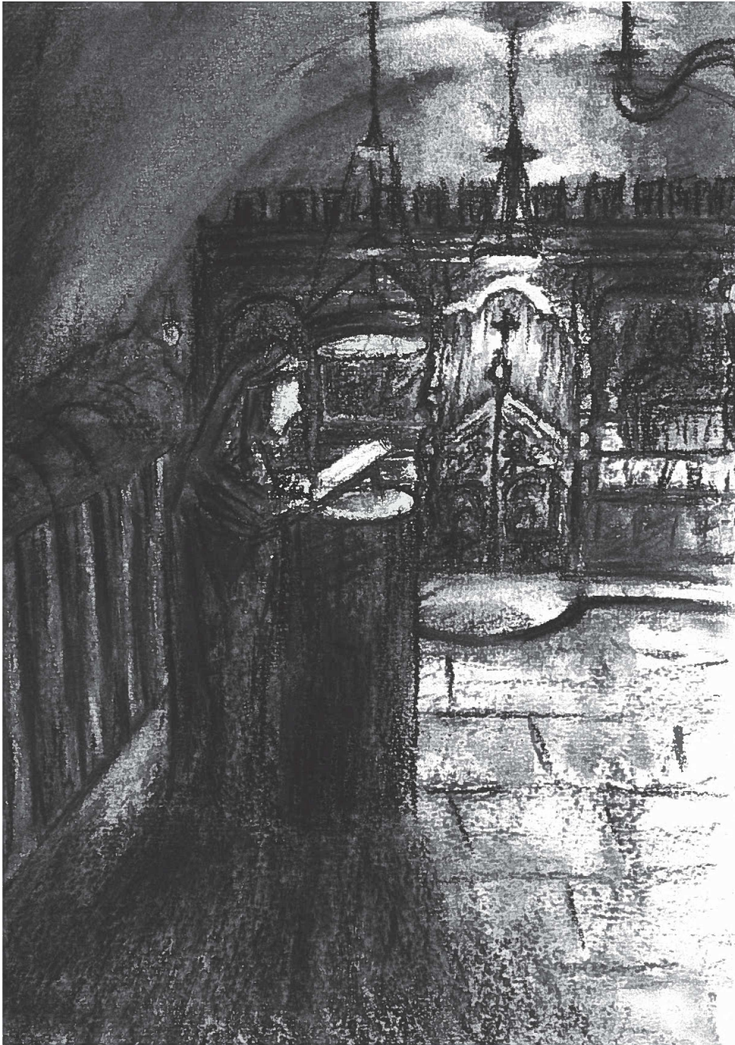
Fig. 6 - Moniale en train de lire dans l'ancienne chapelle (actuellement non utilisée). © Lynda Melayah, 2021, dessin au fusain réalisé à partir d'une photo prise en 2012 par Irene Sgambaro.