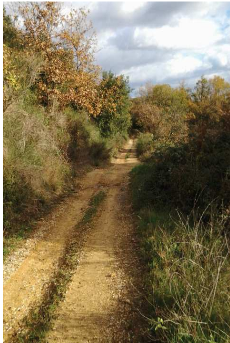
Fig. 2 - Le sentier qui permet d'accéder à la forêt.