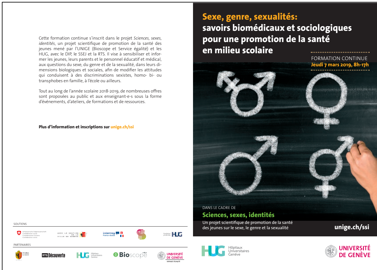
Document 17 Flyers de présentation de la formation continue