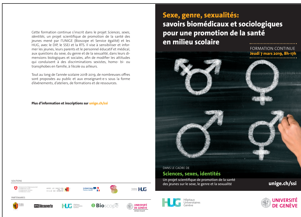
Document 17 Flyers de présentation de la formation continue