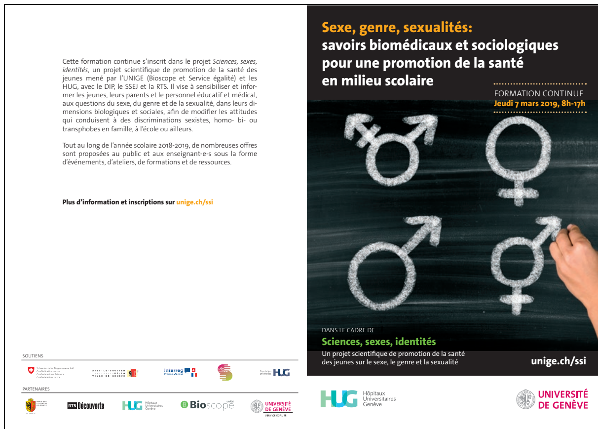
Document 17 Flyers de présentation de la formation continue