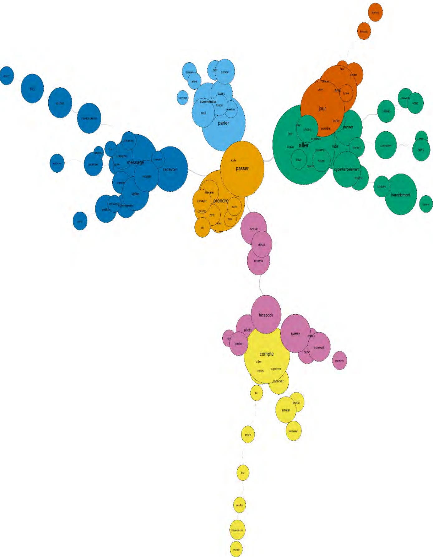
Schéma d'analyse des similitudes du corpus