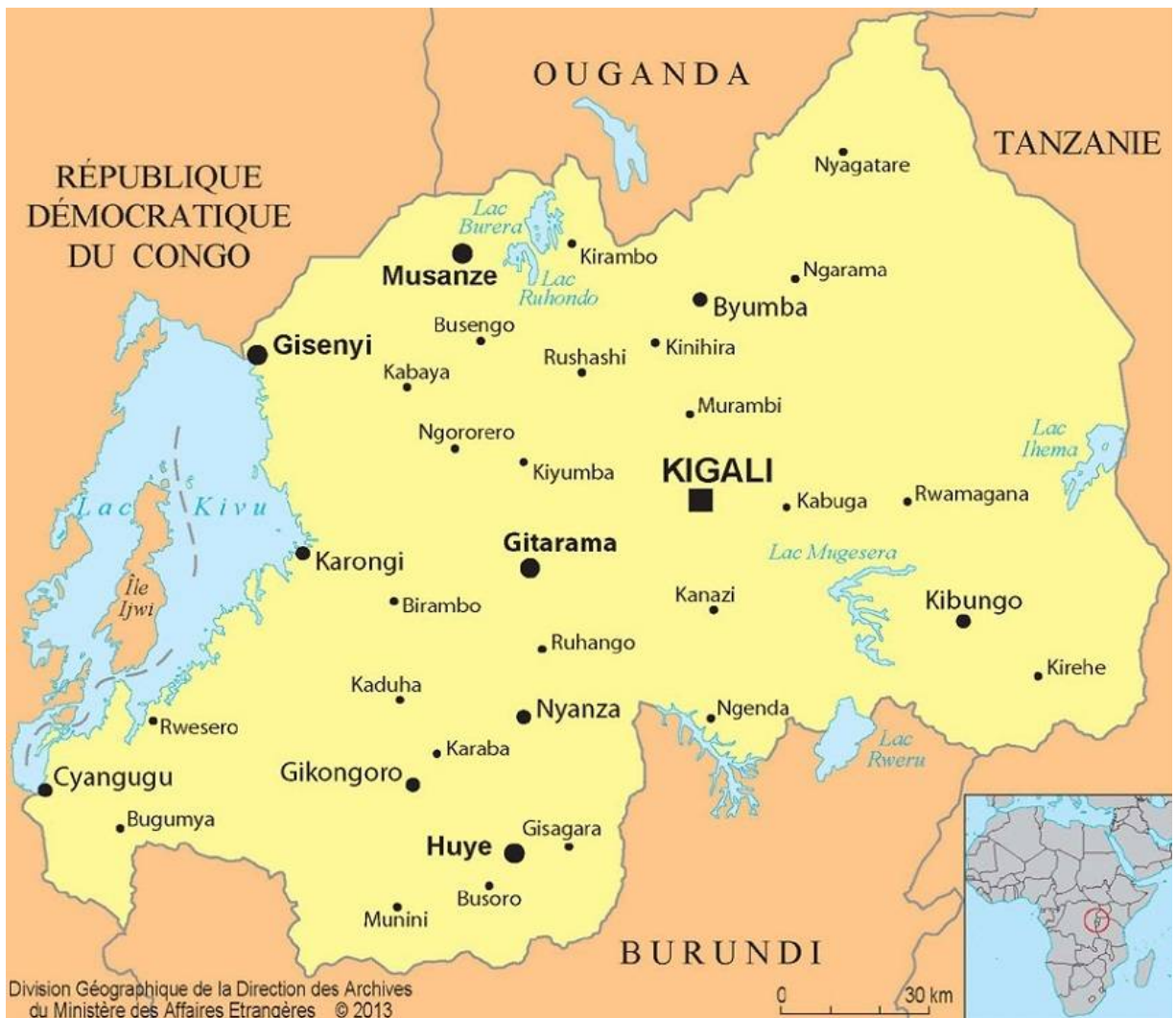
Carte du Rwanda 2013 17

m pour le sommet du volcan Karisimbi. En abordant l’histoire de l’évangélisation du Rwanda qui a débuté en février 1900, nous la divisons en deux grandes périodes : la période coloniale qui va de 1900 à 1962 et la période postcoloniale du 1 er juillet 1962 à nos jours.