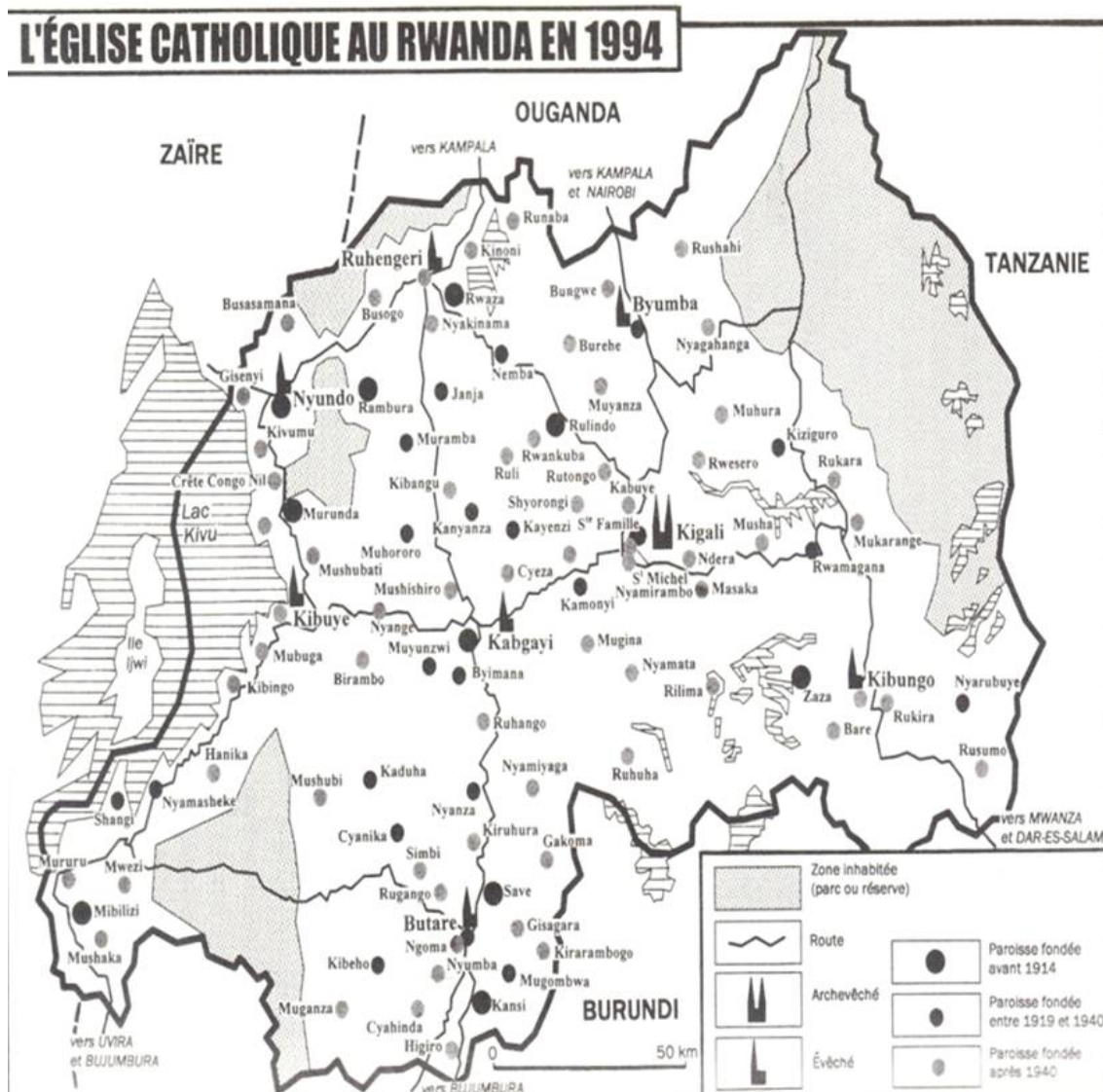
Carte de l'Église catholique au Rwanda en 1994 40

Inspirés par le Concile Vatican II, les Évêques rwandais essaieront de définir une pastorale adaptée aux réalités d'une société rwandaise en mutation. Les seize documents conciliaires sont là pour orienter les réformes que l'Église catholique entend mener en vue d'une meilleure évangélisation du monde contemporain. L'épiscopat rwandais a principalement quatre défis à relever : la fidélité à sa mission d'évangélisation en s'adaptant aux nouvelles institutions