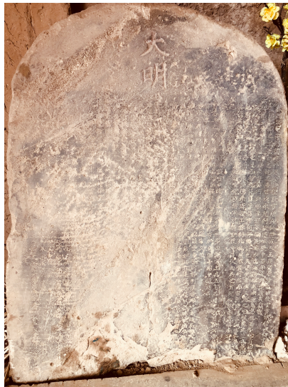
FIG. 1.1 : Photo prise au temple de Nianduhu pendant l'enquête de terrain, en 2018.

Une stèle de la dynastie des Ming nommée Wang Tingyi bei (王庭仪碑) est sauvegardée au temple de Nianduhu aujourd'hui. D'après l'inscription, les cinq cent soldats provenant des quatre troupes furent sélectionnés pour construire le bastion Bao'an (保安堡, bao'an bao en pinyin) au Tuotun. Pendant la dynastie Qing, le bastion Bao'an a été rebaptisé bataillon Bao'an (保安营, bao'an ying en pinyin); par ailleurs, une résidence officielle (都使司衙门) fut établie ici.