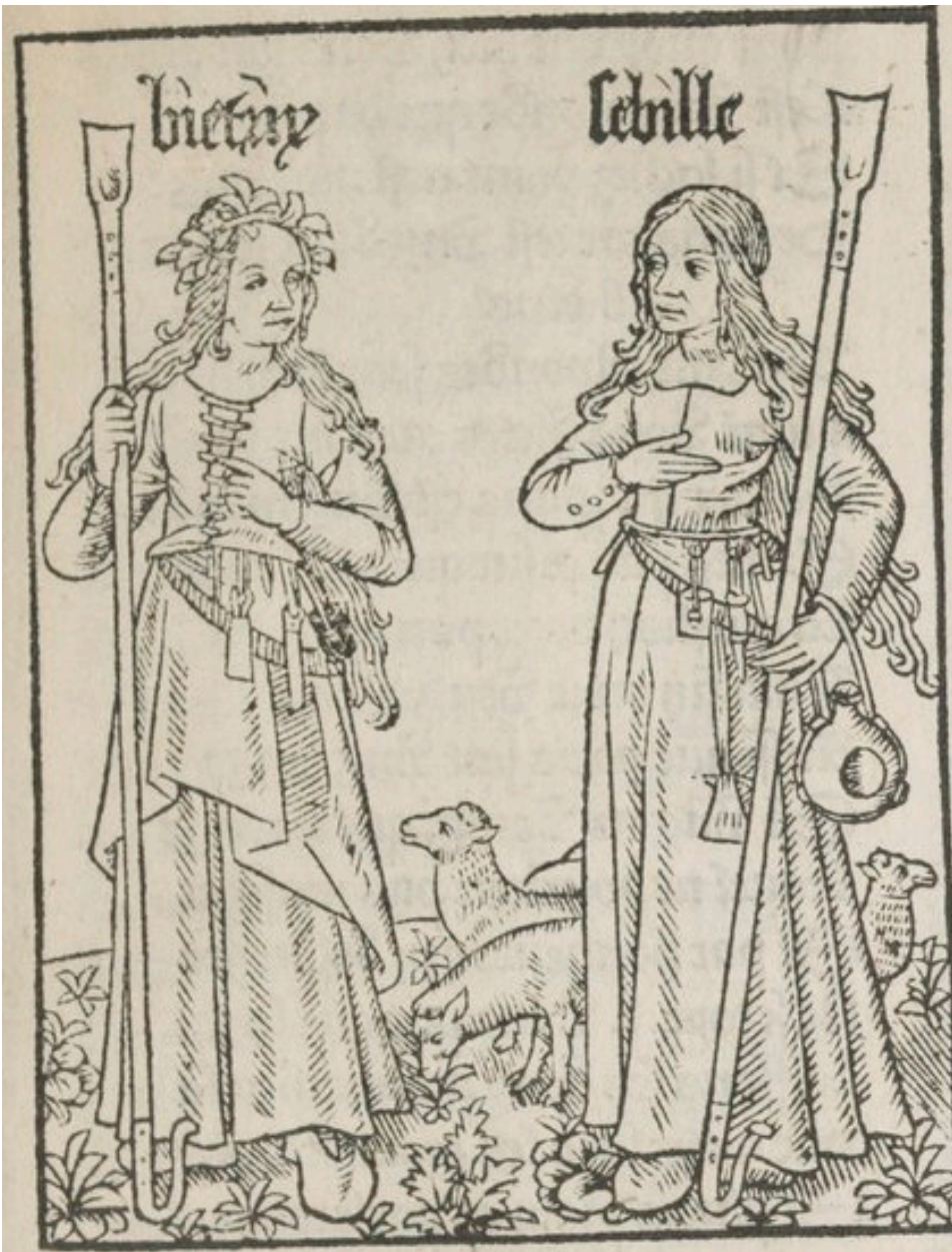
Le Calendrier des bergères, p. 17