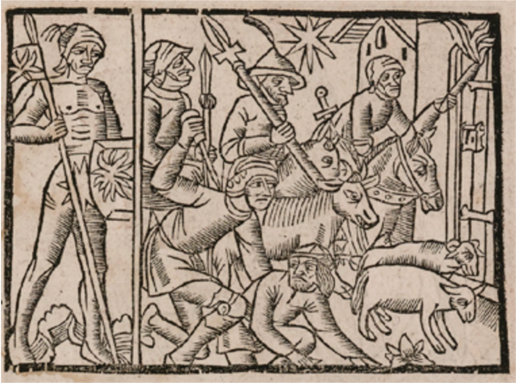
CALENDRIER DES BERGERS, GENÈVE, VERS 1498-1500, BNF, RÉSERVE V-277