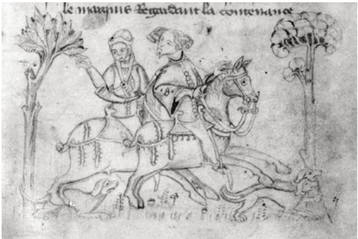
Le seigneur et son compagnon, folio 16 r°