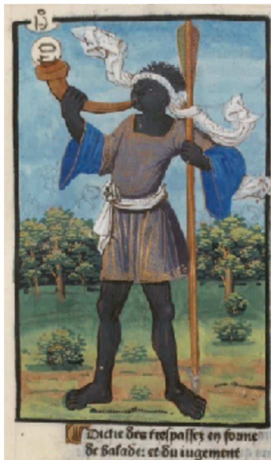
Calendrier des bergers, Velin 518, vue 184