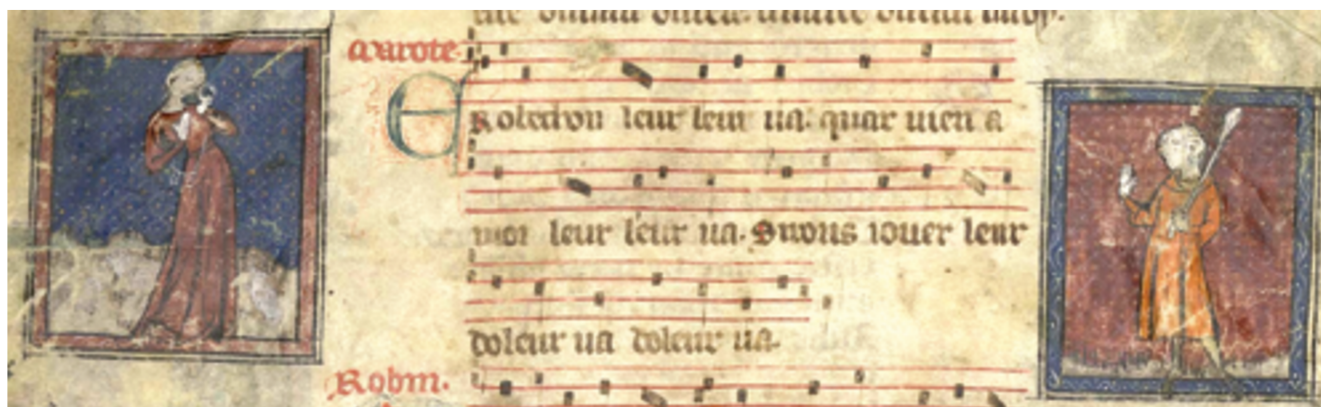
Détail, Aix-en-Provence, Bibliothèque Méjanès, 166, folio. 2 v°