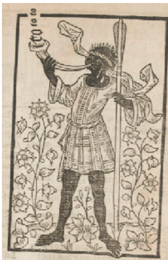
Calendrier des bergères, vue 115