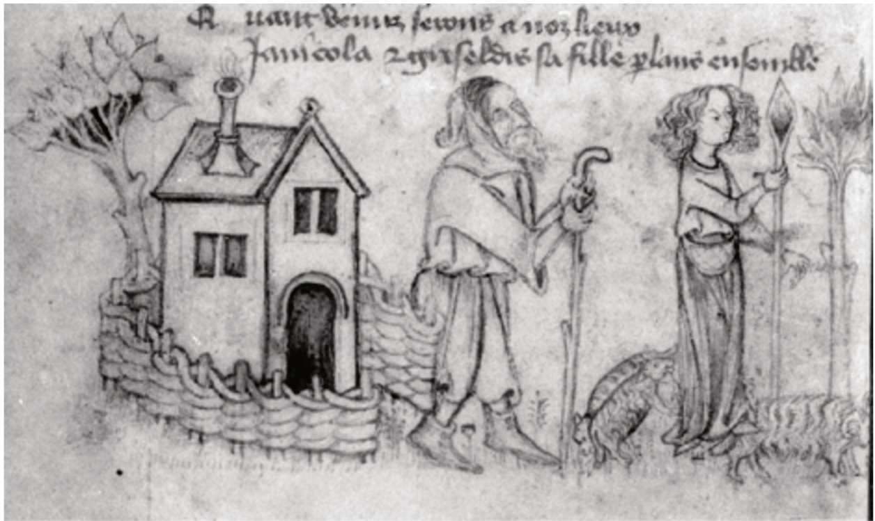
Griseldis et son père, f. 15 v°