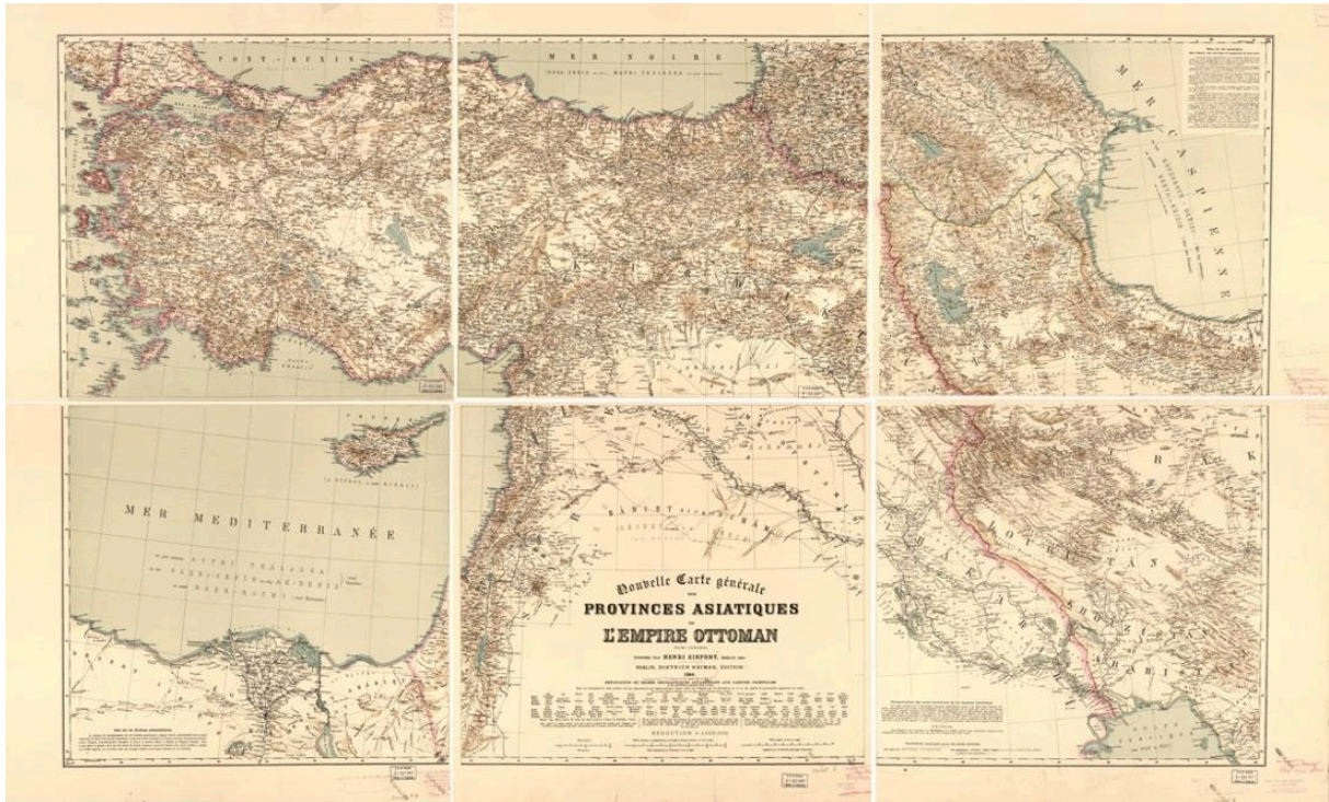
FIGURE 1: CARTE DE L'EMPIRE OTTOMAN PAR HENRICH KIEPERT