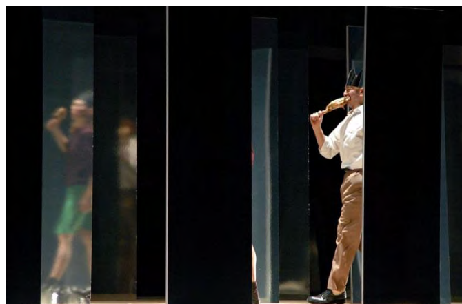
Figure 2 : un personnage insolite dans Umwelt (2004) © Didier Grappe.

En s'imposant de telles contraintes temporelles et spatiales, Maguy Marin déforme la réalité pour mieux la donner à réfléchir. Pour évoquer « notre presque rien 1 », « la fuite indéfinie de ces micro-événements qui ne méritent pas d'être racontés et qui tombent quasi hors de toute mémoire 2 », elle fait le choix d'une forme contraignante et d'un dispositif fictionnalisant qui produisent un effet de défamiliarisation. Dans Umwelt , la figure archétypale, le geste ordinaire, l'action triviale sont certes donnés à voir comme autant de façons possibles d'être au monde, mais ils le sont à la manière d'un ballet d'actions d'une grande étrangeté et souvent, aussi, d'une surprenante drôlerie. En témoignent, par exemple, les variations proposées autour de l'action de manger : d'abord traité selon les modalités les plus banales (passant.es mangeant une pomme, un gâteau, un sandwich, un hamburger, etc.), ce motif dérive peu à peu vers des images plus inattendues (hommes couronnés dévorant à pleines dents une cuisse de poulet, femmes aux oreilles de lapin croquant une carotte, humains à quatre pattes agitant un faisán dans leur « gueule », etc.).