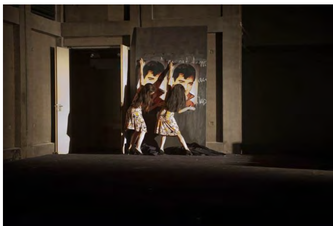
Figure 14 : une image à la Andy Warhol dans Salves (2010).

Ajoutons, pour finir, que la condensation des temporalités s'opère aussi dans la superposition entre les images optiques et le montage sonore. En effet, la bande-son de Salves convoque explicitement le passé : archives radiophoniques, extraits de films célèbres, bruits de rue, autant de vestiges crachotés par les bandes magnétiques des vieux « Revox ». Plus spectral que les images qu'anime la présence des interprètes en chair et en os , le montage sonore ne fait jamais que réactualiser le passé dans le présent. C'est pourquoi les sons, fantômes qui hantent « l'espace à transformation » de la scène, sont plus inquiétants que les séquences visuelles avec lesquelles ils entrent en collision. Parmi ces « présences