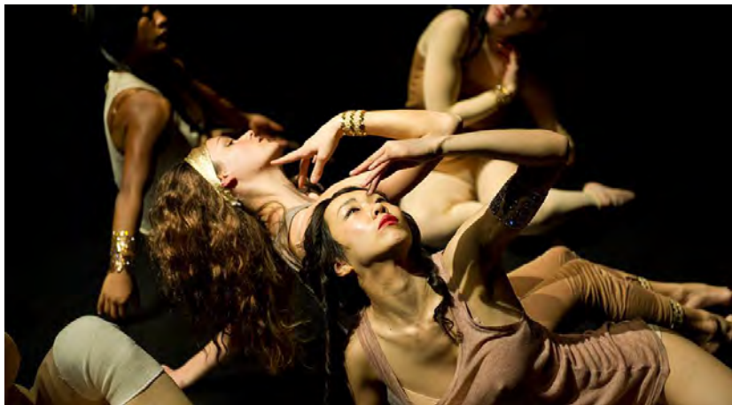
Figure 22 : les Odalisques, Masculines (2013) © faitsdhiver.com.

Dans Masculines , le traitement parodique du Bain Turc n'est que le coup d'envoi d'un jeu d'imitation de plus en plus outrancier où l'érotisme le cède rapidement à la pornographie. Comme le suggère la juxtaposition des séquences, en dépit d'un régime de visibilité différent, la rupture spatio-temporelle n'est pas synonyme d'un changement de paradigme 2 : les femmes restent avant tout des objets sexuels. Ainsi, après qu'une des sept danseuses s'est livrée sous les sifflets des six autres à une danse lascive digne d'un peep-show , les Odalisques font place aux sex-toys . Vêtues de couleurs criardes et chaussées de talons hauts, pareilles à des automates grandeur nature, les interprètes prennent des poses suggestives sur un rythme saccadé en poussant de petits cris d'excitation. À l'avant-scène, une danseuse aux jambes interminables va et vient en jetant au public des regards racoleurs. Une lumière rouge baigne la scène par intermittences. Seule, à l'arrière-plan,