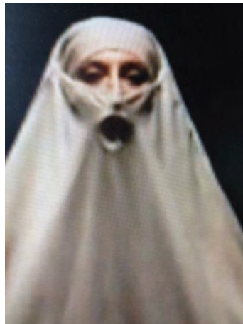
Figure 18 : "Le Cri", Manta (2009) © Laurent Philippe.

L'intention critique est donc omniprésente dans Manta , minant la beauté des images les plus esthétisantes. C'est que la chorégraphe s'attache principalement à mettre en évidence la manière dont le voile intégral soumet la personne à un régime sensoriel fondé sur une technologie politique du corps qui en affaiblit la puissance. En effet, le voile atténue les perceptions par lesquelles le sujet est relié au monde : exception faite des yeux, des mains et des pieds, le reste du corps, la peau, ne sont plus des interfaces avec l'extérieur, ce qui fait du corps voilé un corps perceptivement autistique. Dénonçant les présupposés politiques qui sous-tendent ce régime de séparation sensorielle, Manta met en scène une figure totalement muette. Quand elle ouvre la bouche, c'est pour chercher l'air sous la membrane de tissu, formant le « O » silencieux du « Cri » de Munch, ou celui, plus trivial, d'un poisson hors de l'eau.