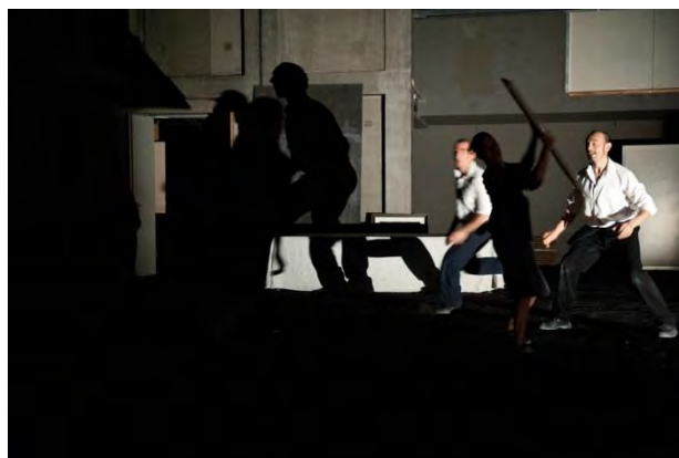
Figure 12 : scène de jonglage, Salves (2010) © Didier Grappe.

Devant ce spectacle, on comprend que « l'improbable et minuscule splendeur des lucioles [...] ne métaphorise rien d'autre que l'humanité par excellence, l'humanité réduite