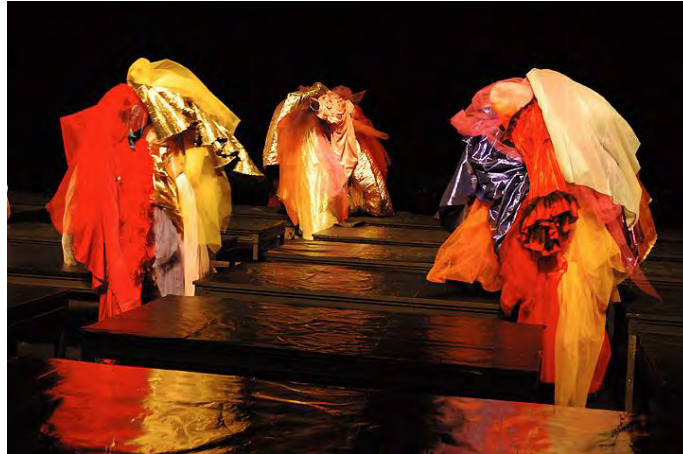
Figure 7 : les « paysages mouvants » de Turba (2007) © Didier Grappe.

étrangeté n'excluant pas une prise de distance amusée, un trouble qui tire le spectacle du côté des esthétiques queer 1 .