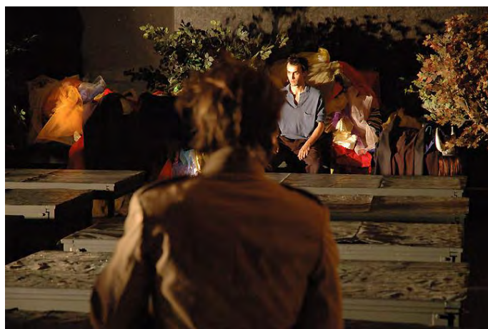
Figure 5 : corps quotidien et corps ludique dans Turba (2007) © Didier Grappe.

Ce principe de discontinuité est mis en place dès le début du spectacle à travers la construction successive de cinq courts « tableaux ». Là, des interprètes en tenue quotidienne viennent à l’avant-scène se travestir grossièrement ou se faire travestir et grimer par un partenaire, avant de prendre la parole pour énoncer un extrait du poème de Lucrèce. Ces « tableaux » composés à vue s’apparentent au genre du portrait. Ils donnent à voir des figures étranges, figures exposées et non personnages incarnés : poète latin en toge