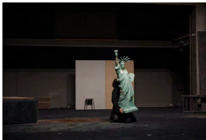
Figure 13 : des symboles éculés ? Salves (2010) © Didier Grappe.

En même temps, les séquences de jonglage font apparaître le pouvoir qu’ont les images à transmettre des valeurs. Ici, la solidarité, l’entraide, l’effacement de soi au nom d’un intérêt supérieur sont proposés comme autant de contre-valeurs à celles prônées par l’économie de marché et la société du spectacle. On comprend aussi qu’elles traduisent l’urgence d’« ouvrir une brèche dans le continuum du temps 2 », le jonglage apparaissant comme la métaphore possible de la collision entre un présent actif et son passé réminiscent. Surgis de la nuit, les passeuses et les passeurs de Salves sont des porteurs de mémoire : les différents objets qu’ils font circuler (malgré les chutes, la casse) appartiennent tous à culture européenne, traces des luttes du passé (« Guernica » de Picasso, « Tres de Mayo » de Goya) et dépositaires de valeurs politiques pour le présent et l’avenir (« La Statue de la Liberté », « La République guidant le peuple » de Delacroix...).