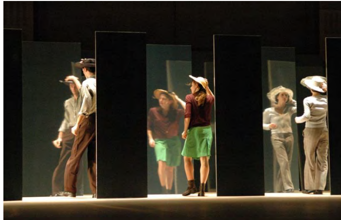
Figure 1: le « Palais des Glaces » d' Umwelt (2004) © Didier Grappe.

puissant provoqué par un énorme ventilateur installé à jardin. De la sorte, ils diffractent les corps et les gestes comme dans un palais des glaces, créant un véritable kaléidoscope de reflets tremblés et fuyants, insaisissables.