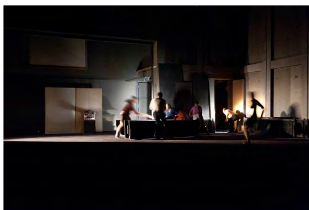
Figure 11 : les « passants » de Salves (2010) © Didier Grappe.