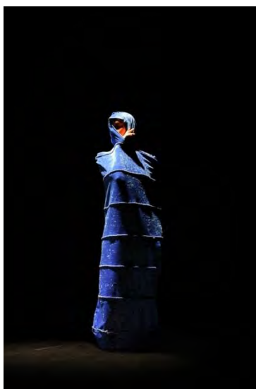
Figure 20 : la burqa-tube, Lost in burqa (2011) © viadanse.com.

En brouillant les frontières référentielles pour donner libre cours à l'imaginaire, Lost in burqa rejette les termes binaires dans lesquels le débat sur le voile intégral est ordinairement posé. Ouvrant le cadre de la doxa , il l'aborde dans une perspective anti-