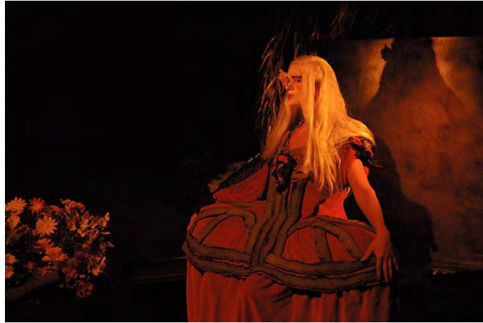
Figure 6 : un « tableau vivant » dans Turba (2007) © Didier Grappe.

cette forme de théâtre de salon popularisée par Lady Hamilton à la fin du XVIII e siècle 1 : pris dans un flux continu d'images en constante métamorphose, le spectateur voit progressivement le « tableau » se faire puis se défaire sans que la parole ne s'interrompe avec l'apparition de la figure, même si cette apparition constitue sans conteste un temps fort du spectacle.