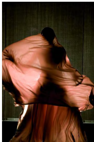
Figure 19 : le corps révélé, Manta (2009) © Laurent Philippe.

accomplit à la fin de Manta une mue triomphale : en jean, talons, cheveux au vent, elle apparaît parée de tous les atours de la « femme occidentale » pour entonner façon karaoké le célèbre tube de James Brown It's a man's world , puis égrener au micro une liste de femmes célèbres. À la reconquête de la parole succède celle de l'espace : après avoir ôté ses talons, le chorégraphe s'empare du podium avec jubilation, son corps se déployant dans toutes les directions comme pour explorer l'ampleur de sa kinésphère. Renversement de situation. Est-ce à dire que la femme occidentale, contrairement à la femme arabomusulmane, échappe à la domination masculine ? N'est-ce pas l'une des limites du spectacle que d'opposer schématiquement les deux, au risque de faire de la seconde le paradigme absolu de l'oppression des femmes ? Selon nous, ce n'est pas tant l'univocité de Manta qui en limite la portée politique que le manichéisme apparent qui sous-tend le propos – un piège idéologique auquel, comme nous allons le voir, Lost in burqa échappe avec subtilité.