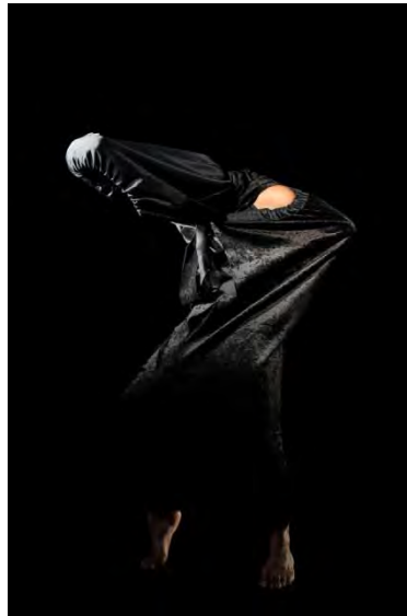
Figure 21 : un Darth Vader d'un nouveau type, Lost in burqa (2011).

manichéenne qui refuse d'en faire un sujet d'affrontement idéologique entre l'Orient et l'Occident, le Sud et le Nord, l'islam et le christianisme, la tradition et la modernité. Plus subtilement, il nous invite à voir sous le voile des apparences le Même dans l'Autre, et sous le masque uniforme de l'Archétype une prolifération d'identités multiples.