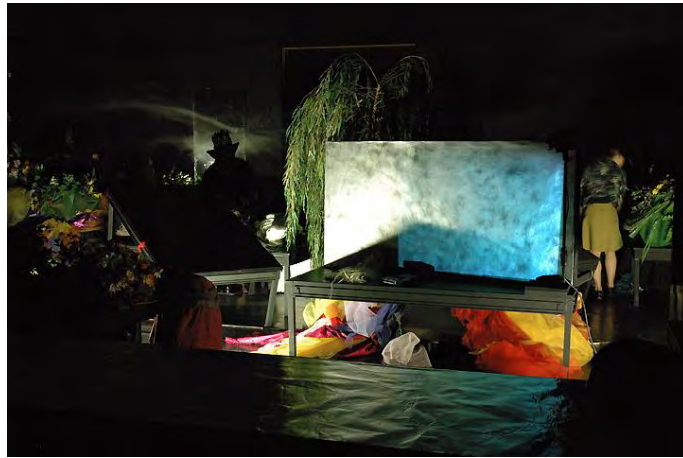
Figure 8 : l'image finale de Turba à la splendeur baroque (2007) © Didier Grappe.

du poème consacré à cette idée est énoncé en français à la fin de Turba , alors que la confusion entre le réel et le simulacre est amplifiée par des effets de clairs obscurs et de dédoublement vertigineux : interprètes et mannequins habillés à l'identique, reflets au miroir, images vidéo.