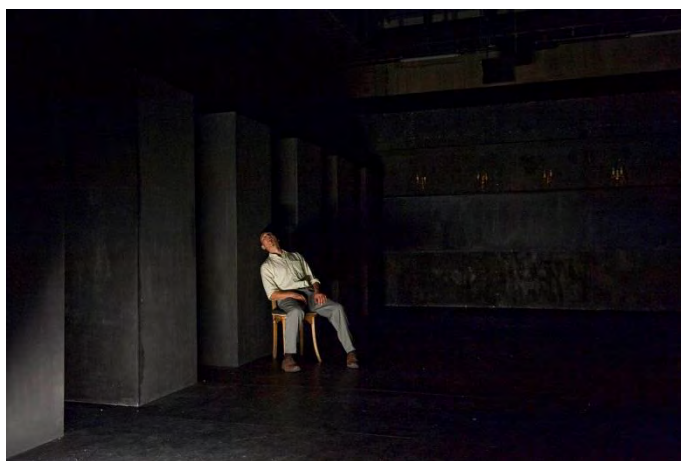
Figure 10 : le Dormeur, nocturnes (2012)

À cela plus qu'à tout le reste, peut-être, on comprend que l'un et l'autre ne procèdent pas de la même intention : dans Salves , il s'agit de lutter contre le pessimisme qui referme l'avenir sur un présent désespérant, d'ouvrir une brèche entre le passé et le futur. Dans nocturnes , en revanche, le temps est pure mémoire . Plus métaphysique que politique, ce spectacle donne à appréhender la vie de la conscience, une conscience entièrement faite de l'accumulation du passé dans le présent 2 . Aussi se présente-t-il tout entier comme une forme ouverte, une coupe de durée prise dans un flux. Du reste, c'est sur un noir, non sur une image, qu'il s'ouvre et se clôt, noir qui appelle l'image en amont et en aval de lui. Cette coupe de durée comporte donc un certain caractère arbitraire malgré la reprise au début et à la fin du spectacle de la même image – celle d'une personne endormie sur une chaise. Mais la circularité n'est pas ici synonyme de clôture. Car l'image liminaire du Dormeur condense une idée essentielle de nocturnes , à savoir que ses images y sont avant tout celles d'un paysage intérieur.