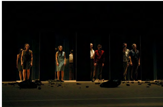
Figure 4 : les interprètes-rhapsodes dans Umwelt (2004) © Didier Grappe.

À l'évidence, chez Maguy Marin, le modèle musical de la fugue constitue donc un moyen privilégié de mise en œuvre de cette idée. Dans Umwelt , la polyrythmie participe de la dérive progressive des images et de leur contamination réciproque. Alors qu'au début du spectacle, leur flux et reflux semblent fondés sur la même durée à partir d'une unité de mesure temporelle de 10 secondes, leur durée d'exposition se met peu à peu à varier (par exemple, par le doublement ou le triplement de cette unité) en même temps que varie la longueur des intervalles entre les images qui se raccourcissent par effets de tuilage. Ainsi, à la démultiplication des images, la chorégraphe ajoute la diversification de leur temps d'exposition selon une logique avant tout musicale et non mimétique. La polyrythmie qui sous-tend l'écriture scénique est d'autant plus sensible que le continuum spectaculaire s'interrompt parfois, empêchant le spectateur de s'abandonner totalement au flux et au reflux hypnotique de cet horizon mouvant. Ainsi, à intervalles irréguliers et sans qu'il soit possible de l'anticiper, un ou plusieurs interprètes s'immobilisent pour regarder longuement le public. Dans un face à face d'une grande simplicité, ils suspendent pour un moment le flux des actions et des gestes pour se donner à voir comme des points fixes. En tenue quotidienne, le visage comme lavé de toute intention, ils se tiennent simplement en présence du spectateur et en miroir de lui.