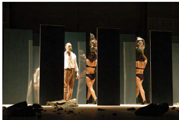
Figure 3 : la « belle mécanique » se détraque dans Umwelt (2004) © Didier Grappe.

À la dérive des actions ordinaires vers le burlesque ou l'étrange s'ajoute la dérive des personnages et des gestes qui s'hybrident entre eux comme par effet de contamination. Ainsi de ces têtes couronnées qui poussent négligemment du pied une cannette, se grattent la tête ou portent un sac poubelle comme les plus parfaits quidams. Et plus on avance dans le spectacle, plus on s'éloigne du réalisme, comme si le dispositif de flux et de reflux des images se déréglaient, le gestus de l'un se déplaçant vers un autre auquel il n'est pas « naturellement » associé (Quoi ? Deux hommes couronnés passent la serpillère ? Comment ? N'est-ce pas un homme parmi ces starlettes en robes de soirée ?). Autrement dit, la parfaite mécanique de départ où chaque type était reconnaissable à un élément vestimentaire, un accessoire, une posture, un geste, insensiblement se détraque. Ici ou là surgissent des images inédites qui ouvrent le champ des possibles. Surprise. Rire aussi car cette mise en dérive des images produit souvent un effet comique. Malaise, enfin, quand ce n'est plus une cannette que l'on repousse du pied comme une ordure mais un poupon joufflu.