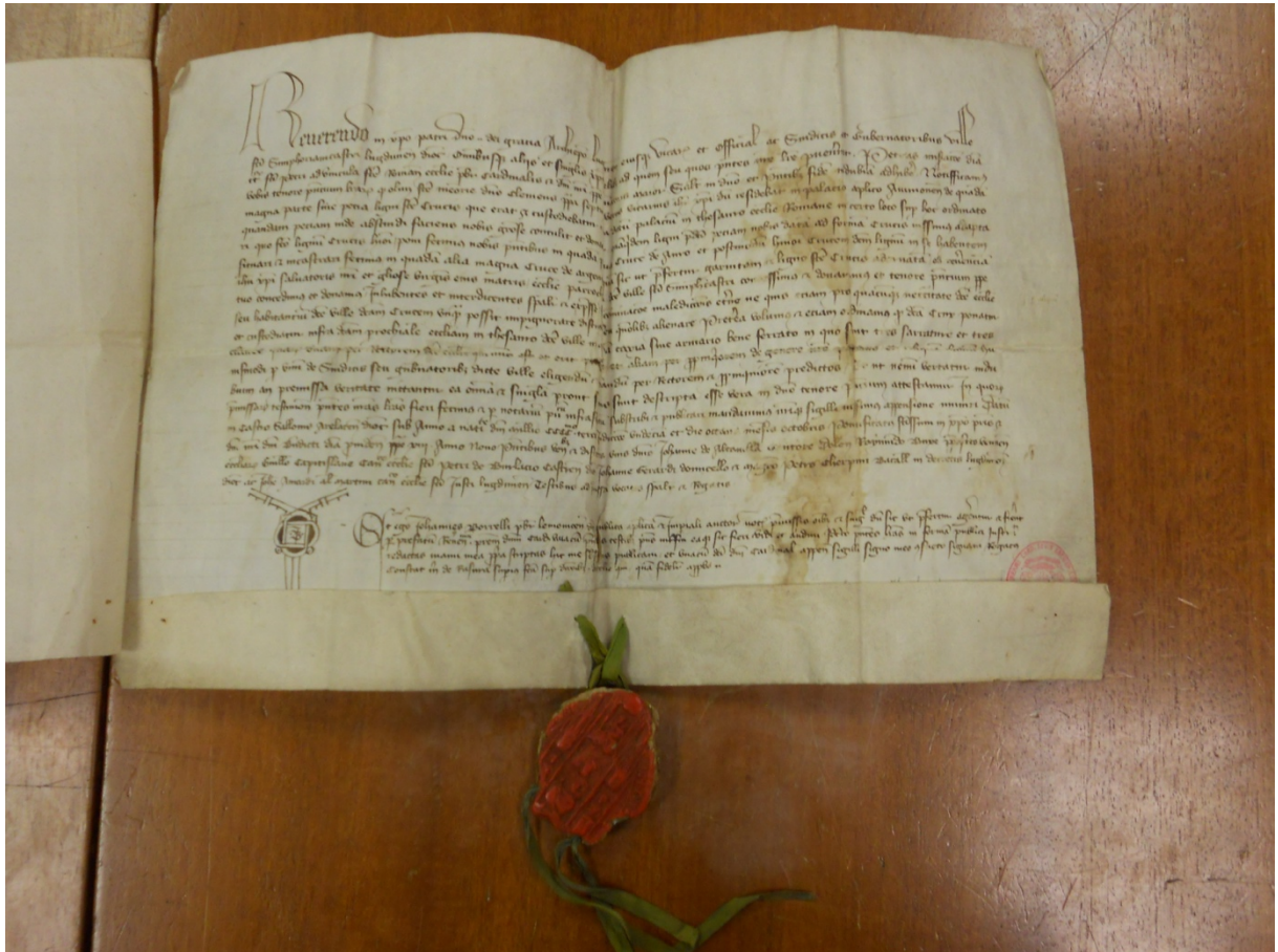
Lettre de donation de la relique de la Sainte-Croix ; Archives Municipales, Saint-Symphorien-sur-Coise