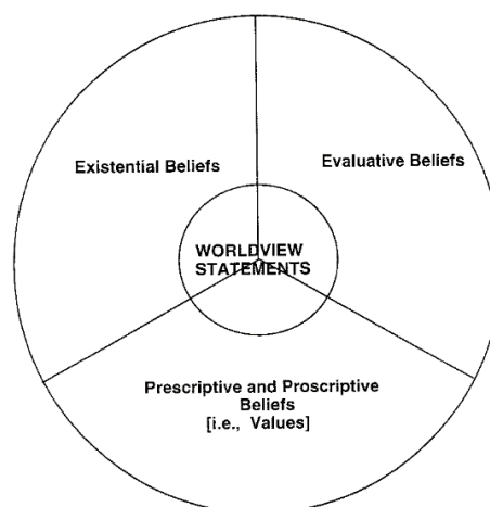
Fig. 1 : Relations conceptuelles entre croyances, valeurs et énoncés constitutifs d'une vision du monde (M. Koltko-Rivera)

Ainsi peuvent appartenir à la vision du monde : certaines croyances existentielles (« Dieu existe et il m'aime. », « Le libre arbitre n'existe pas. », « Seule la science nous permet d'atteindre la vérité. », etc.), certaines croyances évaluatives (« Les hommes sont par nature mauvais. », « Les Anglais sont perfides. », etc.), certaines croyances prescriptives/proscriptives (« Il faut vivre l'instant présent. », « L'argent ne fait pas le bonheur. », etc.). Par rapport au reste du set de croyances de l'individu, elles présentent une primauté fondationnelle : les autres croyances les présupposent, même si le rapport condition/conditionné (conséquence) n'implique pas une cohérence inférentielle parfaite.