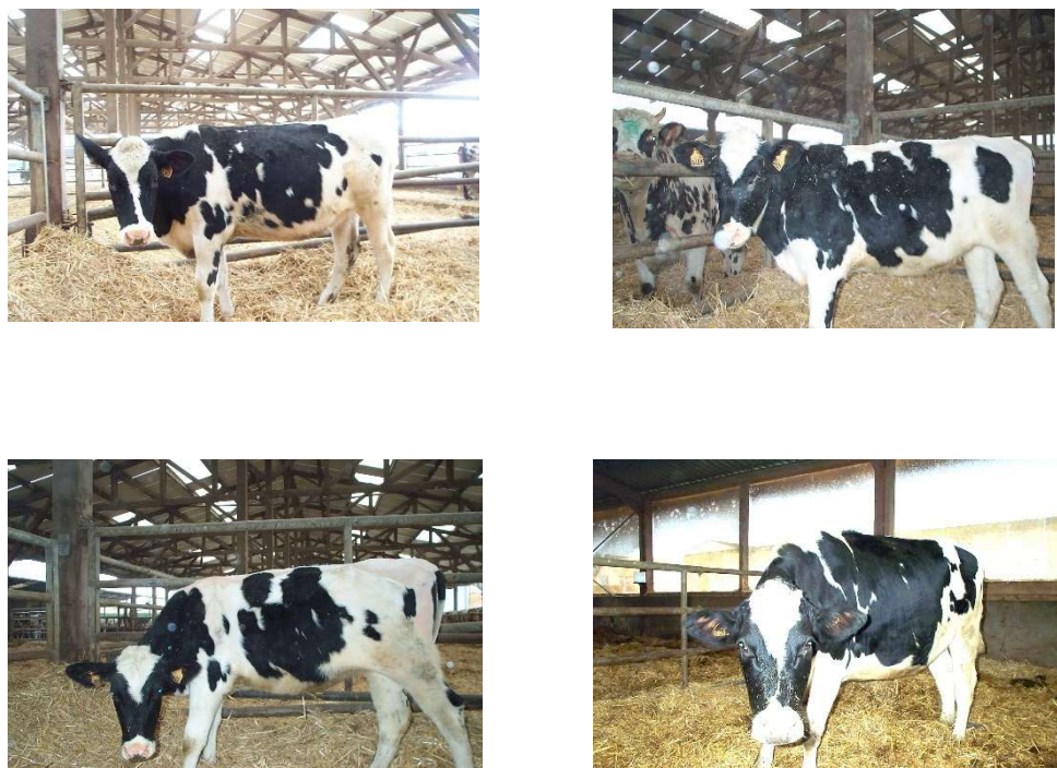
Figure 1 : La réalité des clones bovins de l'INRA en 2003-2009 (génotype 2251). De gauche à droite, en haut : vaches 0357, 0401, en bas : vache 0402 et vache donneuse 2251.

Ce qui s'impose à la volonté de cloner, désirant un génotype identique et un phénotype très similaire, c'est la réalité des clones ( Figure 1 ). La réalité des clones, comme résultats du laboratoire variables et incertains et aussi comme êtres vivants à part entière ; Cette réalité des clones nous indique que les clones ne peuvent plus servir, en toute rigueur, de modèle de l'identité ni biologique car ce serait mensonger, ni génétique car, sans vérification poussée, cela serait trop risqué. En revanche, à travers l'étude des caractéristiques particulières des animaux clonés, émerge l'occasion de tester expérimentalement des questions fondamentales comme la part de l'épigenèse et de la génétique dans le développement et l'identité biologique d'un individu. Ainsi, les clones pourraient, comme nous allons le voir dans notre deuxième partie, servir de modèle de l'individuation biologique par les processus épigénétiques et adaptatifs qu'ils permettent de révéler.