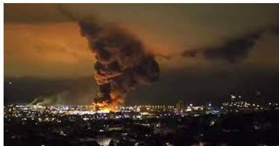
Incendie de Lubrizol à Rouen, septembre 2019

76. Décloisonnement des processus décisionnels en matière sanitaire – On peut observer des tentatives similaires en matière sanitaire. Et aussi les mêmes limites quant à la possibilité de décloisonner les politiques de santé. L’idée s’est imposée : la santé implique des