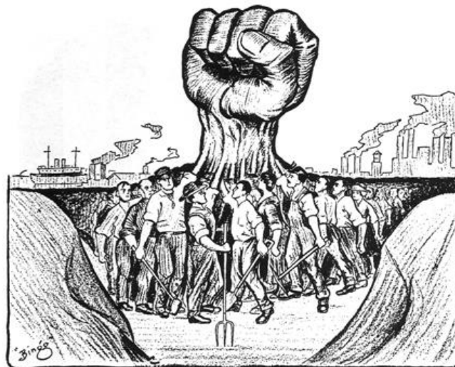
Solidarity, June 30, 1917. The Hand That Will Rule the World—One Big Union.

93. La concrétisation de l'idée de solidarité dans le système français de protection sociale - En France, juridiquement l'idée de solidarité est partie liée avec l'idée de fraternité. Alain Supiot rappelle ainsi que « c'est en effet la Constitution du 4 novembre 1848 qui a fait de la fraternité l'un des principes de la République (art. IV) et proclamé que les citoyens "doivent concourir au bien commun en s'entraidant fraternellement les uns les autres" (art. VIII) » 278 . Elle sera plus tard au cœur du projet de la Sécurité sociale créée en 1945 et fut alors exprimée ainsi : « De chacun selon ses moyens, à chacun selon ses besoins ». On saisit immédiatement à travers cette formule que le système de protection sociale contribue à garantir un droit universel à la protection sociale, mais que cette universalité dépend tout autant de la solidarité qui existe entre les membres de la société. S'y lit en effet le lien nécessaire qui doit exister entre les mécanismes de contribution et les mécanismes de redistribution et l'importance de ne pas perdre de vue le rapport entre le soutien collectif et le bénéfice individuel. Le principe est désormais énoncé à l'article L. 111-1 du Code de sécurité sociale qui énonce ainsi que « la sécurité sociale est fondée sur le principe de solidarité nationale ».