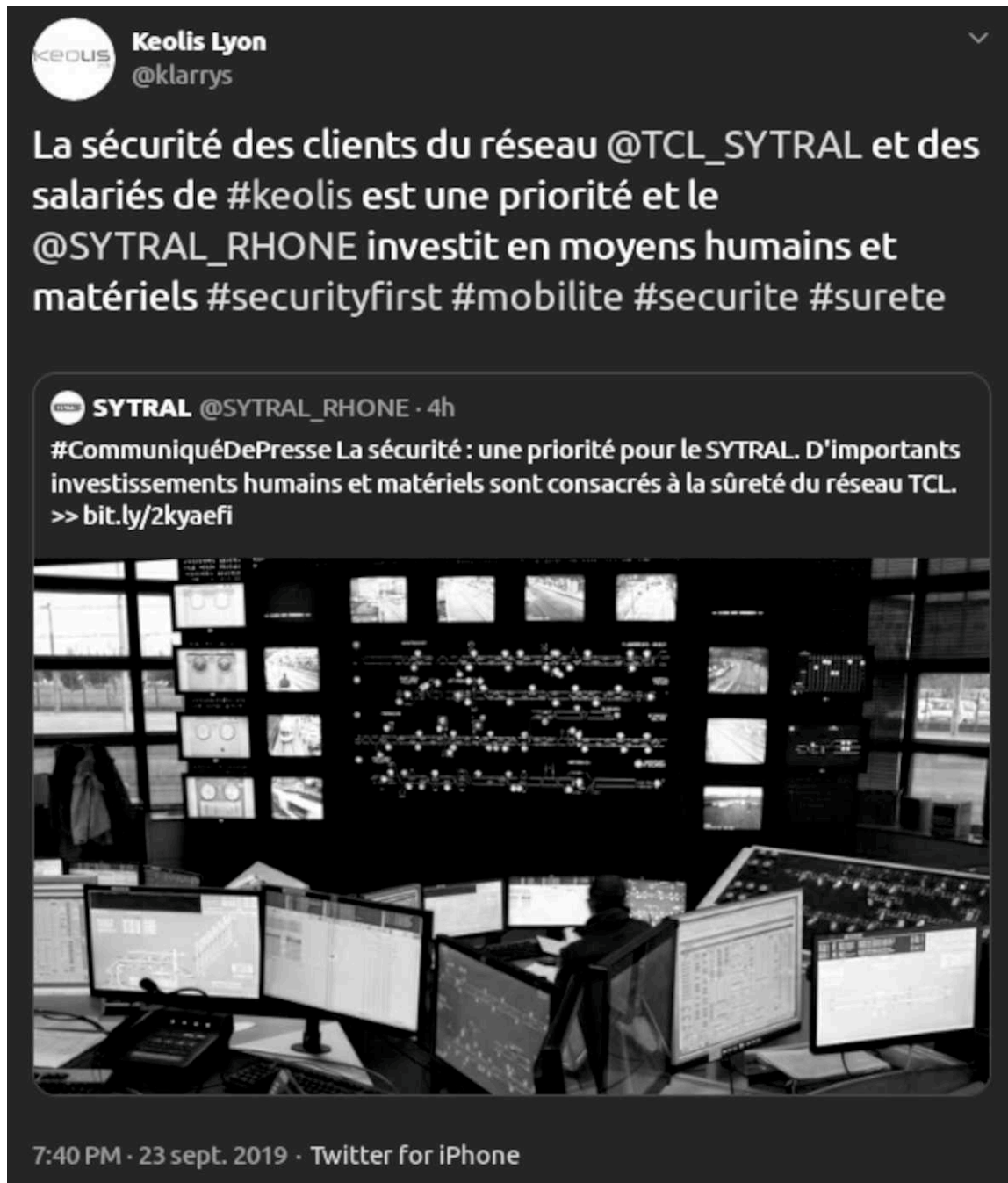
FIGURE 4 – Manifestation ordinaire de la revendication sécuritaire.