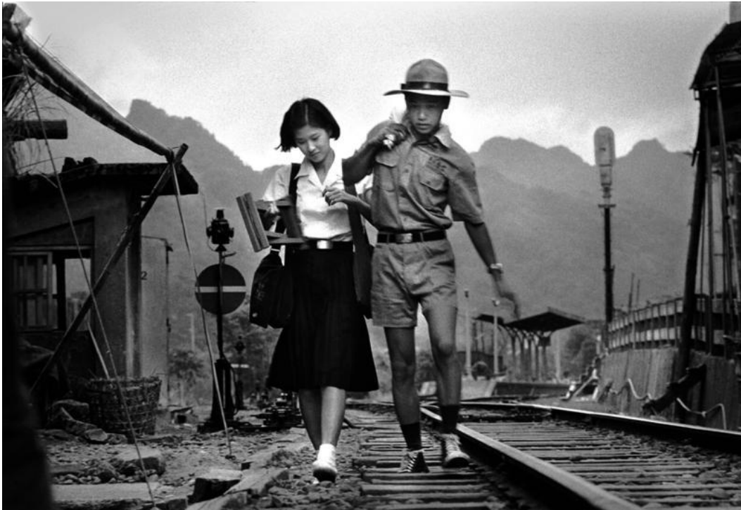
Image 4. Le paysage rural dans le film Poussières Dans le Vent de Hou Hsiao-hsien 198