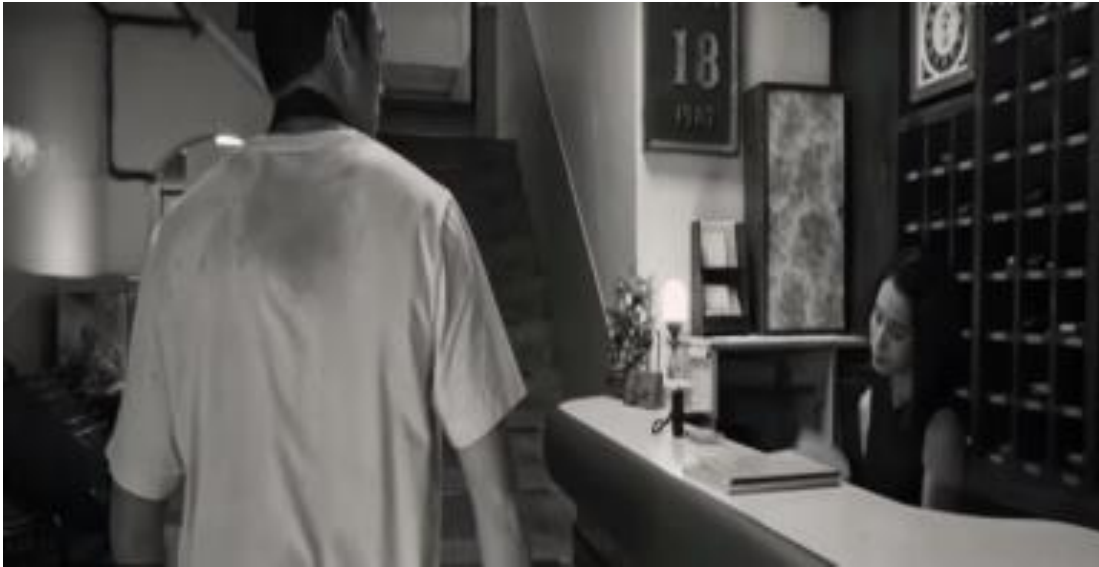
Image 25. Apparence de l'hôtel en 1987