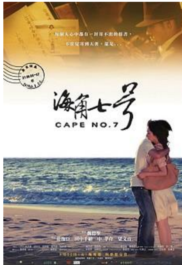
Image 1. L'affiche de Cape No. 7

À l'opposé de l'esthétique du Nouveau Cinéma taïwanais , le film Cape No. 7 pourrait plutôt être considéré comme un film commercial et une comédie, car il se caractérise par des montages rapides, un récit simple et drôle, a été tourné en dialecte local et introduit aussi différents types d'argots, enfin les paysages du sud de Taïwan en sont les éléments constitutifs.