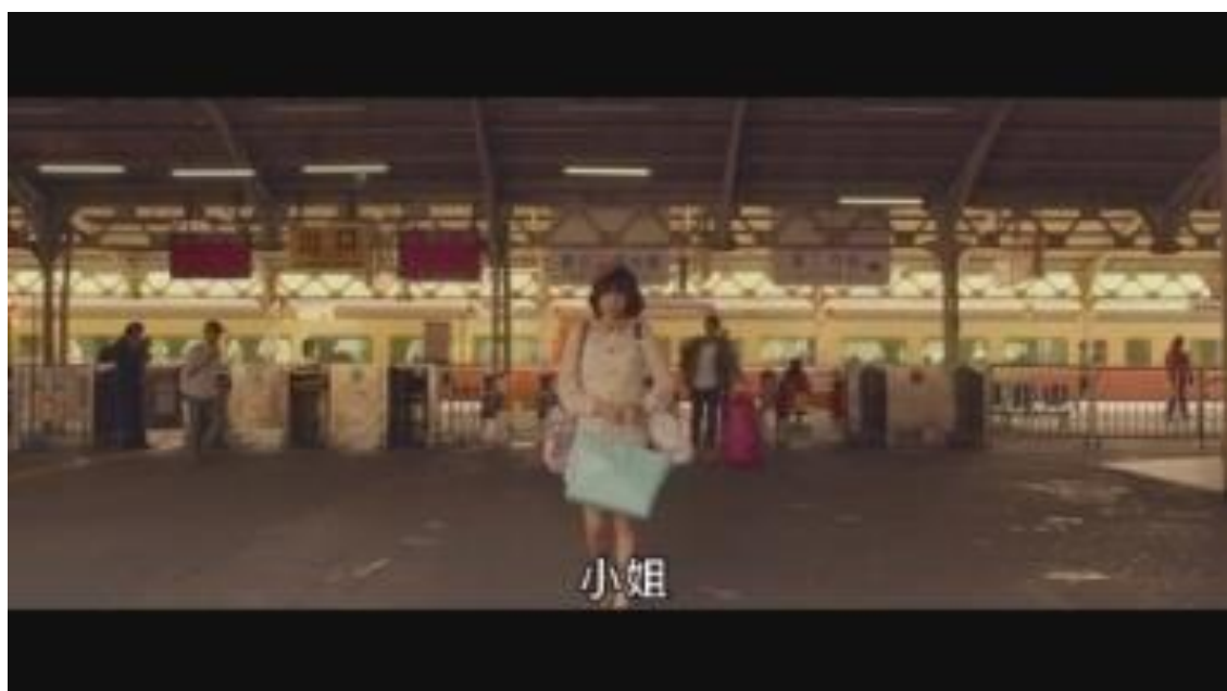
Image 35. Gare de Taïnan se trouvant au sud de Taïwan

exemple, l'image 35 qui représente l'arrivée de l'héroïne dans sa ville natale Taïnan, contraste avec la noirceur de l'image 34 représentant la gare de Taïpei (au moment du départ du personnage, le soir), la couleur de la gare de l'image 35 est plus claire (l'arrivée dans la journée). De plus, le réalisateur a utilisé le plan d'ensemble afin de représenter les gares de Taïpei et de Taïnan. Cependant, l'image de la gare de Taïpei (image 34) est découpée dans l'image qui la représente par les lignes de l'architecture de la station, ce qui suscite une atmosphère oppressante. À contrario, dans l'image 35 de la gare de Taïnan, nous pouvons voir la profondeur du champ : nous voyons d'abord la protagoniste, puis l'espace de la sortie de la gare, et la voie et le train au fond de l'écran. Cette image offre une vision plus ouverte du paysage et de l'environnement et signifie également que l'avenir va davantage s'ouvrir pour la protagoniste.