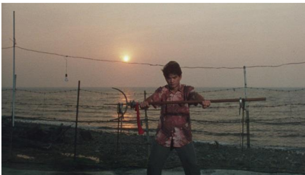
Image 6. Le paysage dans le film Ah Chung 203

Même si le Nouveau Cinéma taïwanais a symboliquement pris fin par la « Déclaration du cinéma taïwanais » en 1987 200 , certains cinéastes néophytes influencés par ce courant ont malgré tout encore suivi ses esthétiques ou procédés scénaristiques. D'une part, concernant le regard porté sur l'urbanisme, le réalisateur Tsai Ming-liang, par exemple, a utilisé à son tour de longs plans-séquences en suivant les protagonistes alors qu'ils traversaient la capitale et dévoilé les confusions, les désirs et les absurdités propres au monde moderne. D'autre part, le réalisateur Chang Tso-chi a perpétué la conscience locale de Hou Hsiao-hsien et mis en scène la campagne. Prenons en guise d'illustration le film Ah Chung (忠仔, 1997) (Image 6) : même si son histoire se situe à Taïpeï, la caméra s'éloigne tout de même jusqu'à sa banlieue, la plaine de Guandu 201 . Si les films de Hou Hsiao-hsien dépeignent la nostalgie vis-à-vis du monde rural, ceux de Chang Tso-chi représentent quant à eux davantage les métaphores de l'appartenance au rural et la rédemption des protagonistes dans la campagne 202 .