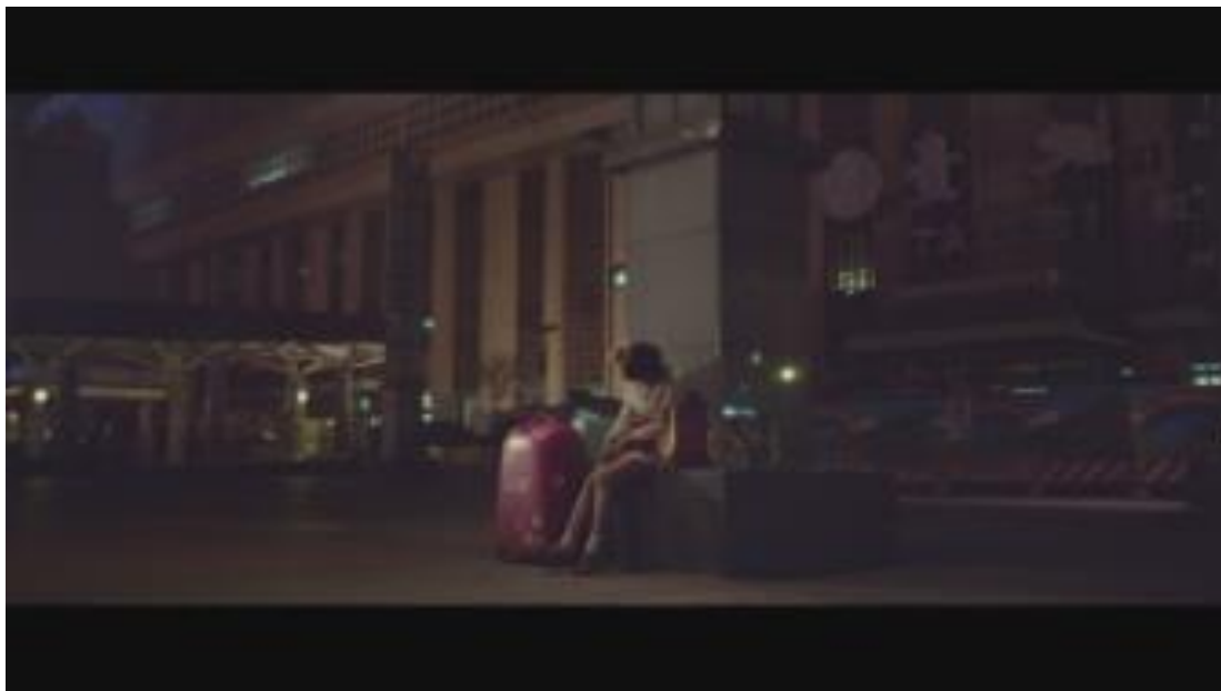
Image 34. Protagoniste qui attend le train pour rentrer dans sa ville natale (Film Zone Pro Site )

Dans cette situation, la mobilité associée aux gares donne lieu à une nouvelle métaphore.