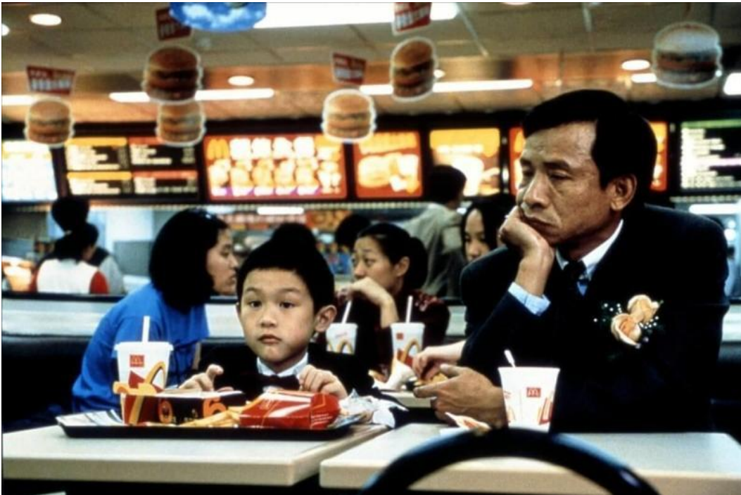
Image 5. Le héros a amené son fils manger au McDonald's après le chaos de la cérémonie du mariage de son beau-frère (Film Yi Yi d'Edward Yang) 199