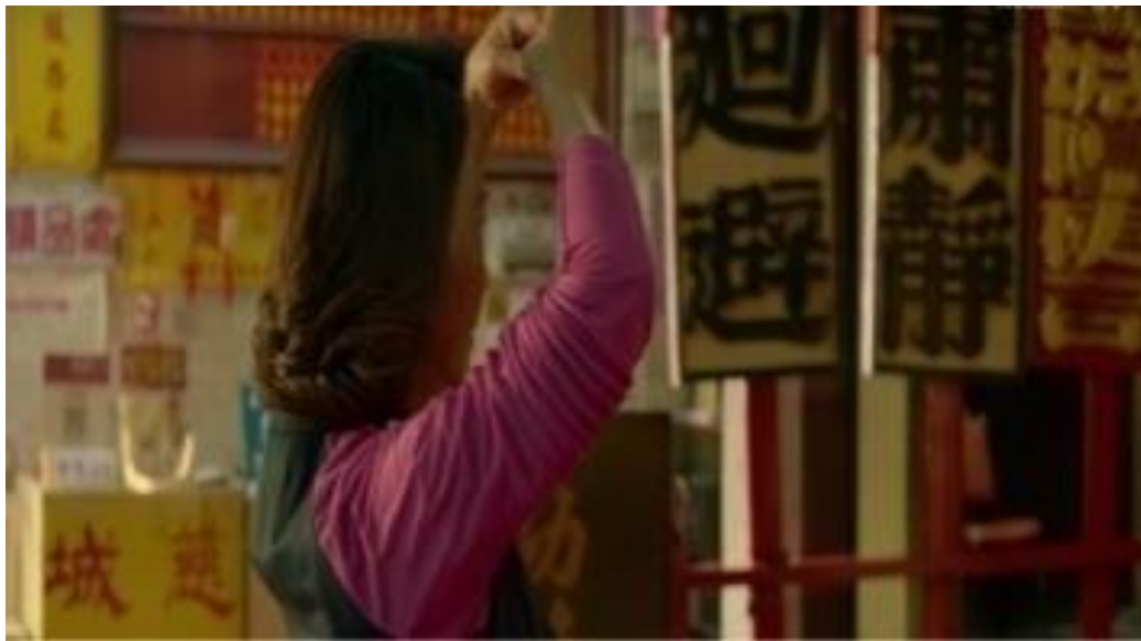
Image 15. Femme du protagoniste priant pour son mari (Film Father to Son )

En fait, ces quatre films mentionnés ont été subventionnés par les trois collectivités territoriales de Taïwan : Taïchung, Taïnan et Taoyuan. De plus, ces quatre films racontent aussi des histoires totalement différentes. Alors que les histoires des films Din Tao : le Chef du Défilé et The Great Buddha+ sont fondées sur la culture et les événements organisés dans le temple, les deux autres films Zone Pro Site et Father to Son n'ont pas de lien direct avec les événements du temple. Cependant, les images des temples sont représentées dans ces quatre films, ce qui montre que les activités religieuses sont des expériences partagées par les Taïwanais, ainsi que les racines de la