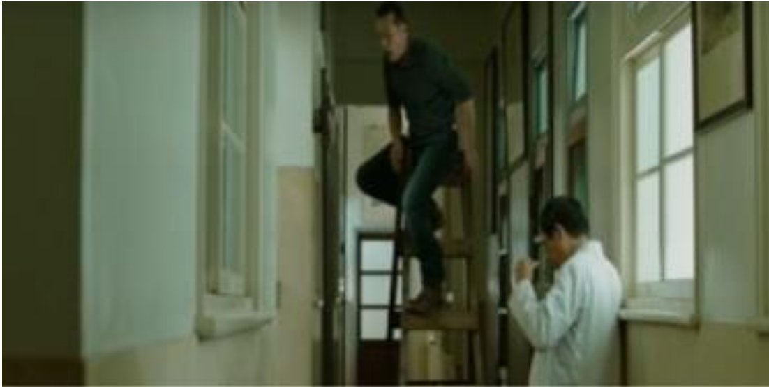
Image 23. Hôpital où le protagoniste se rend