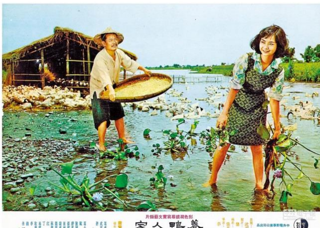
Image 3. L'affiche idyllique de Beautiful Duckling 191

Les principes de mise en image du réalisme sain consistaient à « dévoiler le côté lumineux dans la société » et à « promouvoir la qualité magnifique de l'humanité ». À partir du film Oyster Girl , les suivants commencèrent à être tournés en dehors des studios, dans les différentes localités, et à dépeindre des paysages ruraux et des villages de pêcheurs 190 , mais en projetant une vision idyllique. Dans Beautiful Duckling , par exemple, le réalisateur utilisa la peinture à l'aquarelle éponyme d'un peintre taïwanais, Ran In-ting 藍蔭鼎, en guise de scène d'ouverture, et fusionna ensuite ce tableau dans un paysage réel pour introduire les protagonistes. Avec cette combinaison de formes d'art, dans ces films, les paysages de la campagne sont devenus plus poétiques qu'auparavant et ont construit la métaphore d'une vie ataraxique à la campagne.