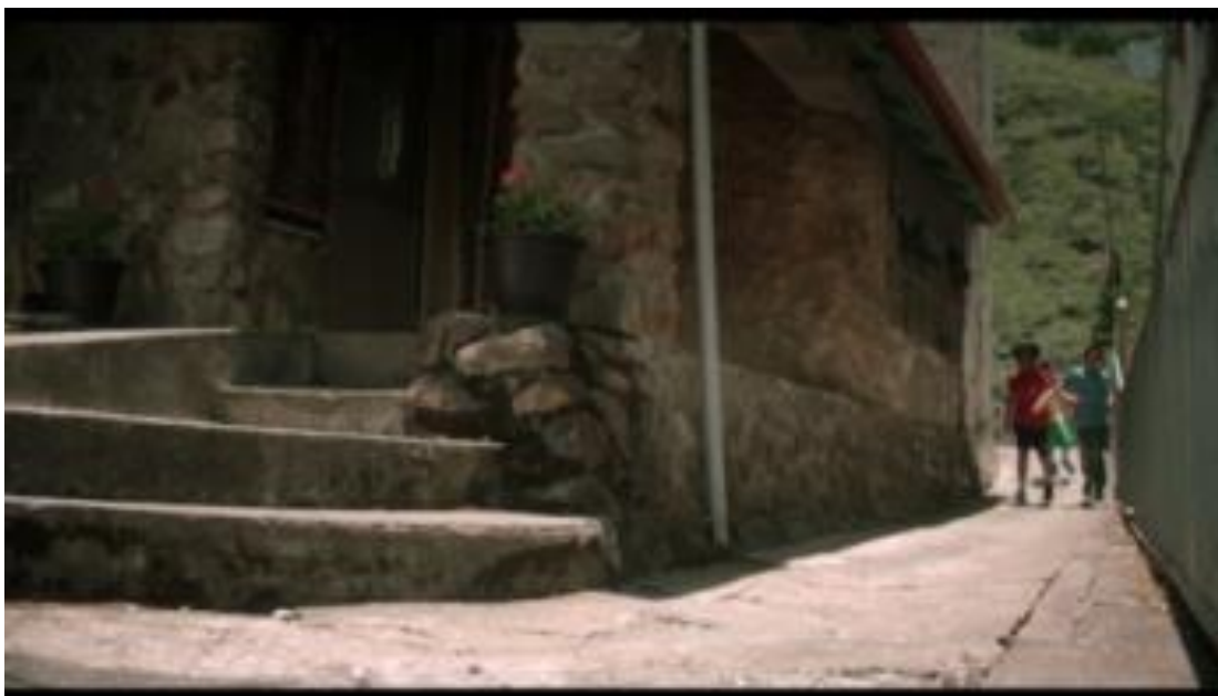
Image 21. Maison en pierre et topographie montagnarde (Film Lokah Laqi )

Dans ces scènes, les images présentent non seulement le genre de vie des aborigènes qui diverge de celui de la précédente ethnologie, mais elles dévoilent aussi la potentielle pauvreté dont