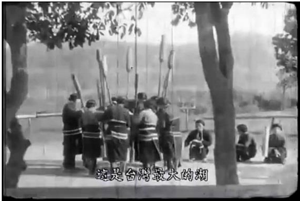
Image 2. La représentation des aborigènes dans le documentaire Southward Expansion to Taiwan

Du fait de la hiérarchie entre colons et sujets, les Japonais contrôlaient toute l'industrie du cinéma à Taïwan. Même si certains Taïwanais eurent l'occasion, à partir des années 1930, de suivre des formations dans le domaine du cinéma, de la photographie ou des arts dramatiques au sein d'écoles de la métropole 182 , ils furent toutefois exclus de toute décision liée à la production cinématographique. En général, Taïwan ou les Taïwanais n'étaient que des objets représentés de manière passive, telles des bêtes curieuses, par les Japonais. Sous ce type de regard qui était celui du colonisateur, les caractéristiques matérielles de Taïwan n'étaient évidemment qu'indiquées dans ces images : ressource alimentaire, minière et productive, et force de travail (Image 2).