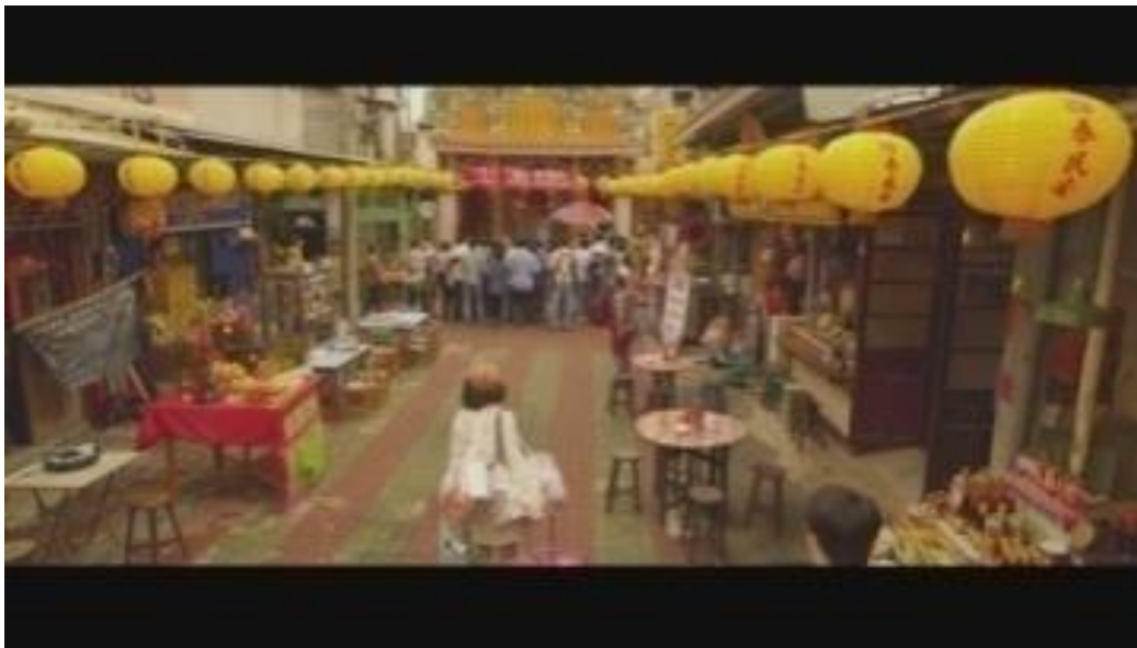
Image 11. Les traiteurs à côté du temple de Matsu (Film Zone Pro Site)

Quant au film Father to Son (2018), son héros est un homme âgé de 60 ans. Après être tombé très malade, il a refusé tous les traitements médicaux. Accompagné de son fils, cet homme de 60 a entamé un voyage au Japon pour avoir des nouvelles de son père qui l'avait abandonné 50 ans plus tôt. Sur l'image 15, nous voyons une femme en train de prier dans le temple. Il s'agit de la femme du héros du film qui prie pour que la santé de son mari s'améliore.