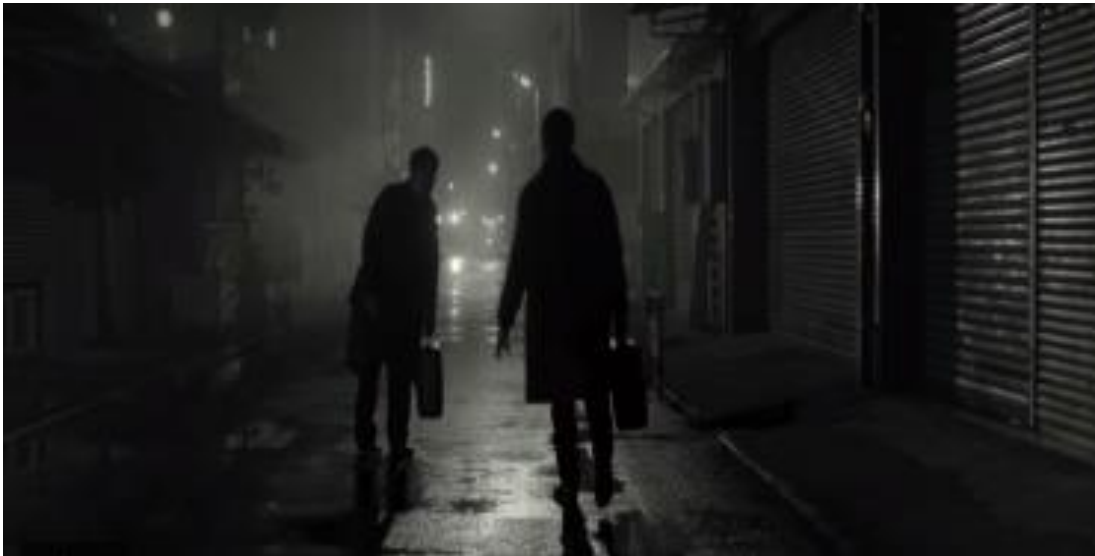
Image 22. Rideaux de fer des bâtiments à droite

Quant au film Father to Son , il insiste sur le genre de vie mené au sud de Taïwan, et se met également sur les traces du passé. Par exemple, en raison de la forme que revêtent les quartiers résidentiels classiques, mêlant zones d'habitation et commerces dans les villes du sud, la plupart des entrées des bâtiments sont fermées par des rideaux de fer (voir l'image 22). Par ailleurs, les principaux espaces dans ce film, donc l'hôtel et l'hôpital, affichent des styles architecturaux datés. Dans l'hôpital où le protagoniste se rend afin d'y réparer des tuyaux (voir l'image 23), l'agencement architectural et les portes en bois ont conservé l'ancien style japonais. De même, l'hôtel que possède l'ancienne maîtresse du protagoniste, est demeuré dans le style des années 1980 et n'a pas été affecté par la modernisation (images 24 et 25) .