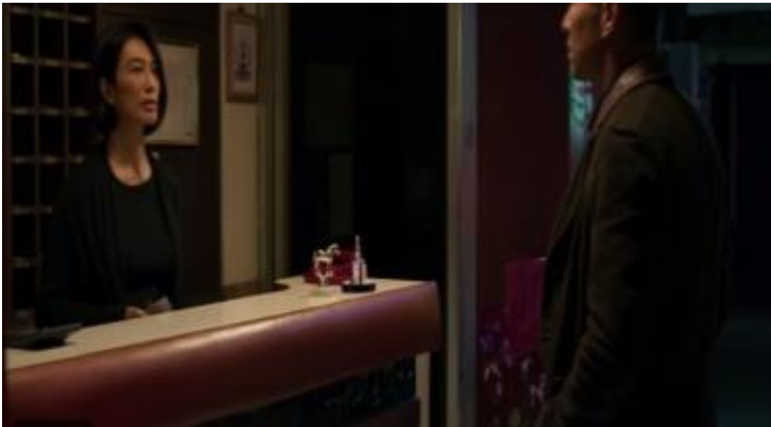
Image 24. Apparence de l'hôtel en 2018