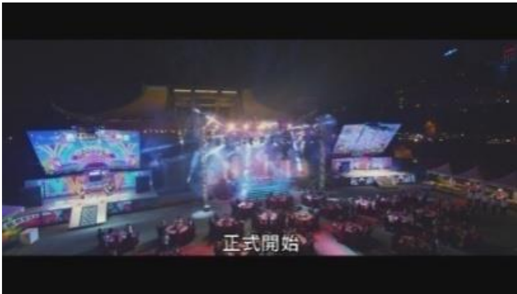
Image 17. Buffet en plein air au Mémorial Chiang Kai-shek (Film Zone Pro Site )

S'agissant de films appartenant au genre de la comédie, afin de mettre en valeur combien les plats du buffet sont délicieux et le professionnalisme des « zone pro site », l'équipe du film Zone Pro Site a utilisé des effets spéciaux, des lumières et les acteurs se sont adonnés à des performances exagérées pour rendre les plats encore plus magnifiques et la cuisine des chefs excellente. Cependant, toute l'importance de ce film réside dans le sujet qu'il aborde, parce qu'auparavant, ce métier n'avait jamais été traité en tant que récit principal dans les films taïwanais.