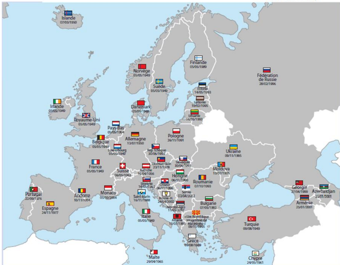
Carte des Etats membres et dates d'adhésion au Conseil de l'Europe