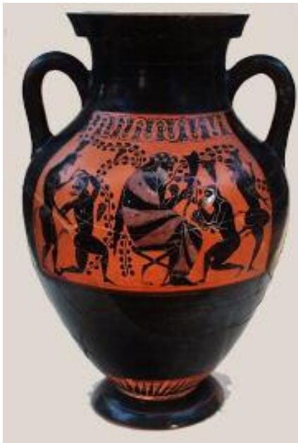
Figure 2 : Amphore attribuée au peintre du cercle de Bateman ; VI e siècle av. J.-C., Musée d'Ashmolean, Oxford ( LIMC 3.I, 326).