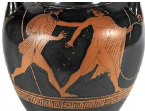
Figure 7 : Amphore du peintre de Briseis, vers -500 - -450 av. J.-C., Cambridge, Fitzwilliam Musée, ( LIMC , 4.I., 25).