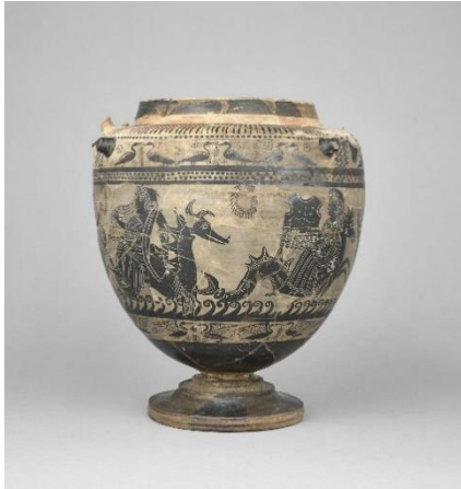
Figure 11 : Lébès gamikos attribuée au peintre de Thétis, IV e siècle av. J.-C., Musée du Louvre, Paris ( LIMC , 6, II., 339).