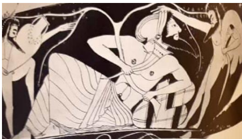
Figure 3 : Canthare du peintre de Nicosthénès ; vers 500 av. J.-C., Musée des Beaux-Arts de Boston, Boston ( LIMC 3.I, 363).