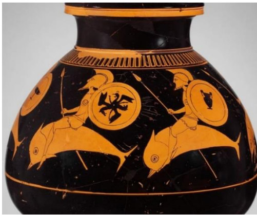
Figure 12 : Psykter archaïque à figures rouges attribuée au peintre d'Oltos ; fin du VI e siècle av. J.-C., Metropolitan Museum of Art (MET), New York (chez Weiss 2020, p. 167).