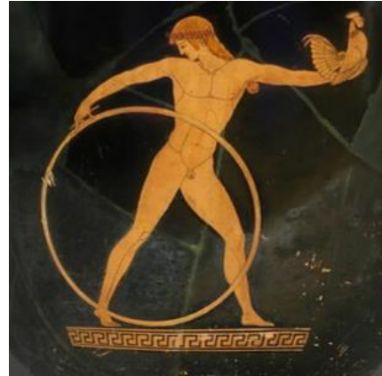
Figure 6 : Cratère à figures rouges du peintre de Berlin, vers -500 - -490 av. J.-C., Musée du Louvre, Paris ( LIMC 4.I, 12).