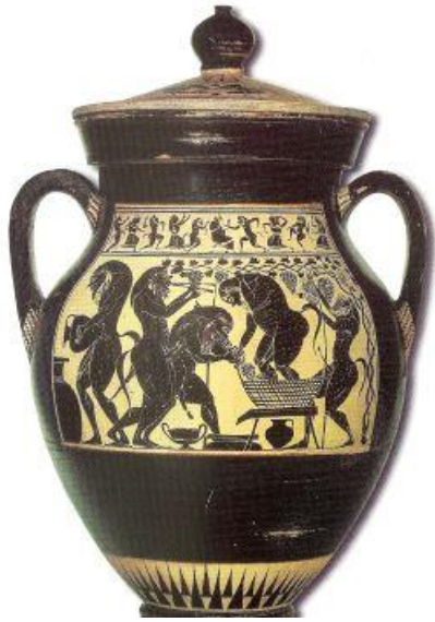
Figure 4 : Amphore attribuée au peintre d'Amasis, vers 530 av. J.-C., Musée de l'Université de Würzburg, Würzburg ( LIMC 8.I, 38).