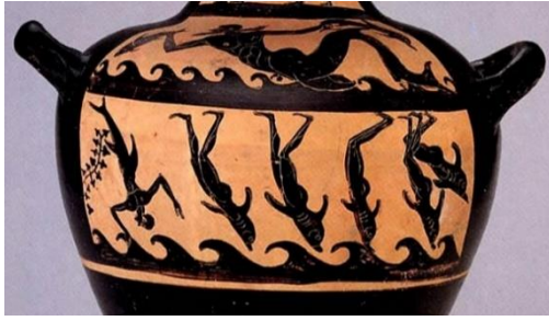
Figure 14 : Kalpis étrusque à figures noires attribué au peintre de Vatican ; fin du VI e siècle av. J.-C., Musée d'Art de Toledo (chez Csapo 2003, p. 83).