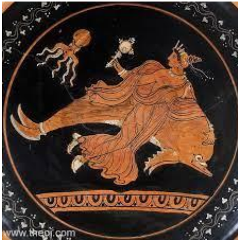
Figure 9 : Assiette Apulien à figures rouges ; inconnu artiste, IV e siècle av. J.-C., Musée de l'Ermitage, Saint-Petersbourg ( LIMC , 6, II., 28a).