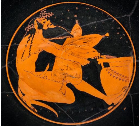
Figure 8 : médaillon d'une coupe attribuée au peintre d'Epeleios, vers 500 av. J.-C., Musée Antikensammlungen, Munich (chez Lissarrague 2013, p. 144).