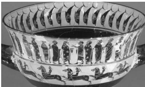
Figure 13 : Cratère attique à figures noires attribuée au peintre inconnu ; milieu du VI e siècle av. J.-C., Musée du Louvre, Paris (chez Csapo 2003, p. 79).