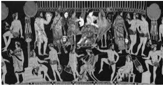
Figure 1 : Cratère attique à figures rouges attribué au peintre de Pronomos ; vers 400 av. J.-C., Musée archéologique national, Naples (chez Csapo 2010, p. 18 ; chez Hunter & Laemmlé 2020, p. 28).