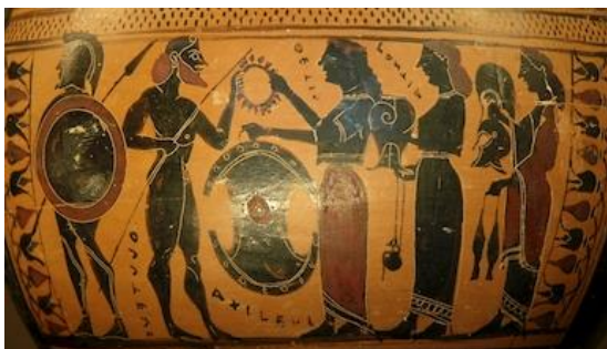
Figure 10 : Hydrie attique à figures noires attribuée au peintre des Tyrrhéniens, milieu du VI e siècle av. J.-C., Musée du Louvre, Paris ( LIMC , 1, II., 200).