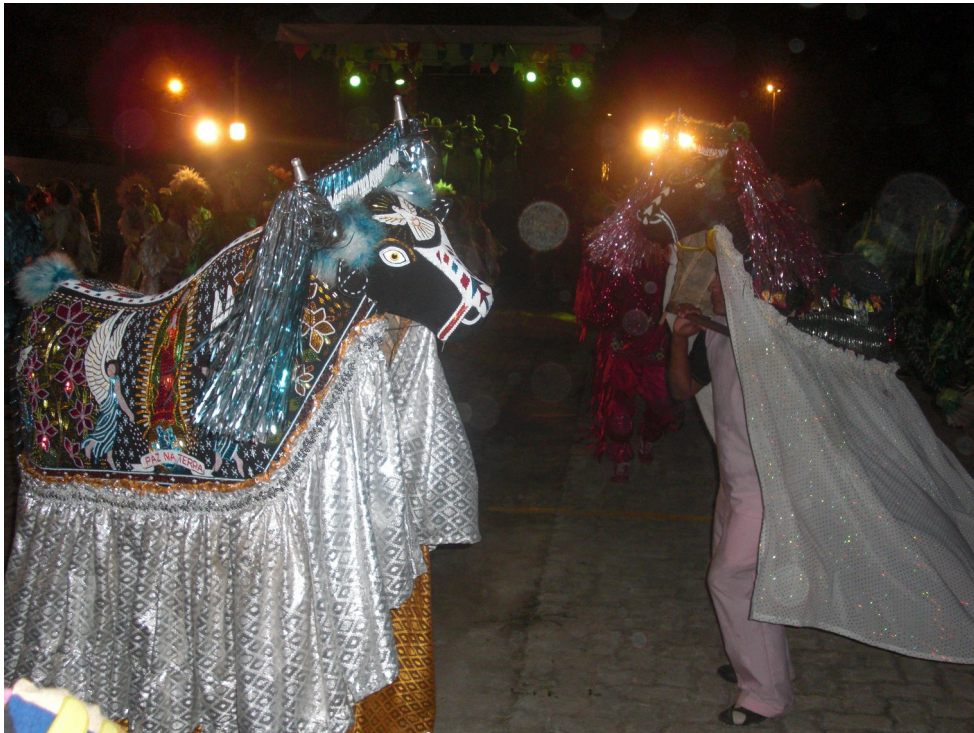
Figure 6: Bumba meu boi do Maranhão