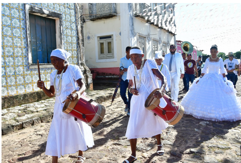
Figure 7: Caixeiros do Divino

donner comme exemple la fameuse légende A carruagem de Donana Jansen , dont nous parlerons plus loin. Celle-ci est le fruit de l’imaginaire populaire mais qui trouve son origine dans l’histoire d’une femme propriétaire d’esclaves au dix-neuvième siècle. Cette idée s’applique aussi à des faits historiques et à certains personnages comme nous le verrons au cours des prochains chapitres.