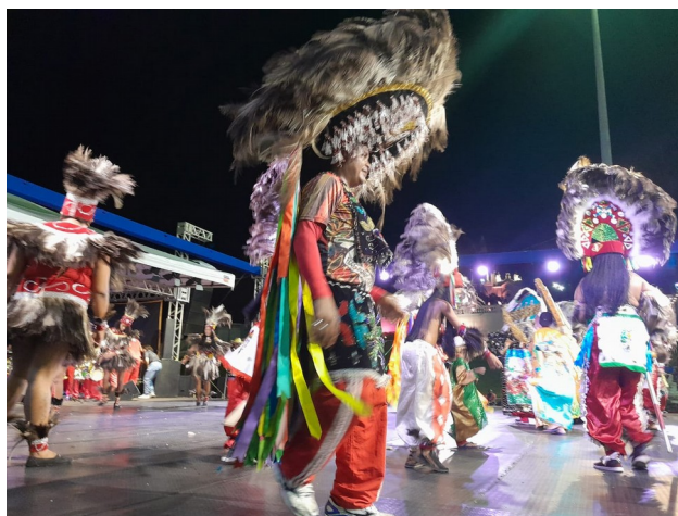
Figure 9: Caboclo de pena du bumba-meu-boi