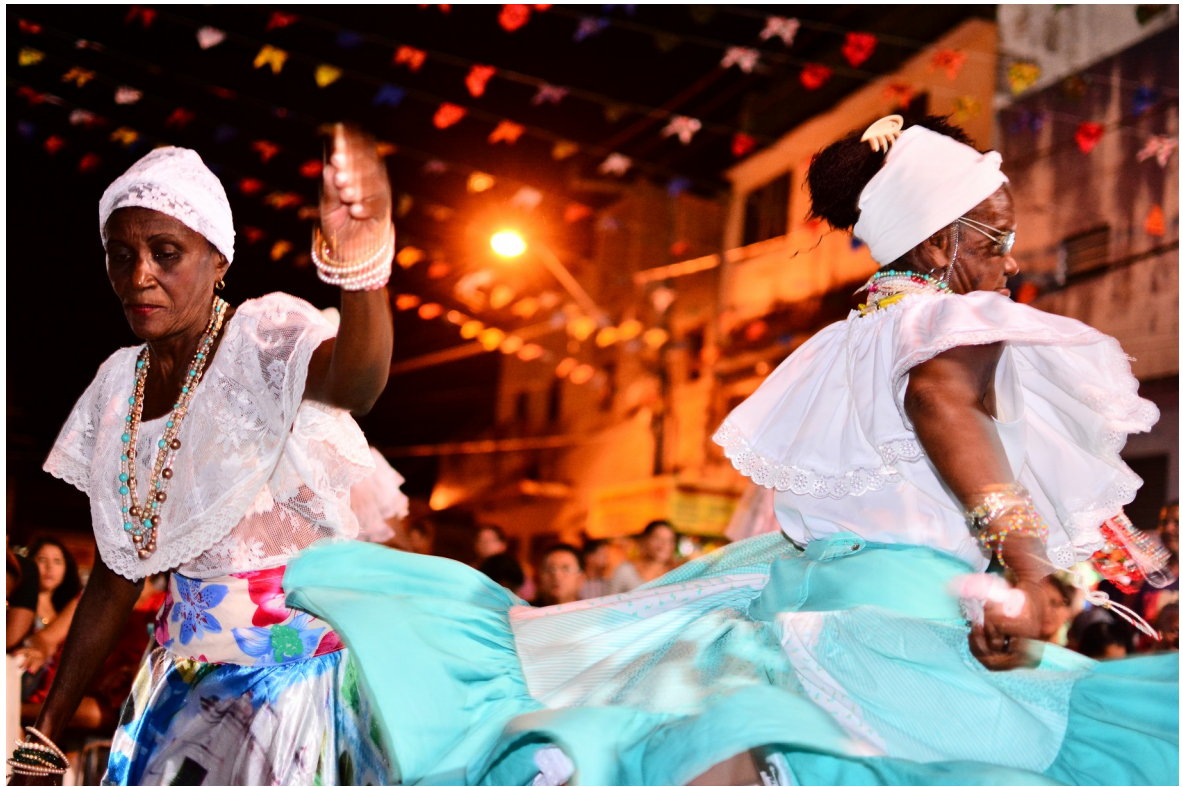
Figure 2: Tambor de Crioula - Sao Luis