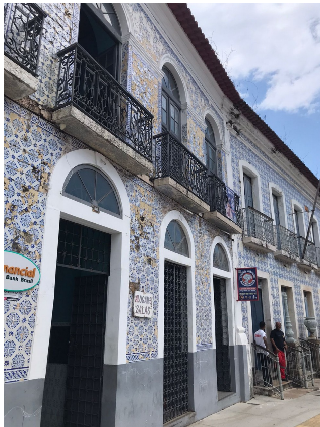
Figure 5: Casarões de azulejo/São Luís

comme un corpus dynamique et jamais fixe dans lequel les images élaborées et partagées par certains groupes sociaux sont inscrites, et englobant le virtuel et le réel, le vécu et le rêve, le désiré et le craint, le cauchemar et le rêve, l'expérience et l'imagination.