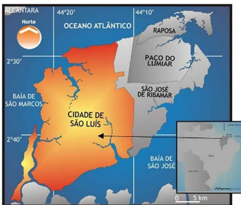
Figure 4: Localisation de la ville de São Luis

Néanmoins, ce n'est qu'après le Modernisme que nous aurons dans le roman brésilien et dans la littérature en général, une production brésilienne qui dépasse la thématique de l'Amérindien et de la nature, avec un intérêt pour les vrais problèmes du pays, car il fallait maintenant chercher dans les régions que les regards n'ont pas encore atteintes. Vu que ce héros national faisait partie du passé, comme le chevalier médiéval d'Alexandre Herculano, l'idéal a donné lieu à la réalité, celui qui pouvait représenter le vrai brésilien dans la littérature était encore en passe d'être découvert dans les plantations de café, perdu dans les champs ou encore derrière un balcon d'un petit commerce.