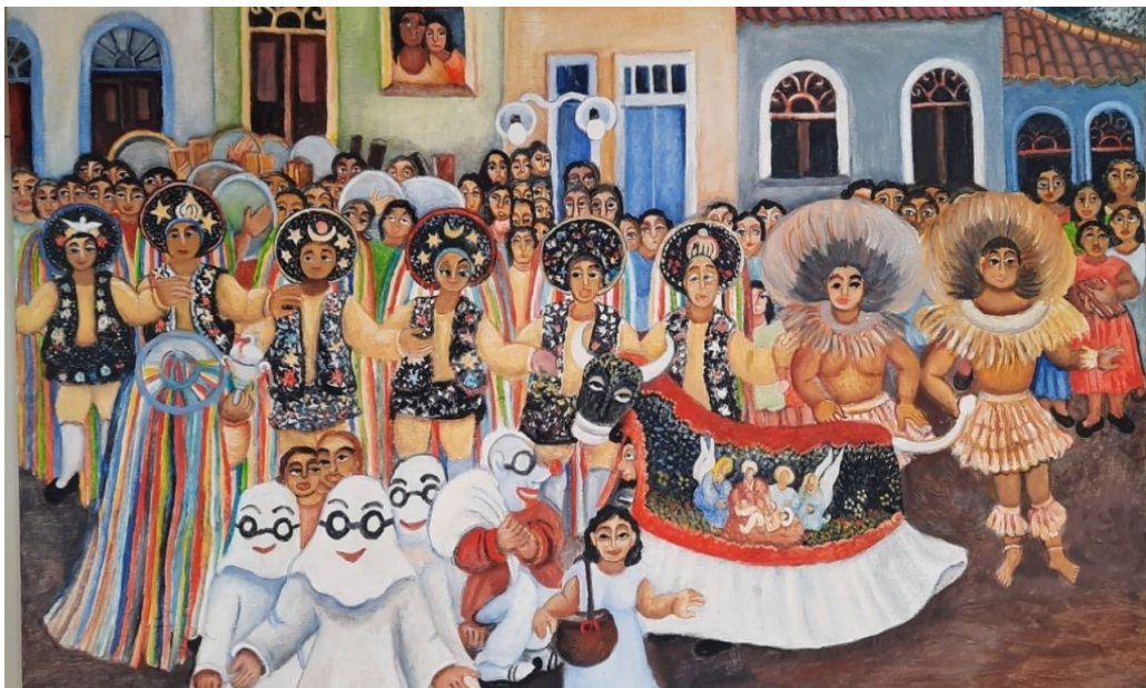
Figure 1: Bumba meu boi - peinture acrylique - Dila Rodrigues