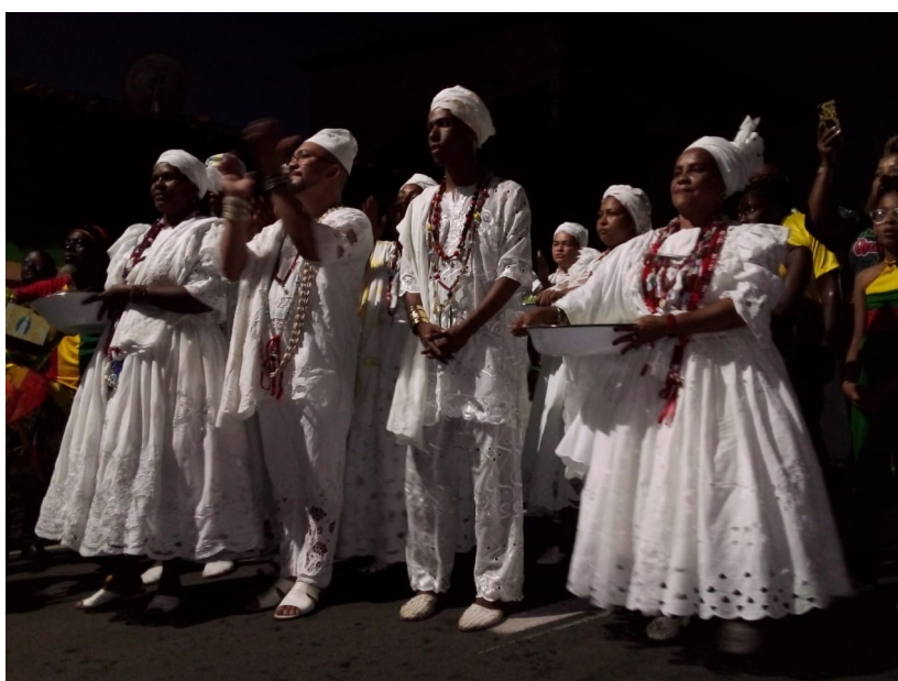
Figure 8: Membres du tambor de Minas