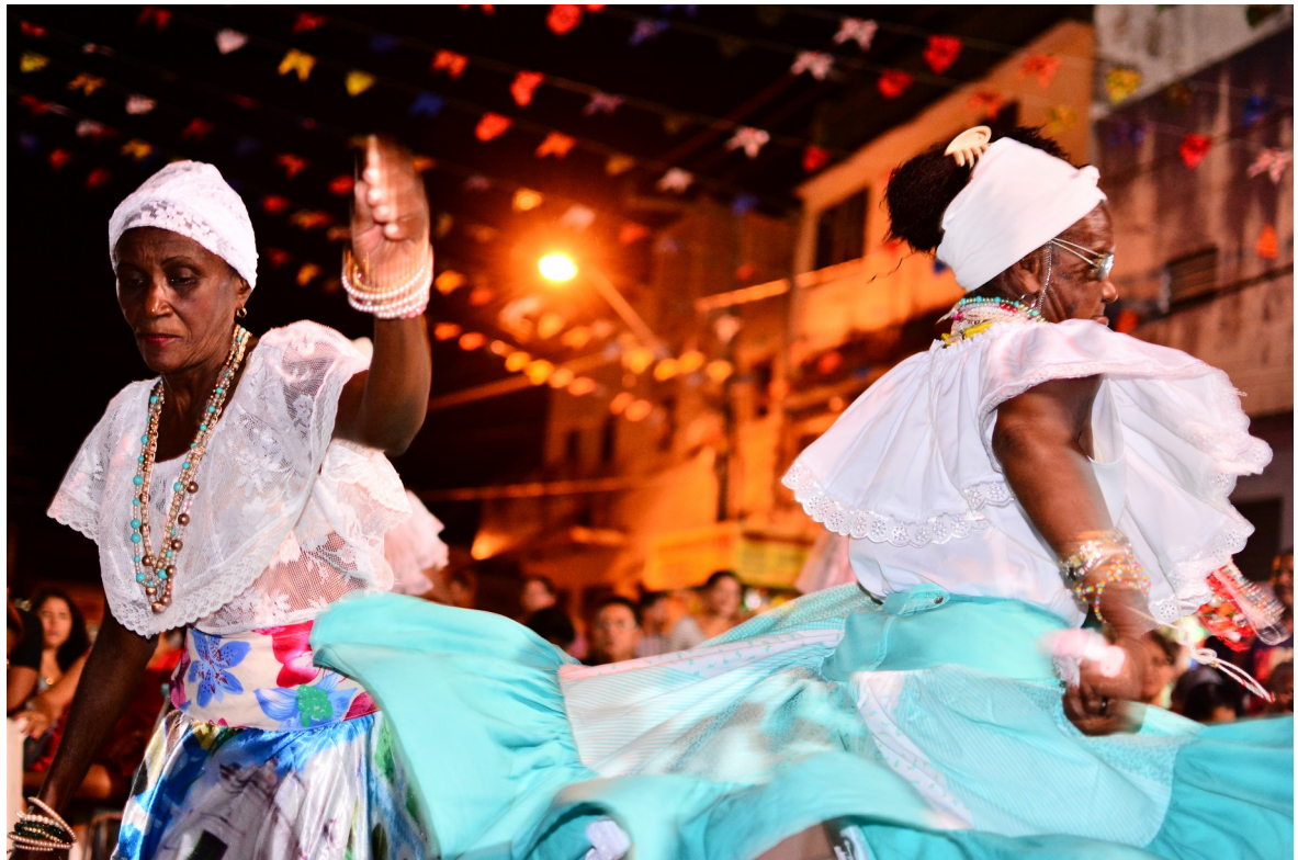
Figure 2: Tambor de Crioula - Sao Luis