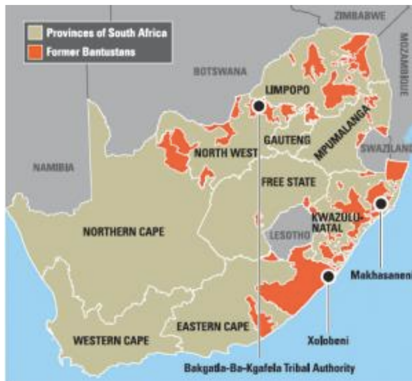
Carte représentant les anciens homelands / bantoustans , constituant aujourd'hui les communal lands – source : N. Branson, « Land, Law and Traditional Leadership in South Africa », Africa Research Institute , Note d'information Juin 2016

question. Ces trois éléments rendent particulièrement épineux et complexe la réforme du régime foncier dans ces territoires communautaires.