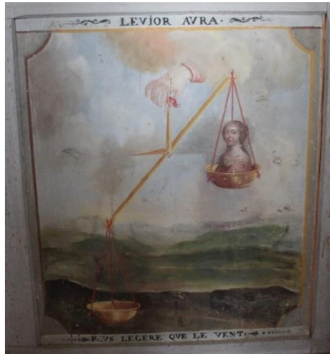
Plus légère que le vent 167