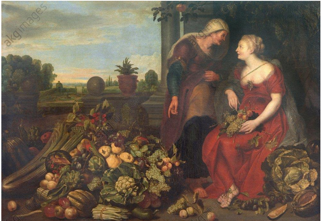
Vertumne et Pomone 89