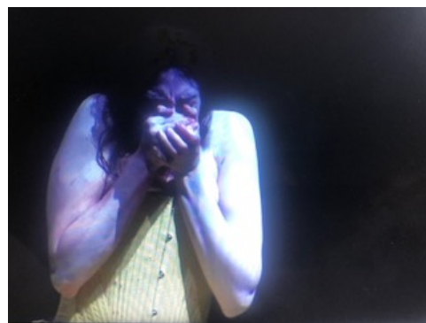
Illustration 16: Schauspiel Frankfurt : Penthesilée et l'oiseau.