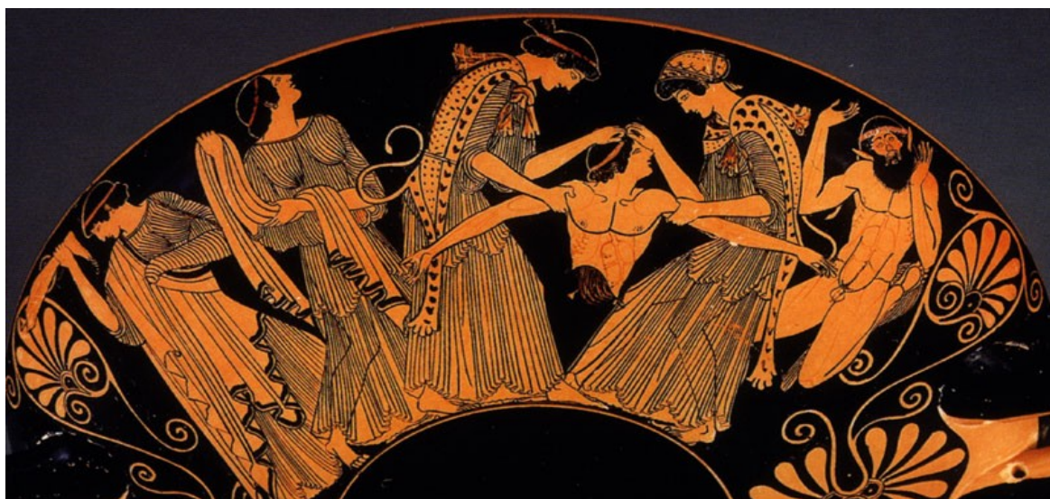
Illustration 7: Penthée lacéré par les Bacchantes. Amphore attique vers 480 avant J.C. Kimbell Art Museum, Fort Wort.