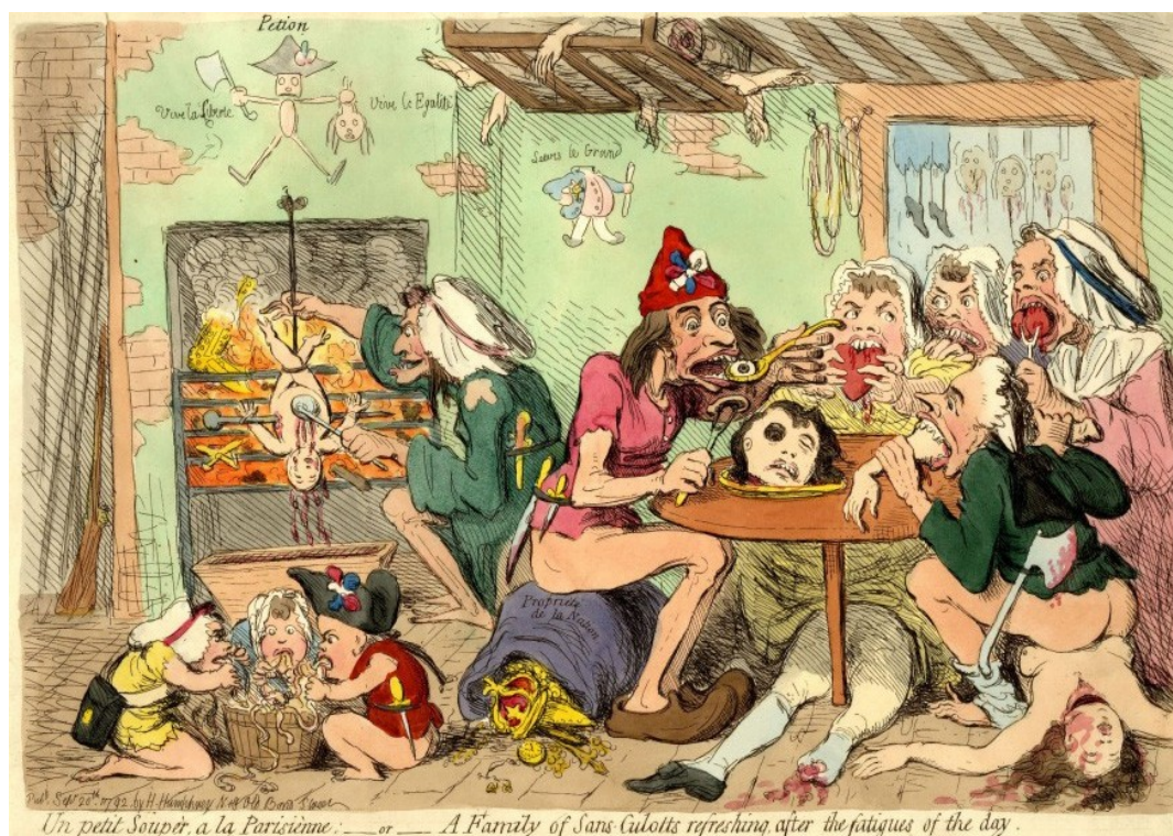
Illustration 8: James Gillray, « Un petit souper », 20 septembre 1792.