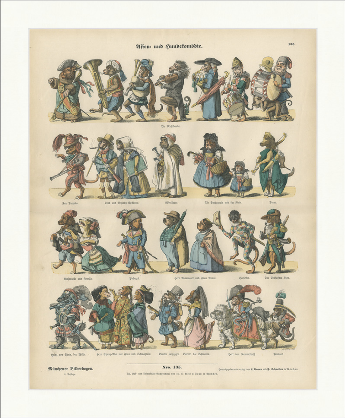
Illustration 13: Münchener Bilderbogen, 1848.