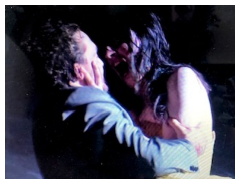
Illustration 18: Schauspiel Frankfurt : Penthesilée dévore Achille.