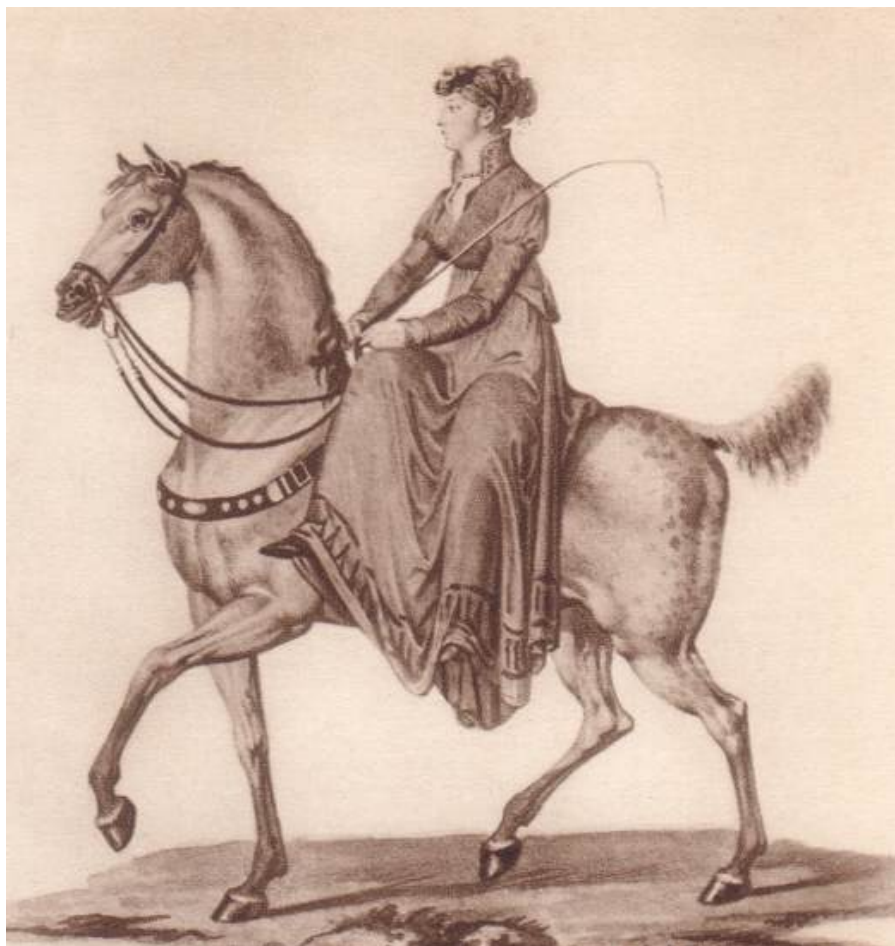
Illustration 6: « Luise zu Pferde », 1806.