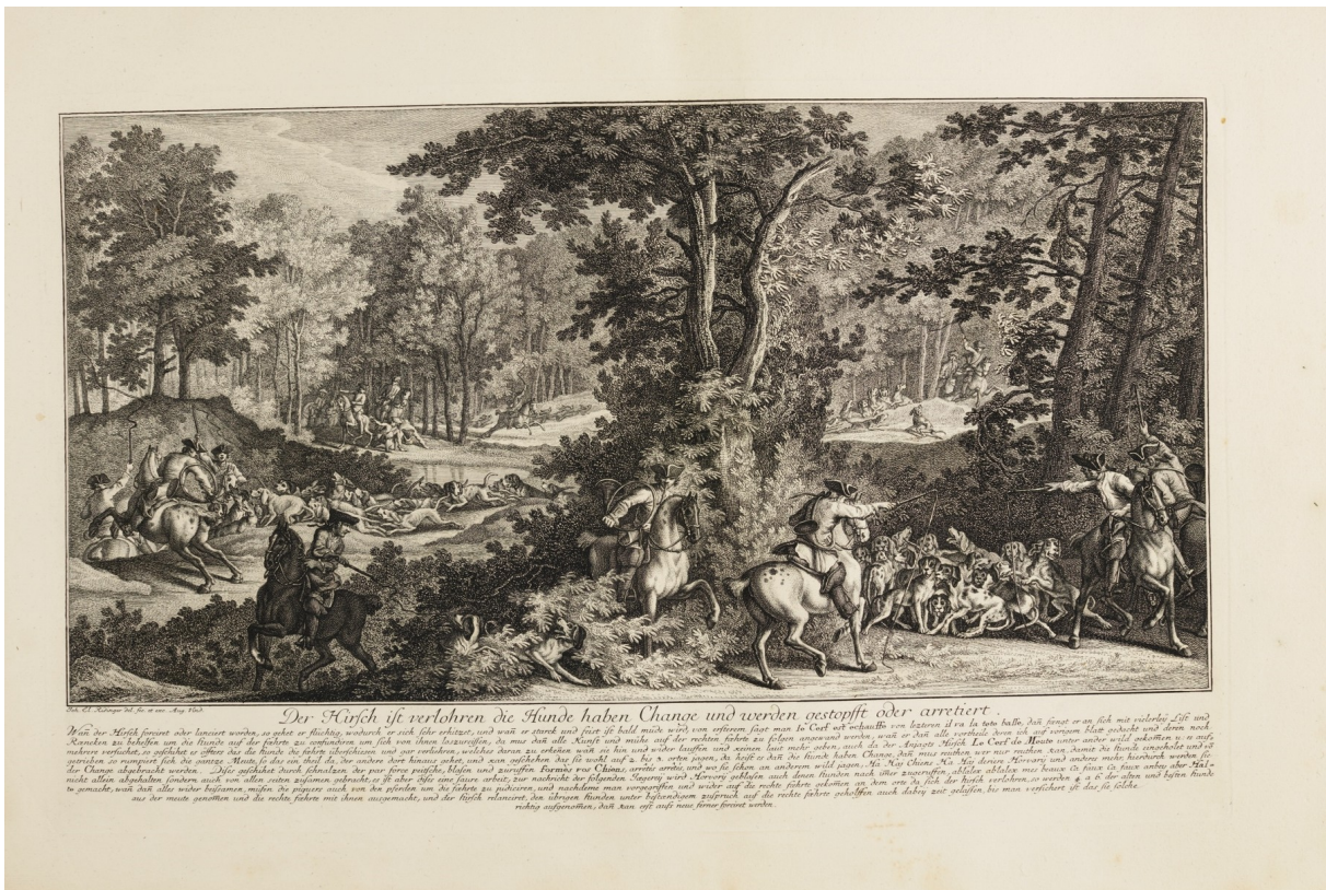
Illustration 9: Die par force Jagd des Hirschen, Augsburg, Johann Elias Ridinger, vers 1756.

Dans cette première partie, nous avons étudié du point de vue des études animales quatre discours anthropologiques qui sont des thématiques clés du « moment 1800 » concernant l'animal et l'animalité : le sujet, l'Amazone, le cannibale et la chasse. Chacun de ces discours se nourrit d'éléments qui permettent d'alimenter et de saisir ce qu'on comprend à l'époque par l'animal et l'animalité, mais aussi de comprendre comment se redéfinit la frontière entre être humain et animal. L'analyse de ces discours anthropologiques nous a permis de brosser un tableau général que nous allons maintenant illustrer avec un cas concret issu du théâtre : la tragédie Penthesilée de Heinrich von Kleist, symptomatique du « moment 1800 ».