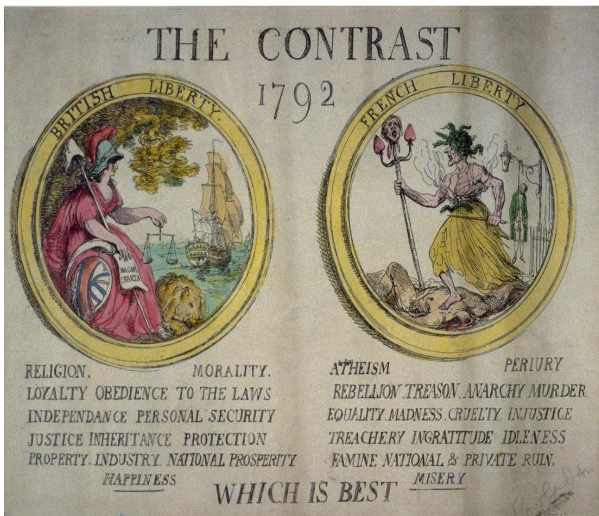
Illustration 5: Thomas Rowlandson, « The Contrast, 1792 », Bibliothèque nationale de France.