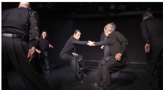
Illustration 19: Theater Aachen - combat entre Penthésilée et Achille.