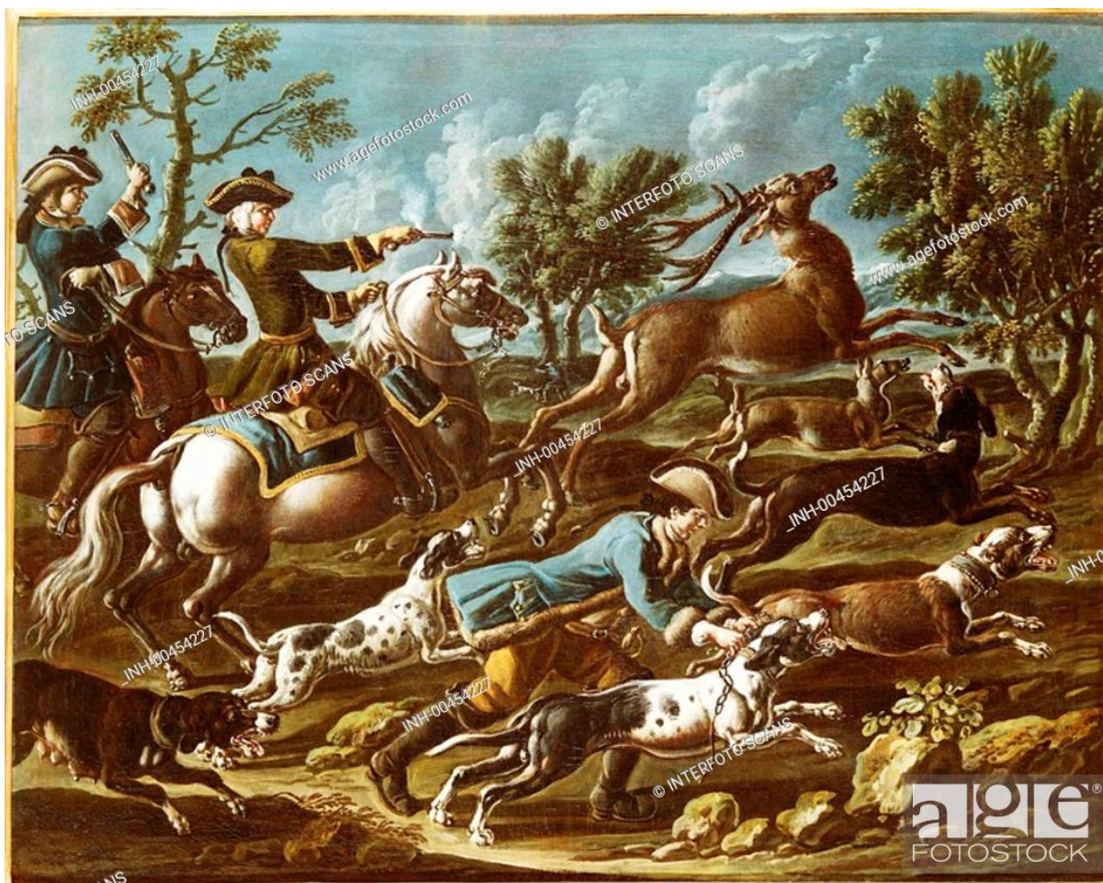
Illustration 10: Hirschjagd, Jäger zu Pferd mit Pistolen, Musée de la chasse et de la pêche, Munich.