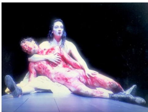
Illustration 14: Schauspiel Frankfurt : première scène.