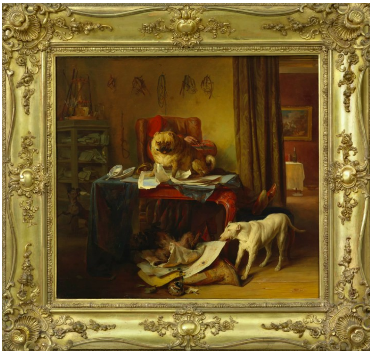
Illustration 12: « Die Hundekomödie », Josef Danhauser (1841), Wien Museum.