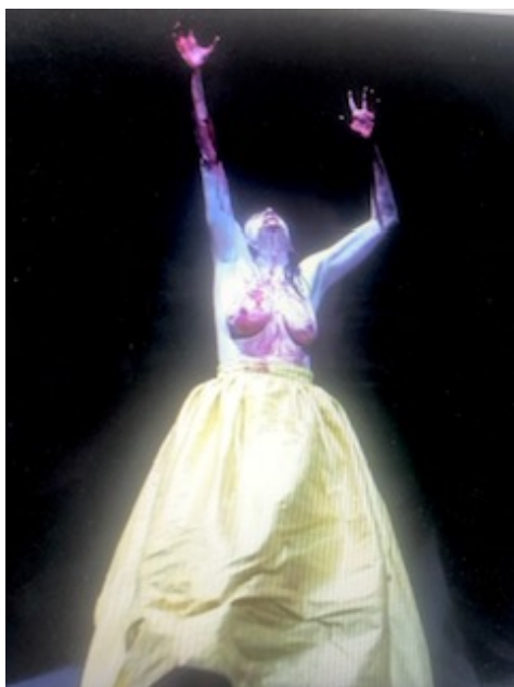
Illustration 17: Schauspiel Frankfurt : Penthesilée comme hystérique.