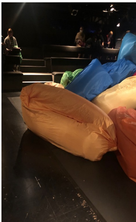
Illustration 21: Theater Aachen - décor et éléments scéniques.