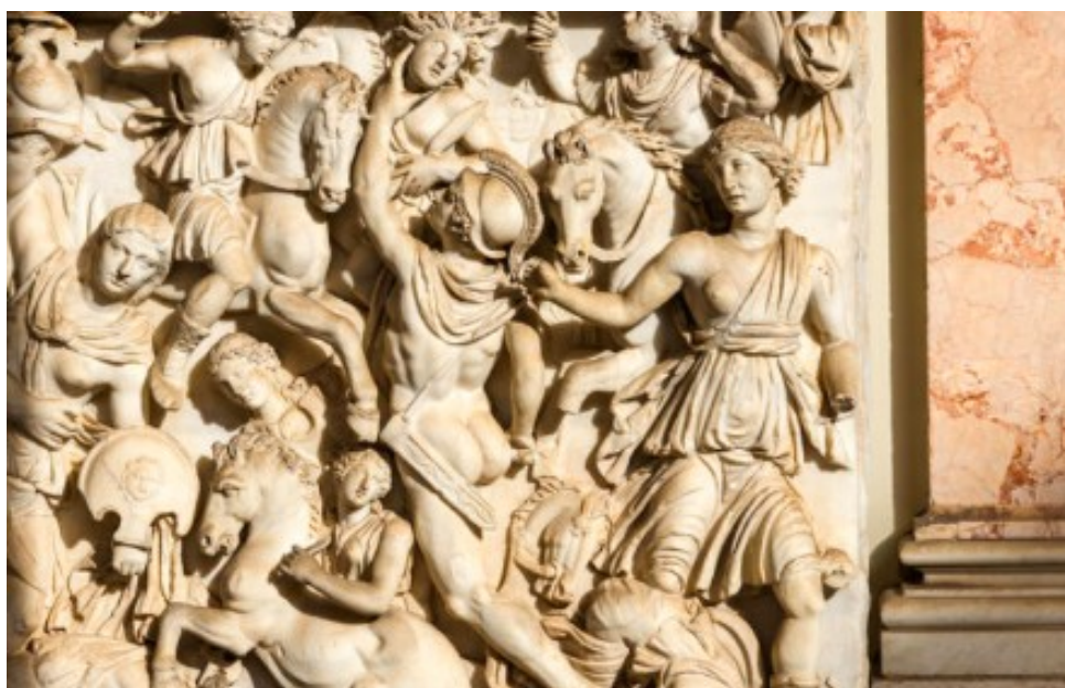
Illustration 2 : Sarcophage avec Achille et Penthésilée

l’animal et l’être humain, permettant de souligner à quel point le sujet est, autour de 1800, une construction fragile. Car ce que met en lumière la réflexion sur les notions d’animal et d’animalité par rapport à ces discours sur le sujet, c’est que l’animal est plus rarement défini par ce qu’il est que par ce qu’il n’est pas. Toute tentative de questionner l’animal en le comparant à l’être humain conduit à des démarches anthropocentriques ou anthropomorphiques, et derrière toute réflexion autour de l’animal-sujet, c’est en réalité la question du sujet humain qui est soulevée. Dans les années 1800, le cas de la femme apparaît comme un cas particulier et contradictoire, au carrefour des trois fils rouges précédemment évoqués.