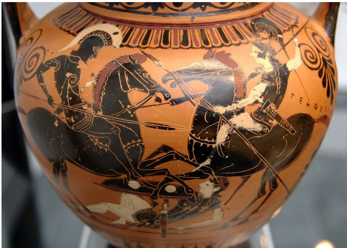
Illustration 3: Achille et Penthésilée. Face A d'une amphore à col attique à figures noires, v. 520 av. J.-C. Provenance : Vulci.

mais ces catégories semblent inconciliables. L'Amazone des classiques n'a rien d'un animal et représente surtout un idéal de vertu et d'harmonie. C'est plutôt dans l'héritage de Shakespeare, qui est à la mode lors du « moment 1800 » et met en scène des Amazones bien plus animales qu'à Weimar, que l'on retrouve tous les thèmes antiques avec lesquels ces guerrières sont traditionnellement associées, notamment celui du cannibalisme.