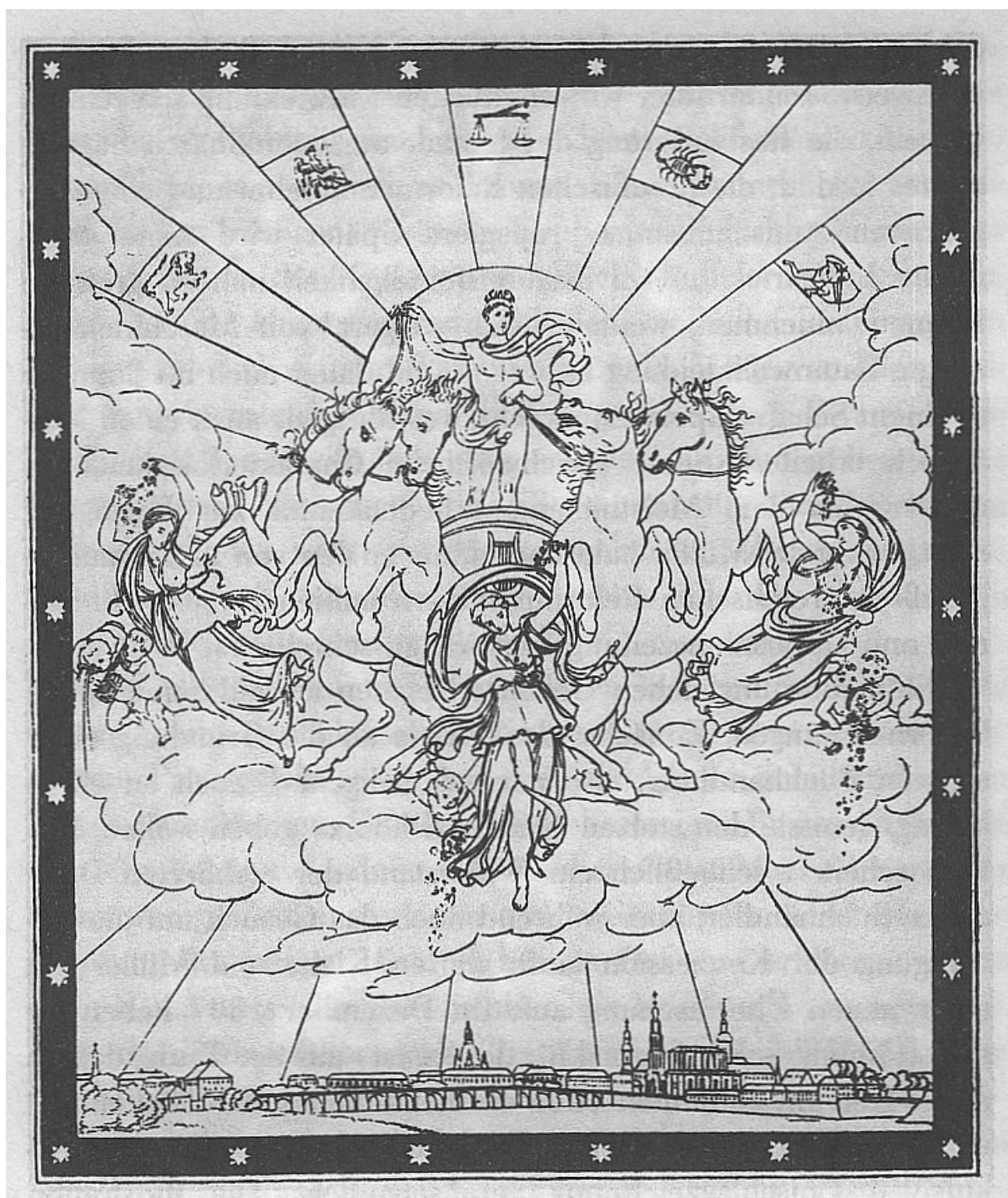
Illustration 11: Char de Phébus. Frontispice du Phöbus. Ferdinand Hartmann – Klaus Günzel: Kleist. Ein Lebensbild in Briefen und zeitgenössischen Berichten. Berlin 1984, p. 250