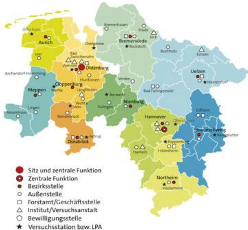
Figure 4-1 : Antennes de la chambre d'agriculture de Basse-Saxe 441

Source : Site de la chambre d'agriculture de Basse-Saxe.