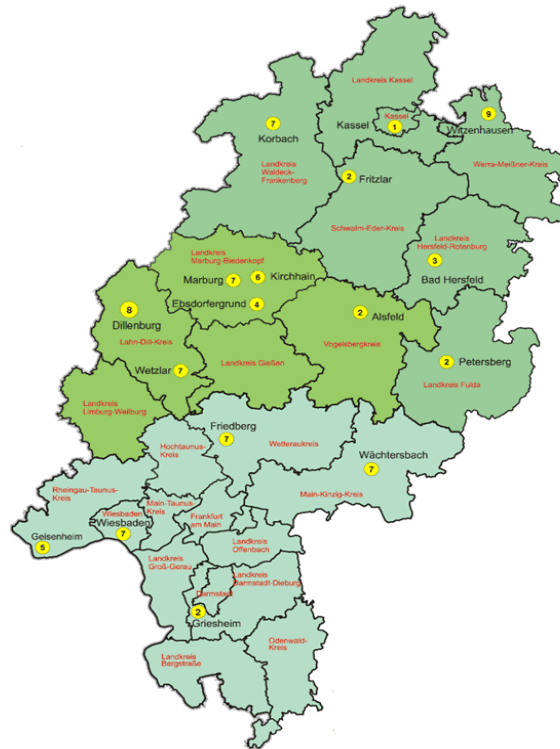
Figure 4-2 : Antennes de la LLH en Hesse 2017 500

déconcentrées. Au nombre de dix-sept, ils sont spécialisés par thématiques selon leur implantation géographique 499 (cf : carte ci-dessous).