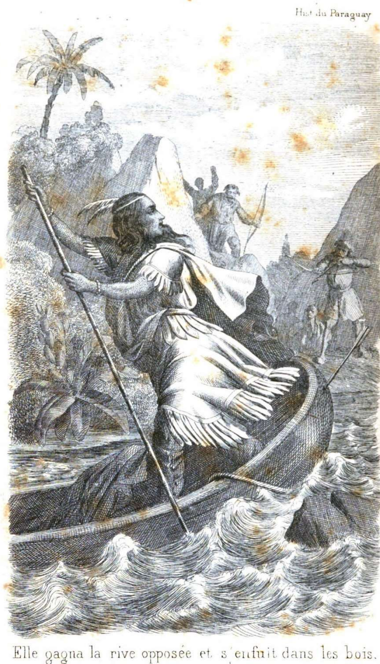
Figura 2 – “Ela alcançou a margem oposta e embrenhou-se na floresta”.