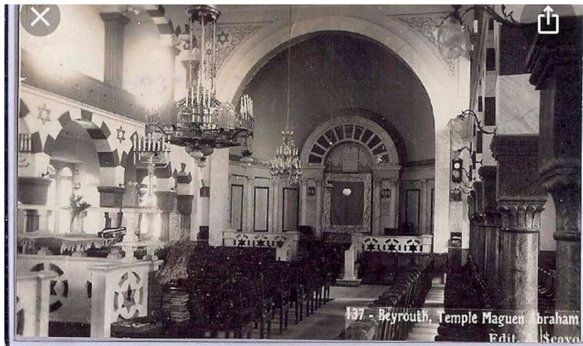
Image n° 3 : L'intérieure de la Grande Synagogue Maghen Avraham dans les années 1920

Les données démographiques montrent que la population juive de Beyrouth connut une forte expansion, passant de 3303 personnes en 1922 à 9981 personnes à la fin des années trente (Albert Hourani) 978 . Cependant, le profil des activités professionnelles exercées ne changea guère. Il demeurait essentiellement lié au commerce des textiles importés d'Italie et au développement du secteur bancaire, alors qu'un nombre très négligeable des Juifs libanais fit carrière au sein des services de l'État. Ainsi, deux représentants juifs furent employés au sein du conseil du vilayet de Beyrouth et un seul auprès de l'état-major libanais 979 . À l'exception de quelques riches familles d'entrepreneurs et de banquiers, telles celles des Zilkas et des Safras, l'immense majorité des membres de la communauté durant la période du mandat français n'accéda jamais à une classe sociale supérieure et continua à gagner sa vie dans le domaine des professions artisanales et commerciales 980 .