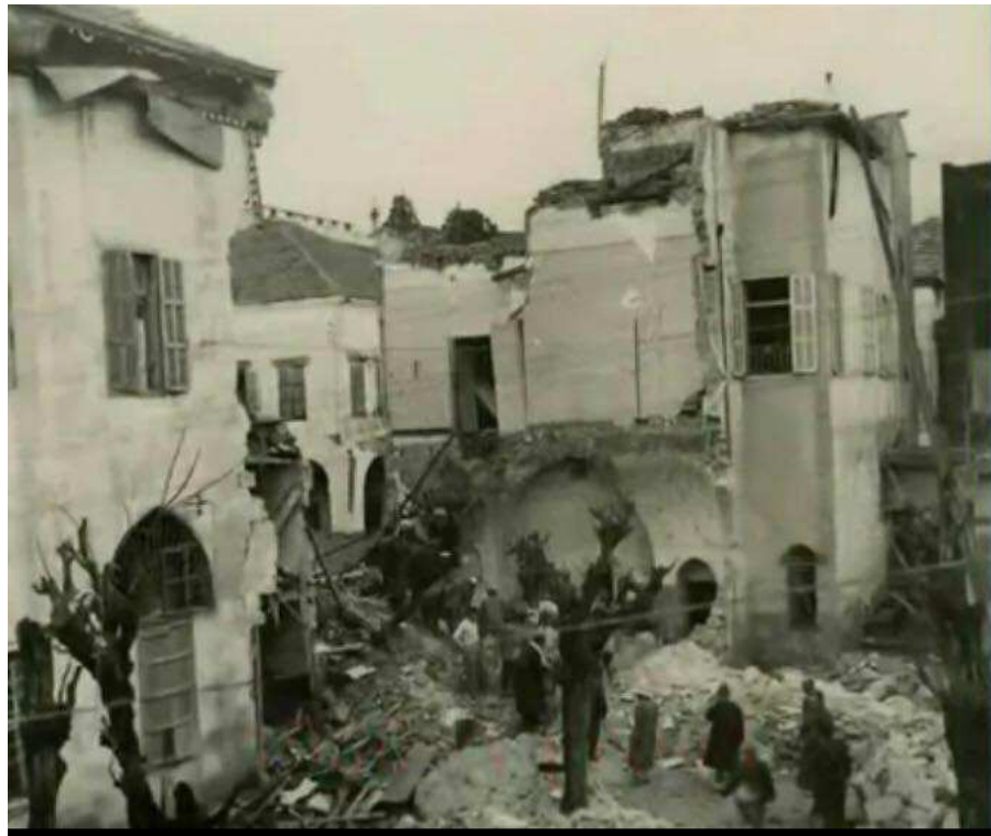
Image n° 10 : Les bâtiments de l'AIU de Beyrouth à la suite de l'attentat.

S'il put y avoir tout d'abord un doute sur les vraies raisons de l'effondrement du bâtiment, les premières constatations de l'enquête retrouvèrent les caractéristiques typiques d'une explosion grâce aux éraflures qui purent être constatées et aux éclats qui furent recueillis et éliminèrent toute autre explication telle que la foudre. En février 1950, le journal L'Orient cita les conclusions d'un expert militaire sur les origines de l'explosion :