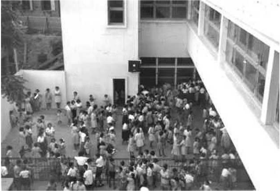
Image n° 15 : La cour de l'Alliance Israélite Universelle, années 1950, vue d'en haut, Archives privées de Yolla Politi (Grenoble).