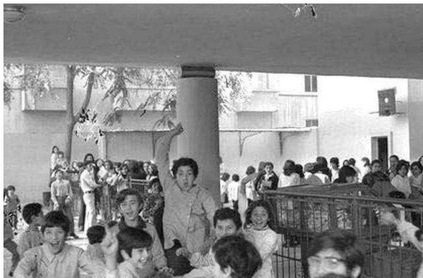
Image n° 18 : La cour de récréation de l'AIU à Beyrouth durant les années 1960 avec la barrière séparant la cour des garçons de la cour des filles