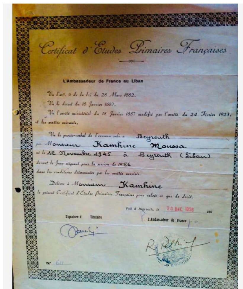
Image n° 11 : Copie de son Certificat d'Études Primaires Françaises à l'école de l'AIU à Beyrouth en 1956