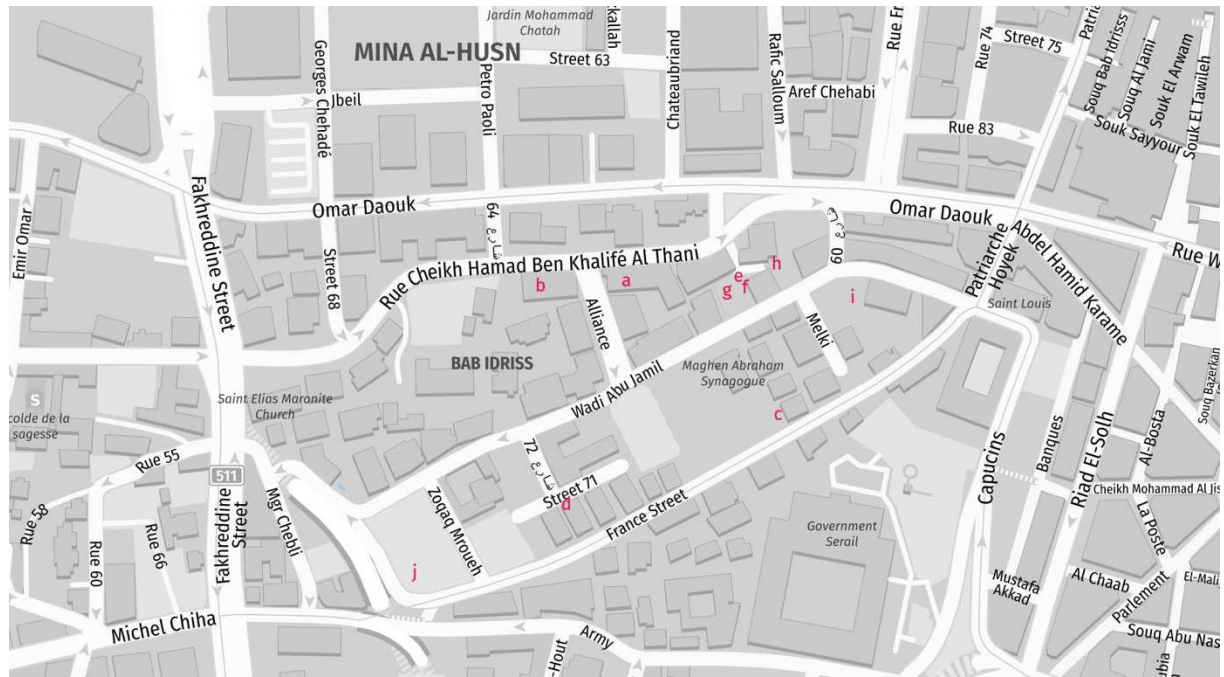
Carte n° 1 : Le quartier beyrouthin d'Abou Wadi Jamil