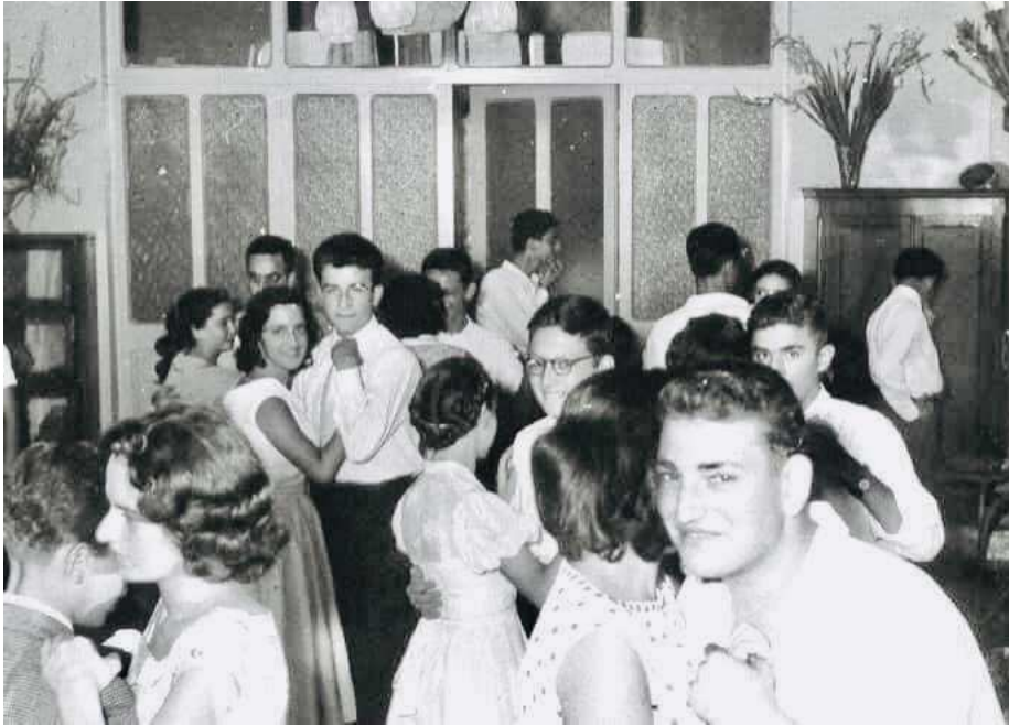
Image n° 5 : Une Surboum des jeunes Juifs à Beyrouth en 1956