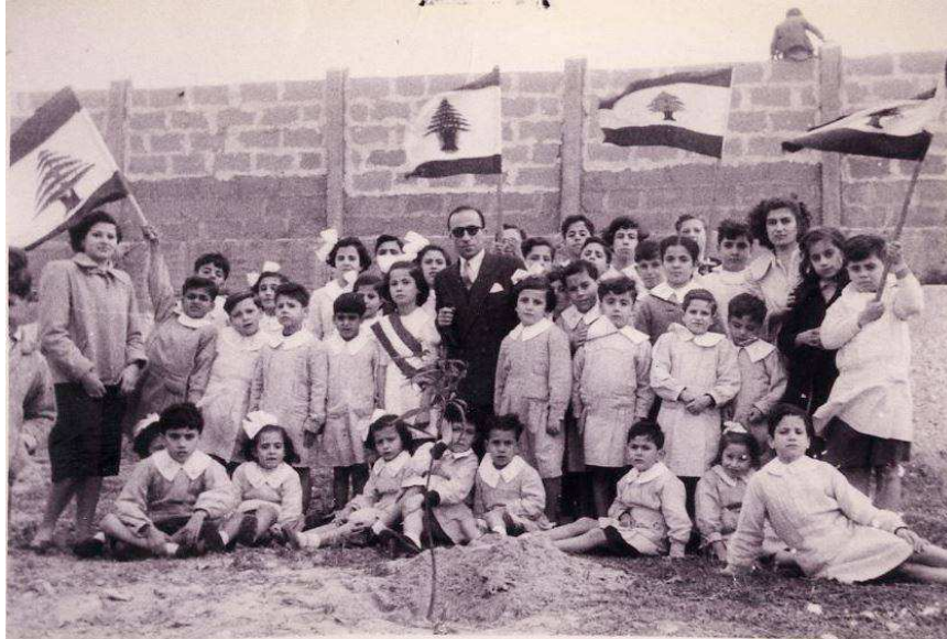
Image n° 7 : Élèves de l'AIU à Sidon en 1952. Élèves de l'AIU à Sidon en 1952.

La période que va maintenant connaître le Liban de 1950 à 1958 passe pour avoir associé, pour ses citoyens juifs, un état d'esprit sans souci, un vigoureux essor économique et une cohabitation paisible avec les autres communautés. C'est pourquoi on a pu la nommer l'âge d'or du Liban. Mais le net repli sur soi-même de la communauté juive que l'on peut constater entre ces deux dates, associé à une émigration croissante qui va encore s'accélérer après la crise de 1958 et à des conditions de vie quotidiennes de plus en plus dangereuses, permet de porter un regard nettement plus nuancé sur ce prétendu âge d'or.