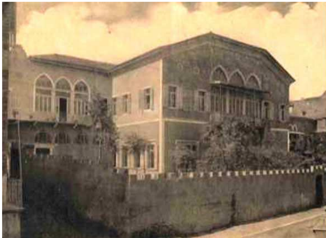
Image n° 8 : Façade de l'école de l'Alliance de Beyrouth en 1948