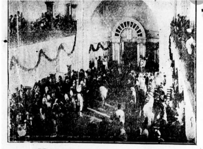
Image n° 2 : La célébration de l'ouverture de la Grande Synagogue Maghen Avraham en 1926.

français oscilla entre le soutien tacite du système confessionnel en cours de formation et un désintérêt politique, concrétisé par le renoncement volontaire à toute représentation directe au sein de la Chambre libanaise. À la place c'est un parlementaire protestant, le Dr. Ayoub Tabet, qui se chargea à partir de 1926 de parler en son nom, au grand dam de nombre de ses membres 977 .