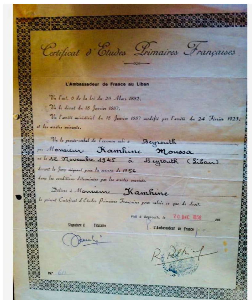
Image n° 11 : Copie de son Certificat d'Études Primaires Françaises à l'école de l'AIU à Beyrouth en 1956