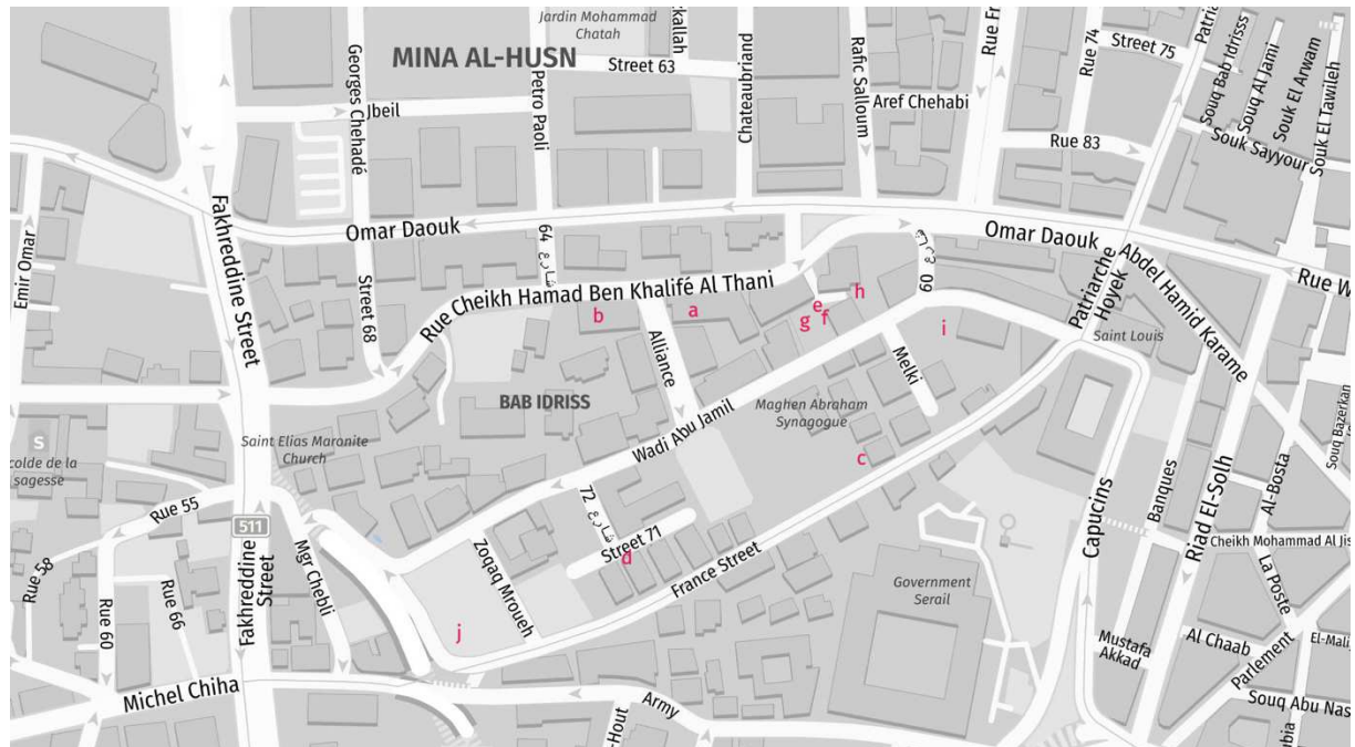
Carte n° 1 : Le quartier beyrouthin d'Abou Wadi Jamil