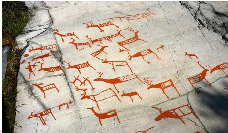
Fig. 1. Les gravures rupestres d'Alta.

En Scandinavie, on a retrouvé de nombreuses représentations picturales d'animaux qui datent de l'époque préhistorique. Ces représentations en forme de gravures rupestres montrent des animaux sauvages aussi bien que des animaux domestiques. Dans certains cas, les gravures montrent une interaction entre animaux et humains, comme dans la scène de chasse représentée ci-dessous où le chasseur se trouve en face d'un troupeau de rennes. 6