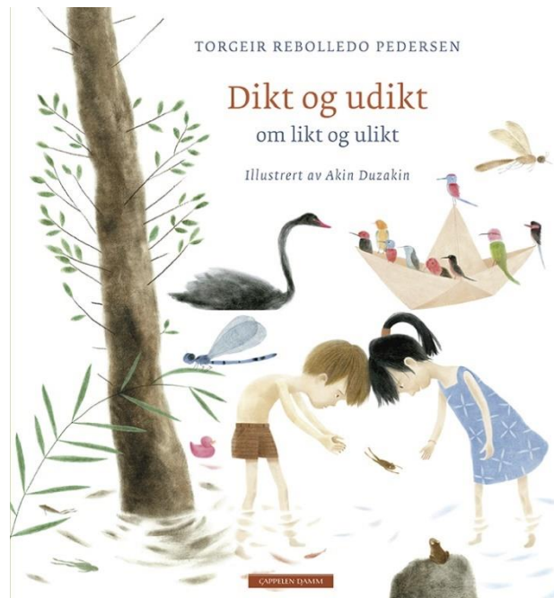
Fig. 4, Torgeir Rebolledo Pedersen & Akin Duzakin, Dikt og udikt om likt og ulikt (2016).

Dans plusieurs poèmes du recueil, les enfants communiquent entre eux sans employer la langue verbale. Selon Krogstad, ceci crée une ouverture à une situation où d'autres espèces peuvent participer aux échanges. En valorisant la communication non verbale, le texte remet en question la vision anthropocentriste du rapport entre humains et non-humains.