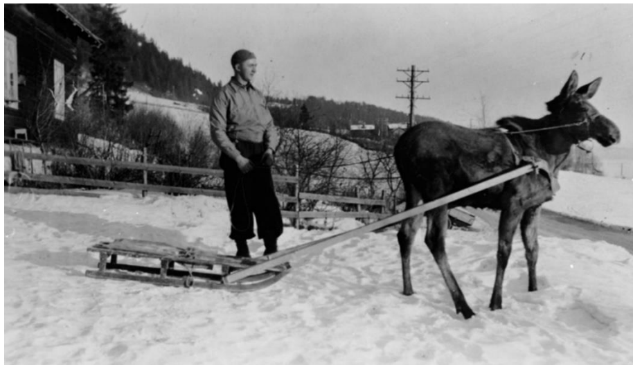
Fig. 7, Élan domestiqué. Ringsaker, Norvège.

Dans le roman Doppler d'Erlend Loe, déjà présenté dans le chapitre sur les noms des animaux, un jeune élan se fait adopter par le personnage principal du nom d'Andreas Doppler. Après avoir perdu sa mère, qui a été sauvagement tuée par Doppler, il se transforme en animal de compagnie, et il va accompagner Doppler dans son exil dans les forêts d'Oslo 667 . Il y a des explications naturelles à ce qu'un animal sauvage s'attache à un humain. Selon l'éthologue Konrad Lorenz, un jeune animal va instinctivement s'identifier à sa mère. Si la mère est absente, il pourrait s'identifier à n'importe quel autre être. Lorenz, qui lui-même a fait l'expérience d'être le parent d'une portée d'oies, pense que le premier objet que l'animal voit à sa naissance laisse une empreinte. 668 Bien que le jeune élan du roman Doppler ait connu sa mère, son souhait d'être adopté par un humain pourrait être une allusion à ce mécanisme décrit par Lorenz. Dans les pays nordiques, on a occasionnellement essayé de domestiquer les élans pour les utiliser comme des animaux de trait, mais il s'agit le plus souvent de cas isolés où un jeune élan a été séparé de ses parents après un accident. Les tentatives d'élevage ont échoué à cause du caractère solitaire et territorial des élans. 669