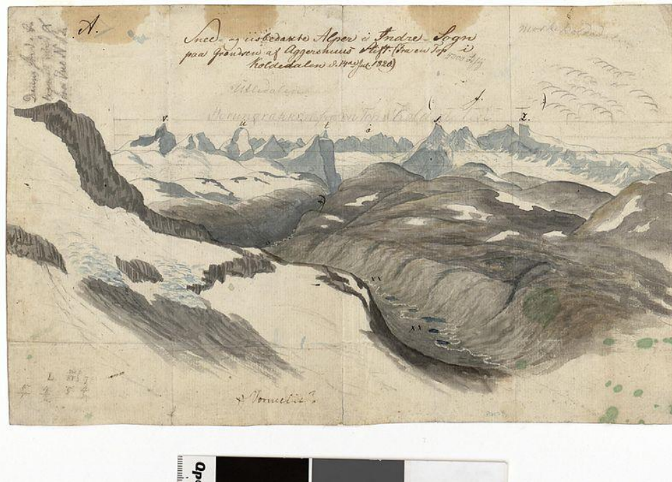
Fig. 5, Baltazar Mathias Keilhau, Souvenirs du voyage en montagne en 1820 , Nasjonalbiblioteket. https://commons.wikimedia.org/wiki/File:Erindring af Fjeldreisen i 1820 - no-nb digimanus 60181-25.jpg

montagnes de laides et désertes. 55 A l'époque, certaines parties du territoire norvégien n'étaient pas encore « découvertes ». En 1820, le géologue Balthazar Keilhau a effectué une excursion scientifique dans le massif montagneux qui plus tard sera nommé Jotunheimen . A la suite de son voyage, il a publié des aquarelles et des dessins représentant des paysages qui seront considérés comme typiquement norvégiens. Jusqu'alors cette région était connue seulement de la population locale. 56