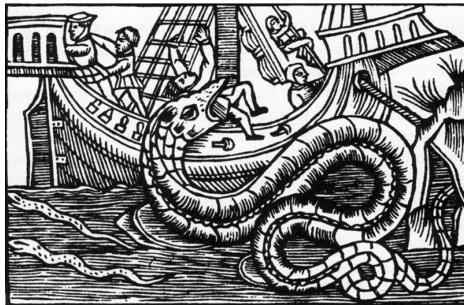
Fig. 2, Serpent de mer, gravure sur bois, Olaus Magnus, Historia de Gentibus Septentrionalibus , Rome, 1555, URL : https://commons.wikimedia.org/wiki/File:Sea_serpent.jpg

Dans son œuvre sur l'histoire des peuples des pays nordiques, Historia de Gentibus Septentrionalibus , l'historien suédois Olaus Magnus (1490-1557) fait une description de la faune scandinave. 8 Parmi les animaux présentés par l'ouvrage, on remarque un serpent de mer aux dimensions énormes : Il serait de 60 mètres de long et 6 mètres de large. L'ouvrage présente une gravure où le monstre s'attaque à l'équipage d'un navire.