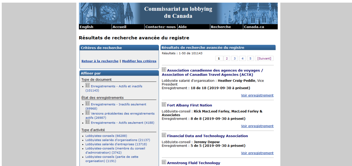
Image n°1 : Capture d'écran du registre des lobbyistes du système fédéral canadien