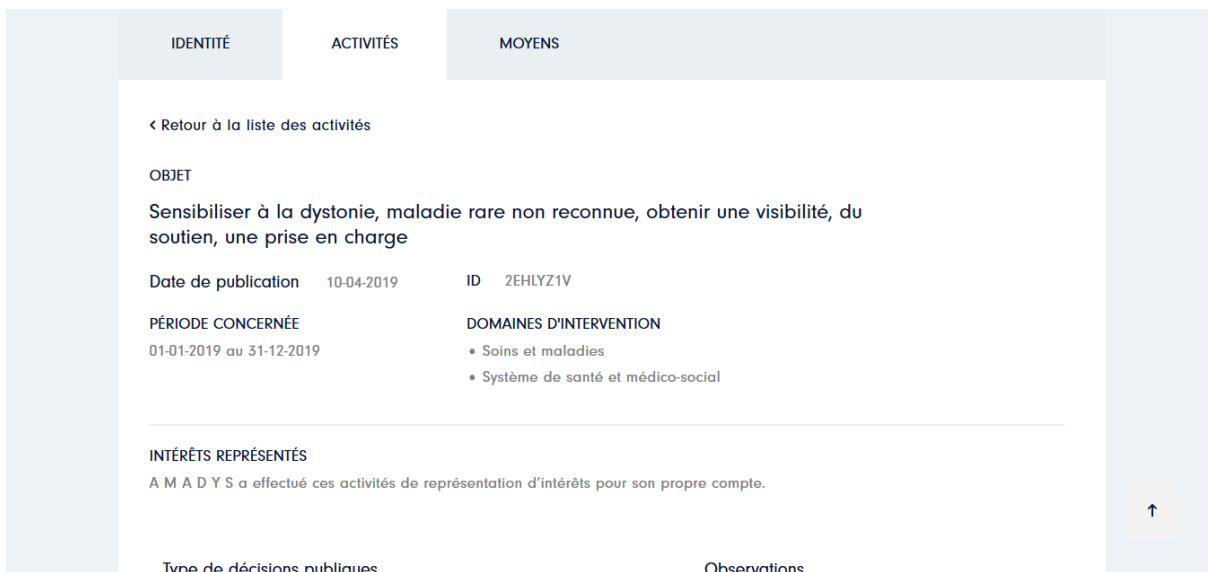
Image n°4 : Capture d'écran du répertoire des représentants d'intérêt français