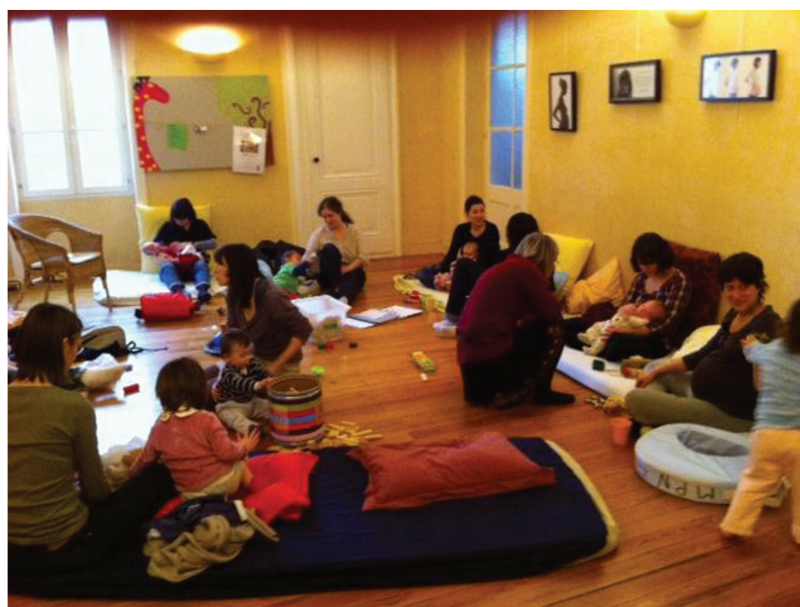
Figure 6. Un entre soi féminin dans la continuité avec les pratiques des pionnières. « Les moments partagés » au sein de l'association La Voix des parents.