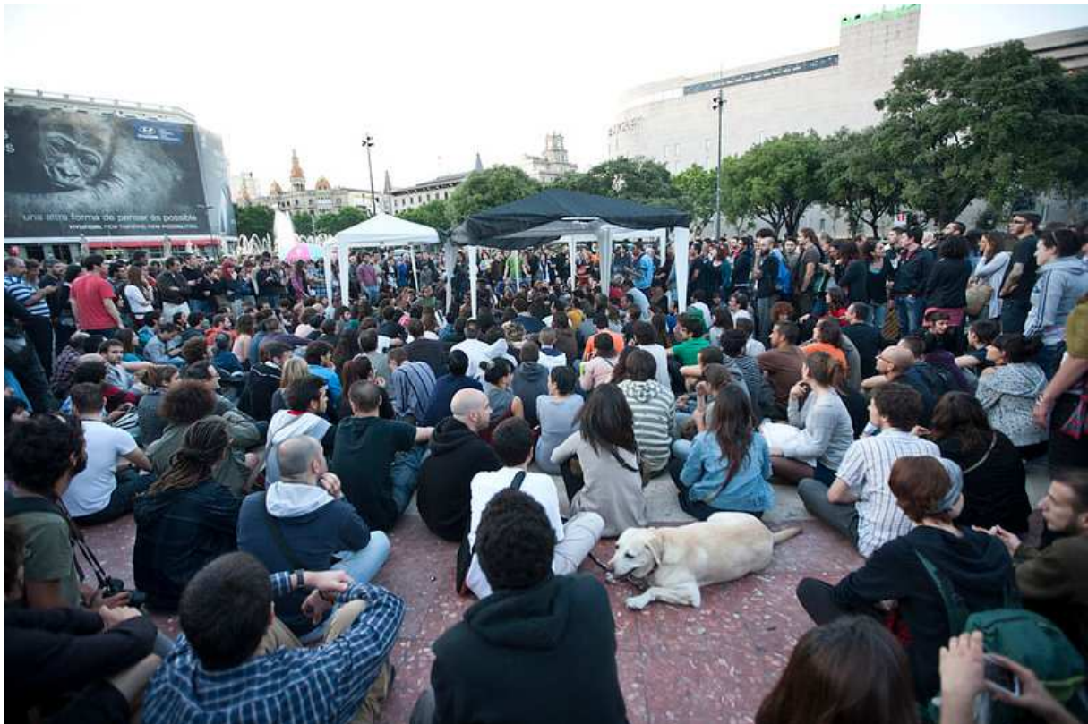
ANONYME, Fotomovimiento , Place de la Catalogne, Barcelone, 17 mai 2011

A Barcelone, Istanbul et Paris, des assemblées de différentes tailles émergent au sein des campements. Ces dispositifs de prises de parole portent le nom d'assemblées générales (« AG ») à Barcelone et Paris tandis qu'on parle de « forums 168 » à Istanbul, bien que ces derniers apparaissent surtout après l'occupation du parc pendant l'été 2013. On trouve trace de ces « assemblées » (nous verrons s'il est justifié ou non de parler d'« assemblées ») dans les archives photographiques qu'il est nécessaire de contextualiser.