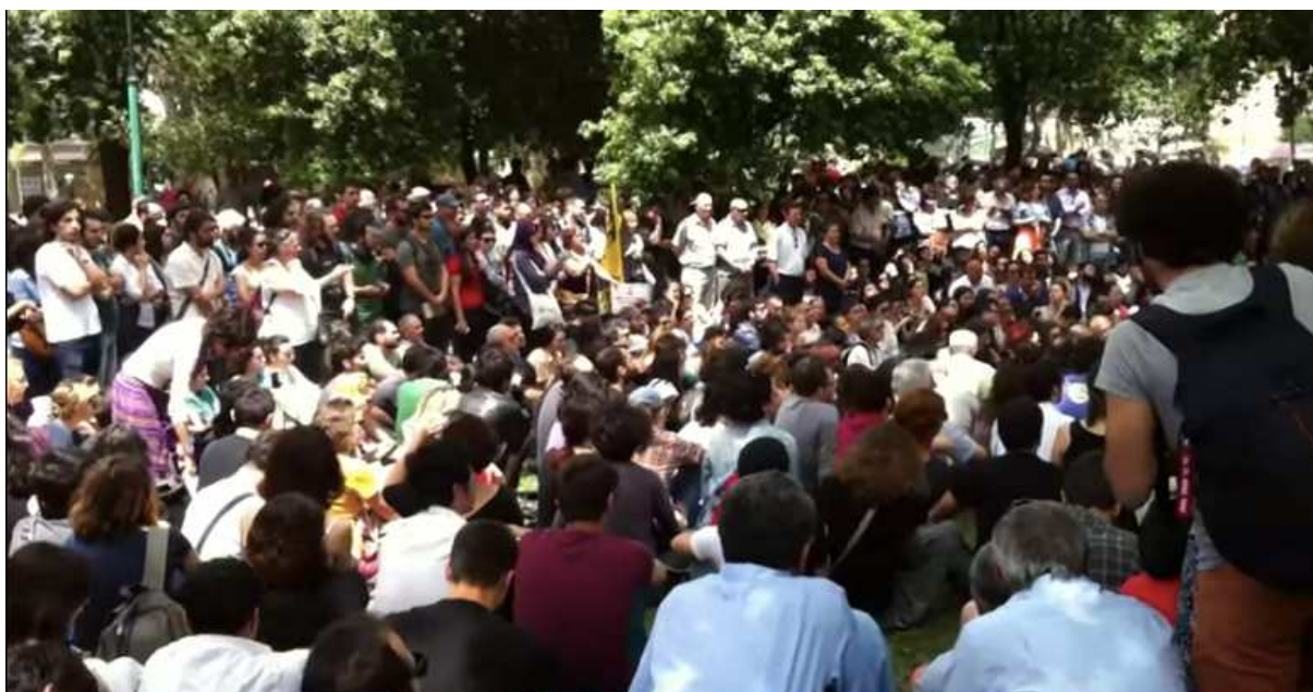
Premier forum du parc Gezi (Gezi Parkı'nda ilk forum), 30 mai 2013,0'33. Accessible en ligne :[ https://bak.ma/JZ/player/00:00:17.143 ]

On y distingue une foule compacte qui se tient à l'ombre des platanes menacés de destruction. En apparence, elle semble relativement mixte du point de vue du genre et de l'âge. Surtout la configuration est comparable à celle observée sur la place de la Catalogne : au centre, la plupart des participants sont assis en cercle tandis que les autres se tiennent debout ; surtout, les regards sont tournés dans la même direction, vers un orateur ou une oratrice qui reste hors-champ. Ce « forum » se déroule le 30 mai 2013 après deux jours d'affrontements croissants avec la police. D'un point de vue extérieur, il présente un aspect plus horizontal que le dispositif vertical de la tribune caractéristique des meetings politiques ou des sit-in. La vidéo dont la photographie est extraite (qui ne dure que deux minutes) montre la proximité avec les tentes installées à quelques dizaines de mètres.