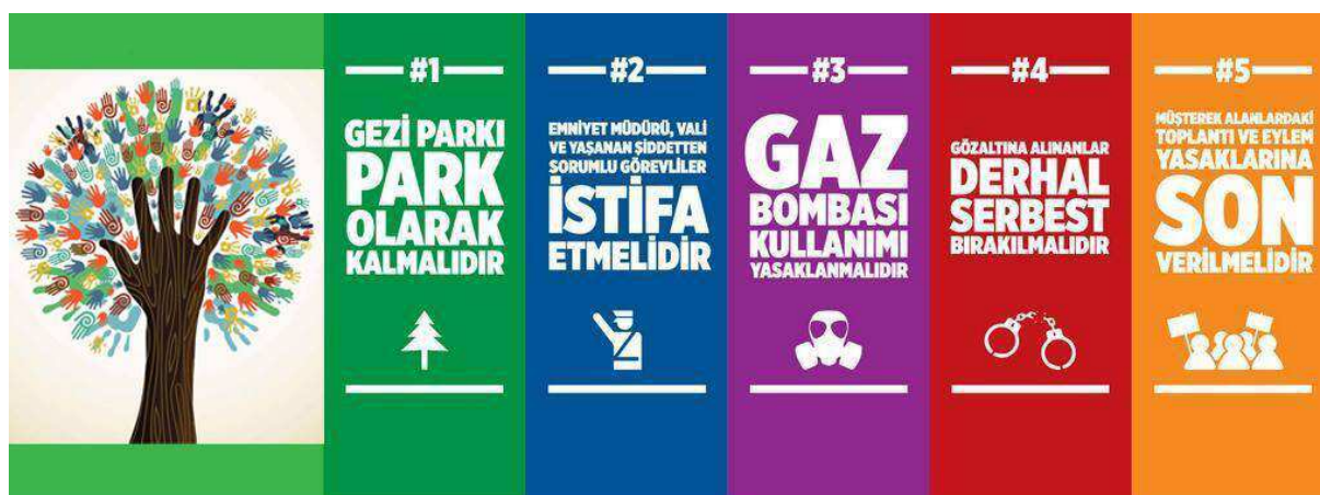
Revendications de Gezi présentées par la plate-forme « Solidarité Taksim », juin 2013.

L'occupation qui démarre par un sit-in pacifique est déjà en soi une revendication pour défendre le parc mais celle agrège une multiplicité de griefs qui reflète la composition bigarrée du mouvement. Le 5 juin 2013, des membres de la plate-forme « Solidarité Taksim » rencontrent le premier Ministre adjoint Bülent Arınç pour négocier une issue à la situation de crise que traverse le pays. Dans le même temps, la plate-forme publie un document qui récapitule les principales demandes de la protestation en cours. La première concerne la sauvegarde du parc de Gezi en l'état (« #1 Le parc Gezi doit rester comme un parc touristique ») tandis que les quatre autres griefs portent sur la répression de la mobilisation en cours : démission des responsables impliqués dans la répression policière 1663 , interdiction des bombes lacrymogènes comme instrument de maintien de l'ordre 1664 , libération et abandon des charges pour les manifestants arrêtés 1665 et enfin levée des interdictions qui entravent les libertés de rassemblement et d'expression 1666 .