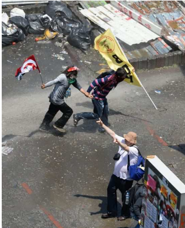
Place Taksim , date inconnue

Sur cette image prise par l'agence de presse Doğan News Agency (DHA) pendant l'occupation de Gezi , deux personnes aux visages recouverts par des écharpes se tiennent par la main pour prendre la fuite. Une troisième personne, un homme plus âgé avec un bob, se tient dans l'autre sens. On voit que les deux premiers se protègent le visage, très probablement à cause des fumées des gaz lacrymogène. L'eau qu'on distingue à leurs pieds vient sûrement des canons dont sont équipés les camions TOMA de la police turque. On aperçoit aussi des poubelles jetées au sol, signe de rupture du quotidien sur la place Taksim. Le danger qui les poursuit reste hors-champ mais on devine qu'il s'agit des forces de l'ordre turques. On peut imaginer qu'ils se replient vers le parc.