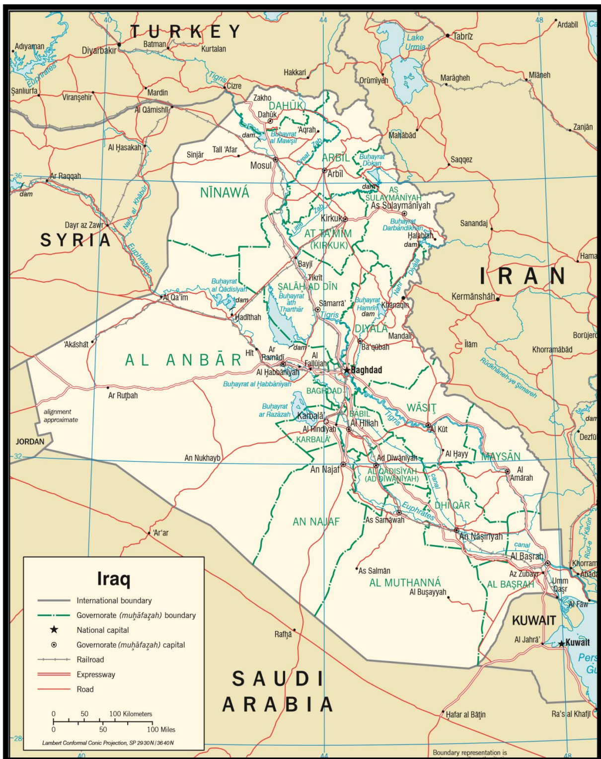
Carte de l'Irak contemporaine