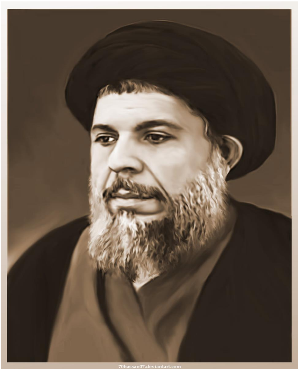
Portrait de Muhammad Baqir al-Sadr