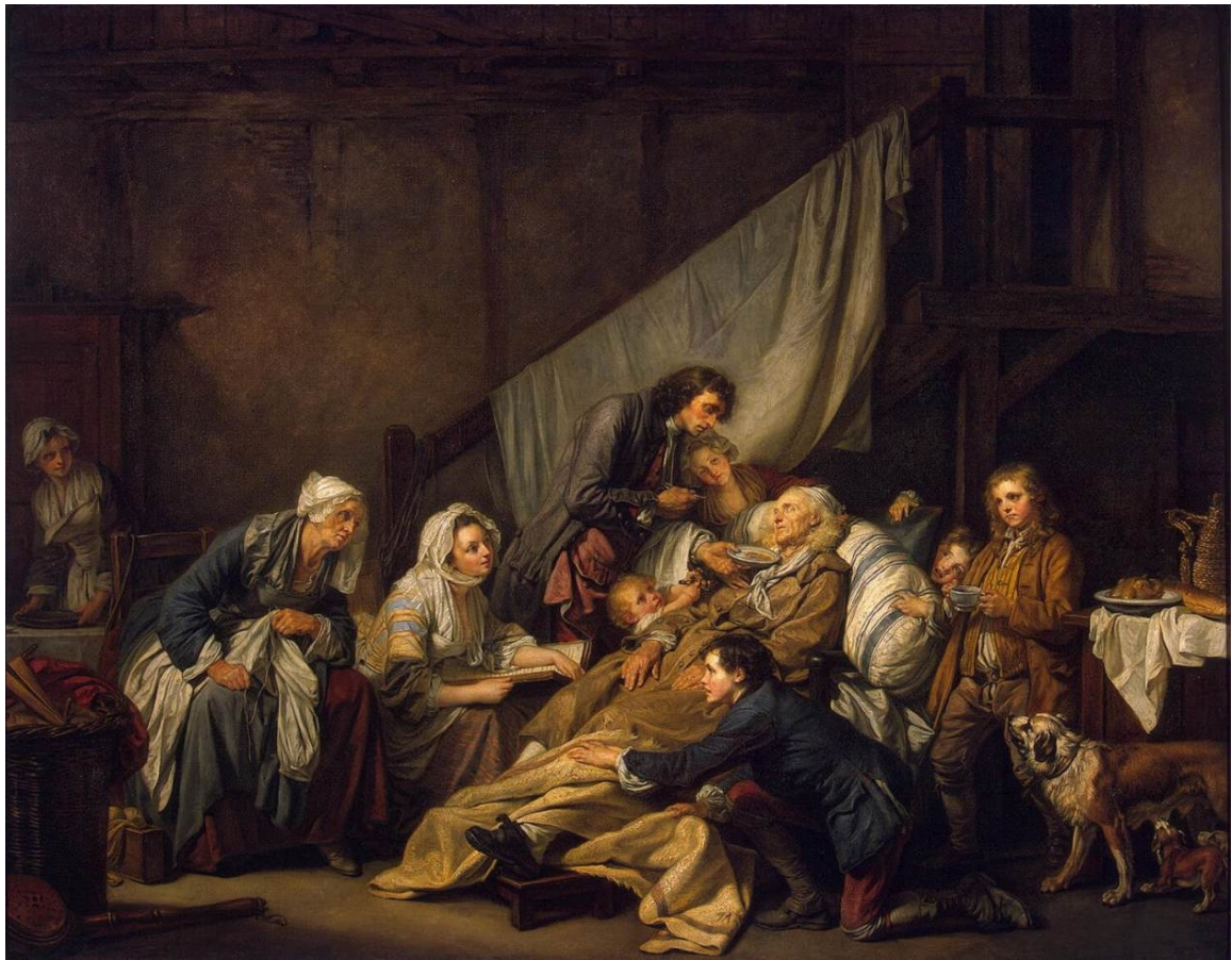
Jean-Baptiste , La Piété filiale ou Le Paralytique

Dans la description que donne Diderot des personnages de la Piété filiale se lit la tentative à peine voilée d'y trouver une forme de chronopoiétique, c'est-à-dire de « restitution du flux temporel 1379 », ici dans la représentation picturale. En effet, les personnages les plus jeunes sont gais, dit Diderot, « parce qu'ils ne sont pas encore à l'âge où l'on sait ». Ainsi, l'ignorance et l'insouciance sont associées à la jeunesse. Dans le discours diderotien, les « plus grands » prennent la suite, comme si le texte avait la charge de réorganiser sur une liste chronologique ce que le tableau doit mettre sur un plan. Si le texte recherche une chronopoiétique du tableau, force est de constater que c'est dans son agencement propre qu'il la produit, et qu'il ne la trouve pas telle quelle dans l'œuvre picturale. Aux plus jeunes succèdent donc le gendre et la fille mariée, puis enfin la vieille mère presque éteinte – à chaque âge, la peine prend un nouveau visage. Chez cette dernière, il est poétique, voire virgilien : on retrouve le principe du ut pictura poesis cher à Diderot.