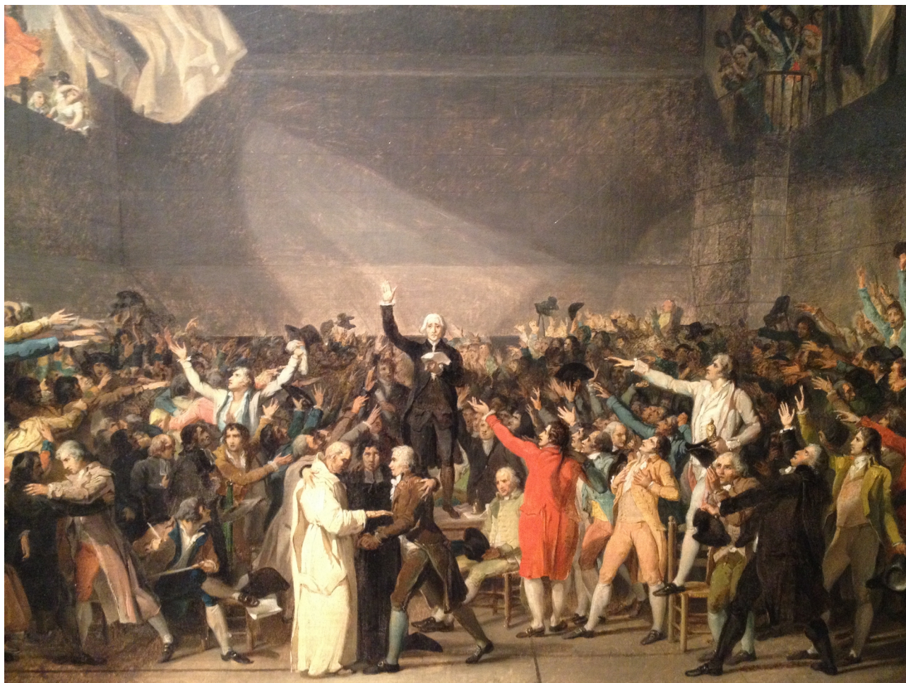
J.-L. DAVID, Le Serment du Jeu de Paume (étude) , 1791

Avec le Serment du Jeu de Paume , David s'inscrit dans la continuité du régime d'historicité révolutionnaire, fondé sur un parallèle entre l'esprit civique romain et un nouvel esprit civique français 911 . Les deux Serments ont en commun d'utiliser le geste même du serment pour orienter l'œil du spectateur. Prêter serment, c'est montrer ce qui fait la force politique – dans un cas, l'épée, dans l'autre, la double concorde des trois ordres entre eux et de la Nation naissante avec la lumière qui entre par la fenêtre de la salle, double référence mystique et philosophique.